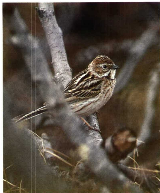
110 Pallas's Reed Bunting / Pallas' Rietgors Emberiza pallasii , female, Novaya river, Taimyr, Russia, July 1991 ( Arie Ouwerkerk )

Per Alström (in litt) has commented as follows: 'Since the colour of the lower mandible of male Pallas's Reed Bunting changes from pale pinkish in the non-breeding season to blackish in the breeding season (though in some individuals it remains pinkish), it seems possible that some females also get an all dark lower mandible in summer. I have not seen any females with all black lower mandibles, though I have seen many in late spring and summer with the lower edge of the lower