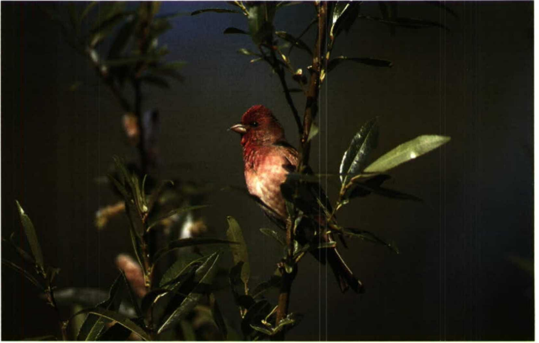
130 Roodmus / Scarlet Rosefinch Carpodacus erythrinus , Lepelaarsplassen, Flevoland, juni 1994 (Peter van Rij)