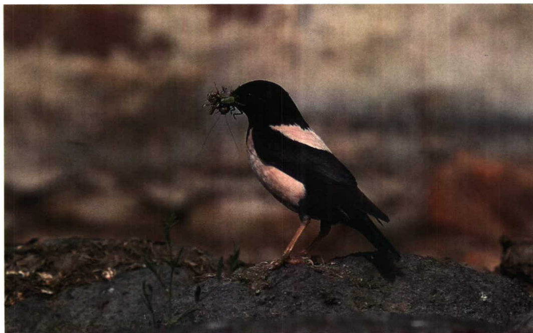
116 Rosy Starling / Roze Spreeuw Sturnus roseus , Hortobágy, Hungary, 10 July 1994