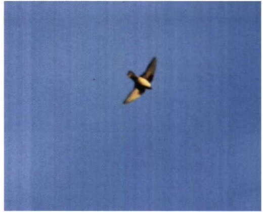
133 Rotszwaluw / Crag Martin Ptyonoprogne rupestris , Zandhoven, Antwerpen, mei 1994 (Patrick Beirens)

van 22 tot 24 mei. Eén van de zware missers was de adult-zomer Bairds Strandloper Calidris bairdii die in de avond van 13 mei te Pecq-Warcoing, Hainaut, werd gemeld. Op 2 mei pleisterde kortstondig een Gestreepte Strandloper C. melanotos bij Uitkerke. De adulte Terekruiter Xenus cinereus in zomerkleed die van 13 tot 21 mei bij Semmerzake verbleef, was ons beter gezind. Een Grote Burgemeester Larus hyperboreus in eerste zomerkleed die op 14 mei te Heist, Westvlaanderen, en op 17 juni in de Voorhaven van Zeebrugge verbleef, was wellicht hetzelfde exemplaar dat reeds eerder aanwezig was. De enige Lachstern Gelochelidon nilotica vloog langs Bredene op 13 mei. Op 1 mei vlogen twee Reuzensterns Sterna caspia over Lier en trok bovendien diezelfde dag één exemplaar langs Sint-Agatha-Rode, Brabant. Een ietwat aberrante Dougalls Stern Sterna dougallii verbleef op 30 juni in de Voorhaven van Zeebrugge. Er werden Witwangsterns Chlidonias hybridus gezien in de Voorhaven van Zeebrugge op 7 mei; te Orroir, Hainaut (drie) op 14 en 15 mei; te Blokkersdijk van 16 tot 18 mei; en te Pomme-reoul-Hensies, Hainaut (twee) op 22 mei. De enige Witvleugelstern C. leucopterus werd op 23 mei ontdekt bij Péronnes, Hainaut.