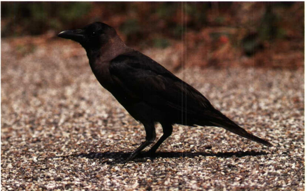
131 Huiskraai / House Crow Corvus splendens , Hoek van Holland, Zuidholland, 30 juni 1994 (Arnoud B van den Berg)