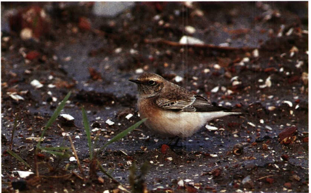
102 Pied Wheatear / Bonte Tapuit Oenanthe pleschanka , first-winter male, Petten, Noordholland, October 1992