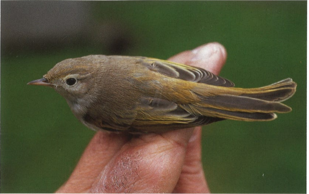
103 Western Bonelli's Warbler / Westelijke Bergfluitier Phylloscopus bonelli bonelli , Texel, Noordholland, 8 October 1992