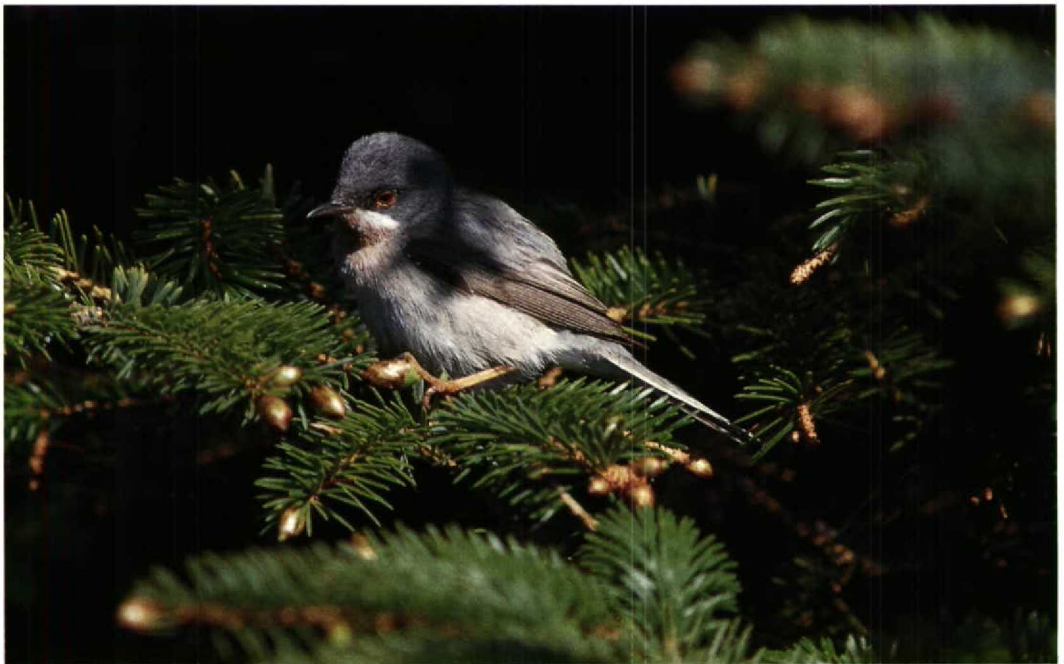
114 Subalpine Warbler / Baardgrasmus Sylvia cantillans , Utsira, Rogaland, Norway, May 1994