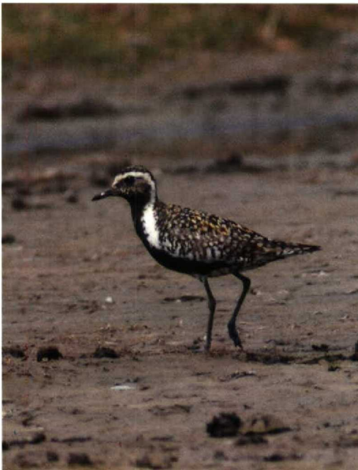
134 Aziatische Goudplevier / Pacific Golden Plover Pluvialis fulva , Bakkersdam, Petten, Noordholland, 24 juli 1994 (Arnoud B van den Berg)