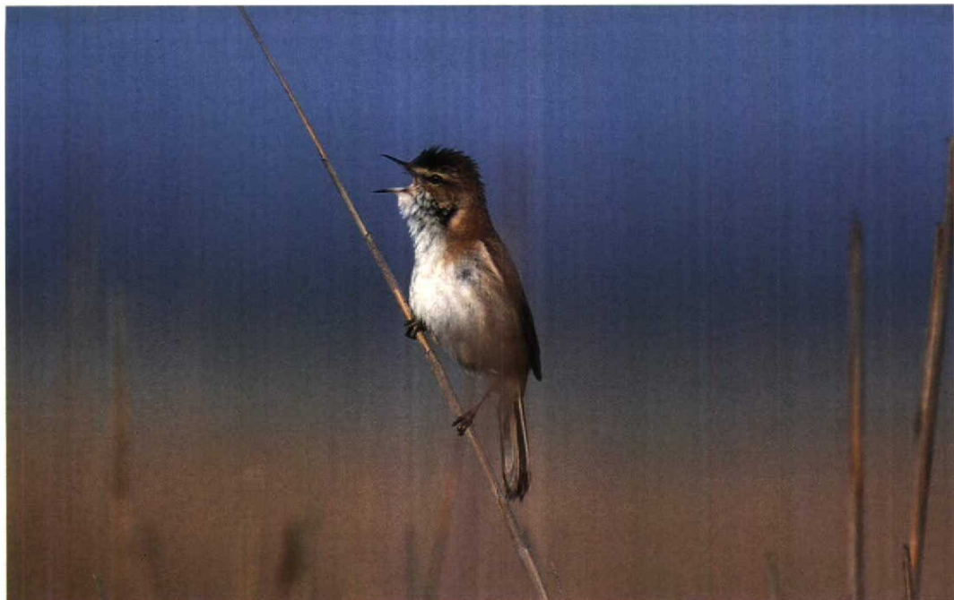
115 Paddyfield Warbler / Veldrietzanger Acrocephalus agricola , Lake Durankulak, Bulgaria, 15 May 1994