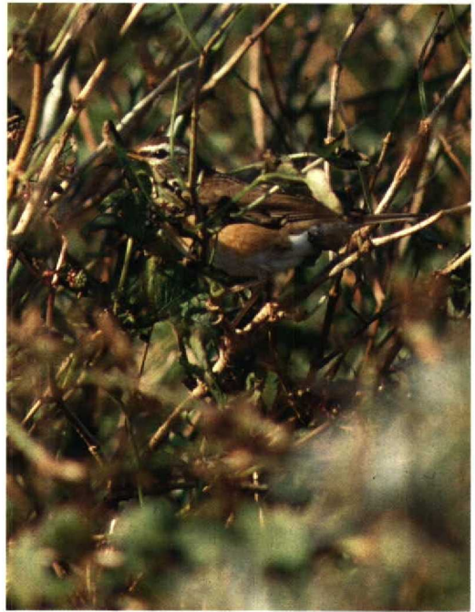
97 Eagle Owl / Oehoe Bubo bubo , Ermelo, Gelderland, May 1992 (Aart Smit) 98 Eyebrowed Thrush / Vale Lijster Turdus obscurus , Callantsoog, Noordholland, 18 October 1992 (Danny Ellinger) 99 Squacco Heron / Ralreiger Ardeola ralloides , Rammegors, Zeeland, June 1992 (Hans Gebuis) 100 Sociable Plover / Steppiekievit Chettusia gregaria , Ubbergen, Gelderland, August 1992 (Hans Gebuis)