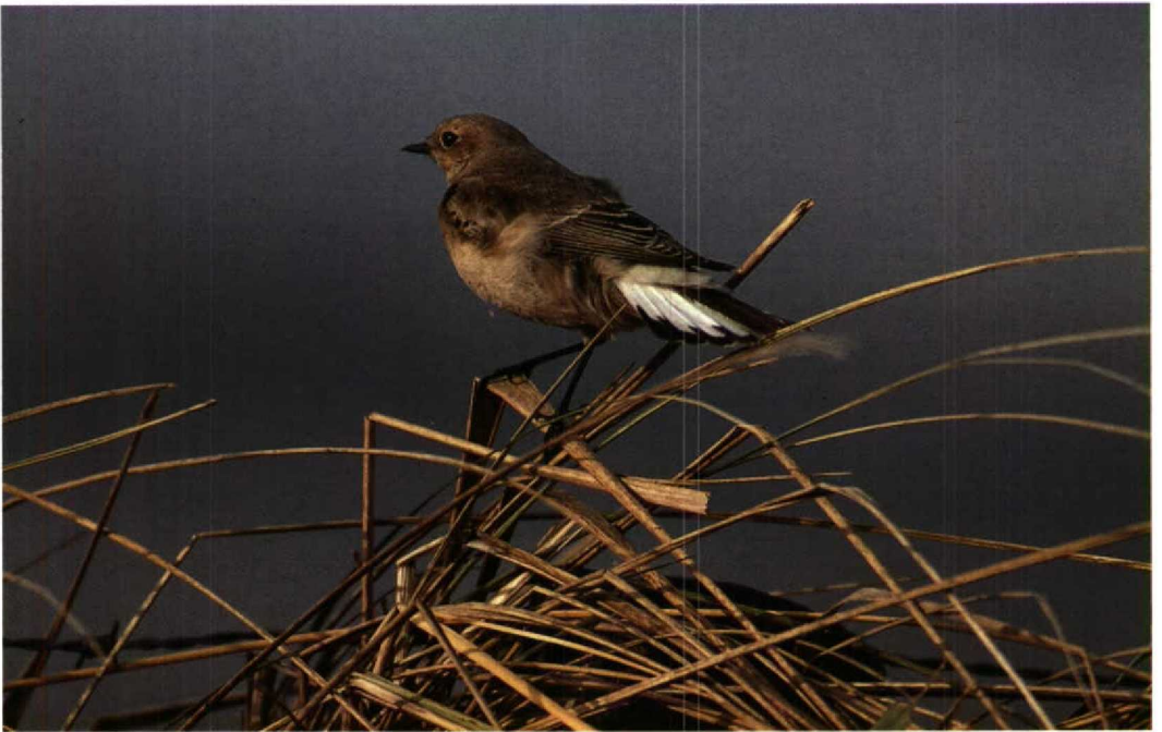
101 Pied Wheatear / Bonte Tapuit Oenanthe pleschanka , first-winter female, Katwijk, Zuidholland, November 1992