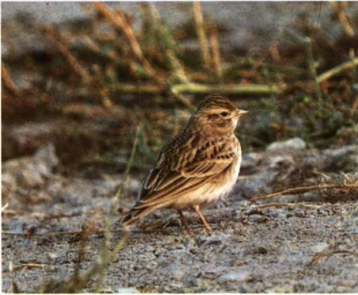
105 Short-toed Lark / Kortteenleeuwerik Calandrella brachydactyla , Eemshaven, Groningen, 29 September 1992 (Arnoud B van den Berg)