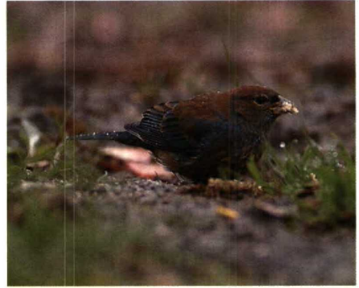
106 Indigo Bunting / Indigogors Passerina cyanea , Amsterdam, Noordholland, March 1989

dered by the CDNA. The CDNA still awaits information on several trapped birds in this and previous years (cf van Dongen et al 1992, van den Berg et al 1993)