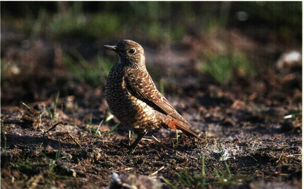
112 Rock Thrush / Rode Rotslijster Monticola saxatilis , Noordburen, Noordholland, Netherlands, 13 May 1994