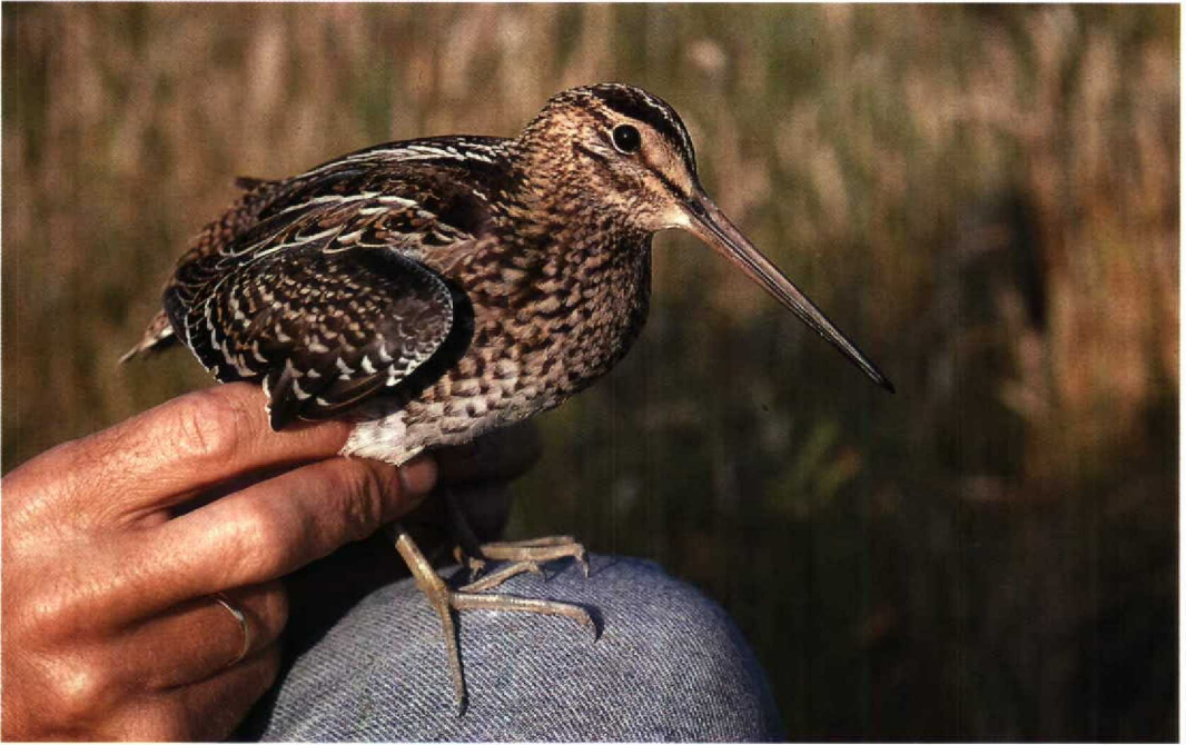
111 Great Snipe / Poelsnip Gallinago media , Zandvoort, Noordholland, 26 July 1994 (Arnoud B van den Berg; Vrs AW-duinen)