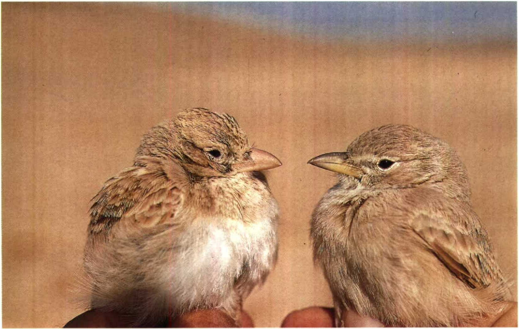
3 Dunn's Lark / Dunns Leeuwerik Eremalauda dunnii (left) and Desert Lark / Woestijnleeuwerik Ammomanes deserti , Israel, winter of 1988/89