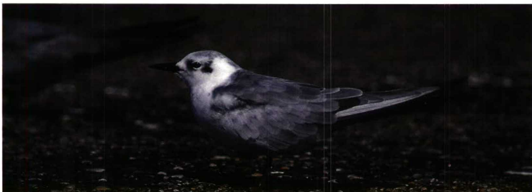
176 Kleine Zilverreigers / Little Egret Egretta garzetta , Zonnemaire, Zeeland, augustus 1994 177 Zwarte Zeekoet / Black Guillemot Cepphus grylle , juveniel, IJmuiden, Noordholland, 25 augustus 1994 178 Blonde Ruiters / Buff-breasted Sandpiper Tryngites subruficollis , adult, Julianadorp, Noordholland, 3 september 1994 179 Bonapartes Strandloper / White-rumped Sandpiper Calidris fuscicollis , adult, Holwerd, Friesland, 19 augustus 1994 180 Witvleugelstern / White-wing- ed Black Tern Chlidonias leucopterus , Dashorstdijk, Flevoland, augustus 1994