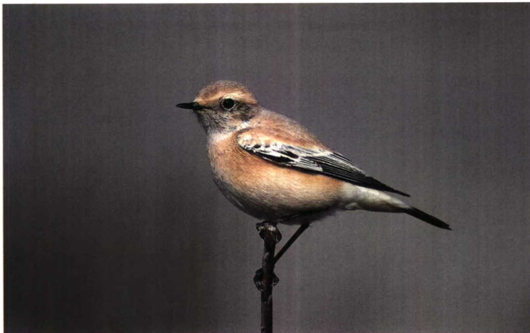
183 Woestijntapuit / Desert Wheatear Oenanthe deserti , Zandvoort, Noordholland, 9 oktober 1994