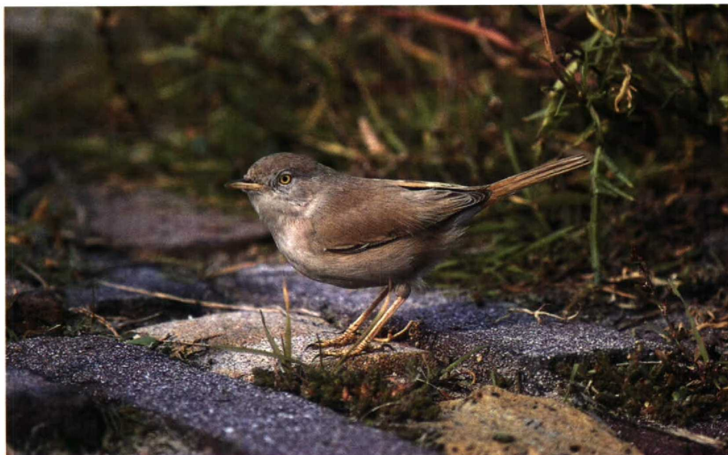
184 Woestijngrasmus / Desert Warbler Sylvia nana , Zandvoort, Noordholland, 8 oktober 1994 (Marten van Dijk)