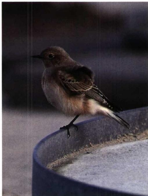
166-167 Bonte Tapuit / Pied Wheatear Oenanthe pleschanka , vermoedelijk eerste-winter vrouwtje, Katwijk, Zuidholland, 3 november 1992 (Arnoud B van den Berg)