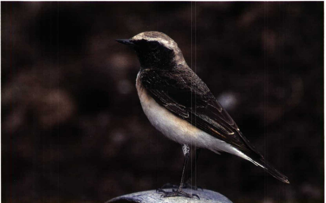
143 Pied Wheatear / Bonte Tapuit Oenanthe pleschanka , first-summer male, Eilat, Israel, 1 April 1993. Same bird as in plate 139 (Leo J R Boon)