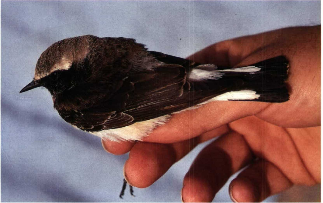
142 Pied Wheatear / Bonte Tapuit Oenanthe pleschanka , first-summer male, Eilat, Israel, 31 March 1993