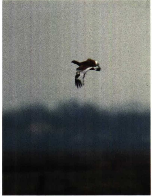
25 Zeearend / White-tailed Eagle Haliaeetus albicilla , Lauwersmeer, Friesland, 31 december 1993 26 Kleine Trap / Little Bustard Tetrax tetrax , Grijskerke, Zeeland, december 1993 27 Pestvogel / Bohemian Waxwing Bombycilla garrulus , Zeewolde, Flevoland, december 1993