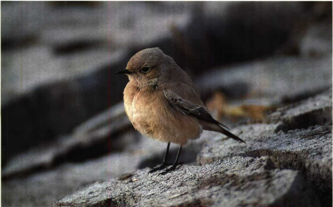
22 Desert Wheatear / Woestijntapuit Oenanthe deserti , Heacham, Norfolk, England, November 1993

was reported from Eilat. A Barred Warbler S. nisoria at Fareham, Hampshire, England, on 30 November was even later than the one at Newcastle, Wicklow, Ireland, on 16-22 November (cf Dutch Birding 15: 281, 1993). In Britain, c 15 Pallas's Warblers Phylloscopus proregulus were reported during November. In France, only one was found this autumn, in Vannes, Morbihan, on 31 October. Hume's Yellow-browed Warblers P. humei were seen on Christiansø, Denmark, on 28-31 October, at Flamborough Head, Humberside, England, on 5-9 November and at Strumble Head, Dyfed, Wales, on 20 November. A Short-toed Treecreeper C. brachydactyla remained present at Dungeness, Kent, England, until at least 11 December (cf Dutch Birding 15: 281, 1993). A Dusky Warbler Phylloscopus fuscatu s was present at Santa Barbara, California, USA, on 22-23 October. In the Netherlands, after being eradicated in the 1920s, Ravens Corvus corax were re-introduced in 1966, and in 1976-86 3-9 pairs bred annually in the Veluwe, Gelderland, where numbers increased markedly since 1987 to 50 breeding and 31 territorial pairs in 1992 (Limosa 66: 107-166, 1993). In December, a Snowfinch Montifringilla nivalis was discovered on Mallorca, Spain. From 27 November until at least 9 January 1994, a first-winter male Two-barred Crossbill Loxia leucoptera remained at Baarn, Utrecht, the Netherlands. In Dorchester, Dorset, a Dark-eyed Junco Junco hyemalis on 7-19 November was trapped