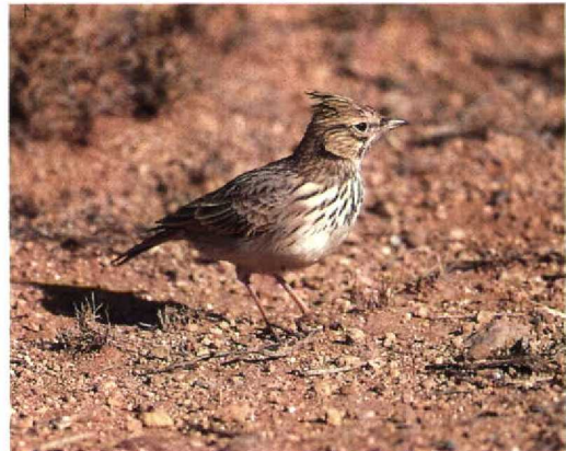
12 Thekla Lark / Theklaleeuwerik Galerida theklae showing short bill and crest, Zeida, Morocco, November 1990

Lark are longer than in European birds. Birds with intermediate bill length occur and may be difficult to identify. Occasionally, even in the field, the shape of the lower mandible is of help. In Crested Lark, the lower mandible is usually straight; the general impression is of a down-curved bill. In Thekla Lark, the lower mandible may be slightly upturned, thus giving the bill