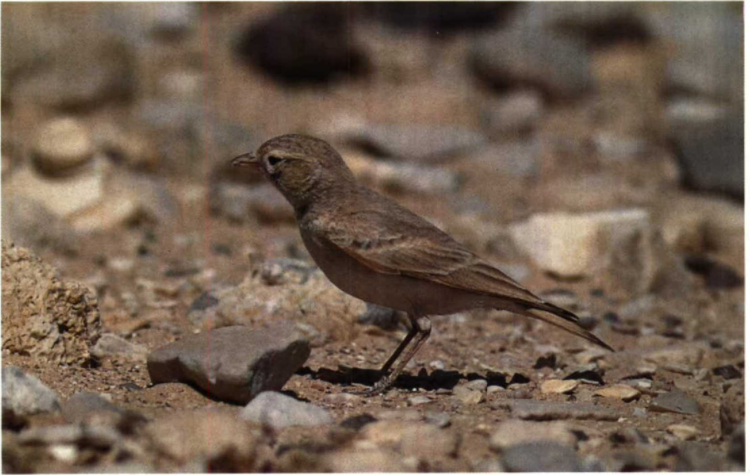
1 Bar-tailed Desert Lark / Rosse Woestijnleeuwerik Ammomanes cincturus , Eilat, Israel, March 1990