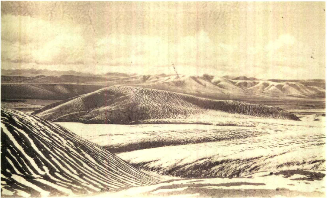
15 'On boundary of India and China, seen northward. Left one of the lakes we discovered and where I flushed 200 teal. Altitude of the pass 5500 m. 7 September 1929' (photograph and text by J A Sillem). Type locality of Sillem's Mountain-finch Leucosticte sillemi is on slope down left to lake in distance 16 'Our camp 59 after the snowstorm of last night' (photograph and text by J A Sillem). Photograph taken during lunch on 8 September 1929, a little north of type locality of Sillem's Mountain-finch Leucosticte sillemi , on Kushku Maidan plateau, western Tibet, at 5100 m