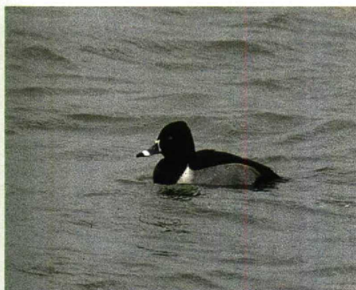
23 Ringsnaveleend / Ring-necked Duck Aythya collaris , Oostvaardersdijk, Flevoland, november 1993 24 Ringsnaveleend / Ring-necked Duck Aythya collaris , Oostvaardersdijk, Flevoland, november 1993