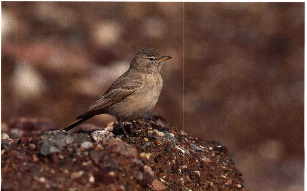
6 Desert Lark / Woestijnleeuwerik Ammomanes deserti , Eilat, Israel, March 1990 ( René Pop )