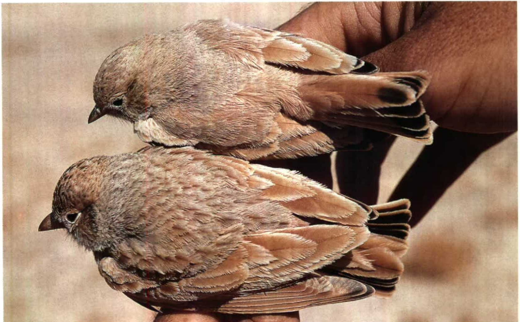
2 Bar-tailed Desert Lark / Rosse Woestijnleeuwerik Ammomanes cincturus (upper) and Dunn's Lark / Dunns Leeuwerik Eremalauda dunnii , Arava, Israel, November 1988 (Hadoram Shirihi)