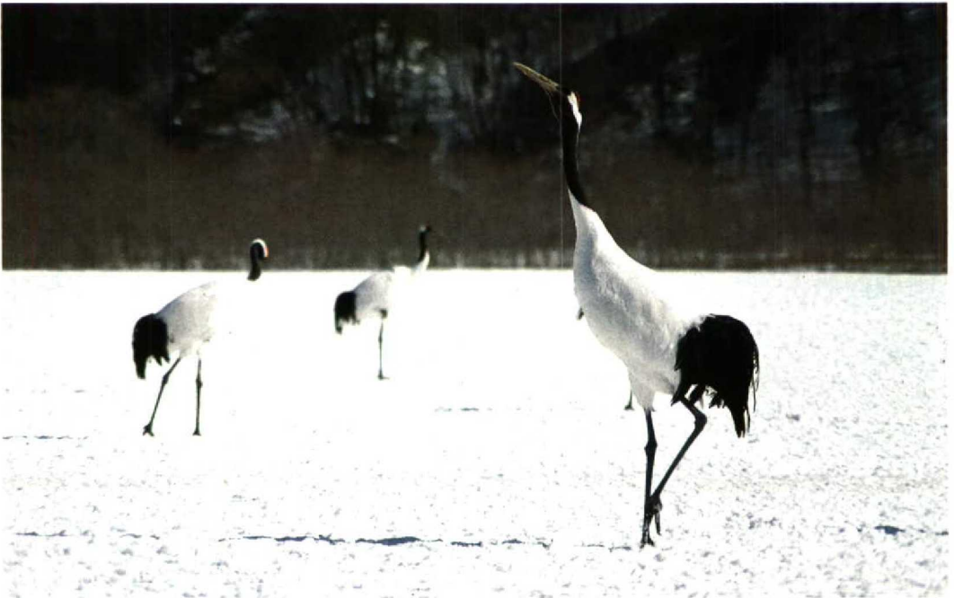
32 Japanese Crane / Chinese Kraanvogel Grus japonensis , Kushiro, Hokkaido, Japan, 5 March 1994