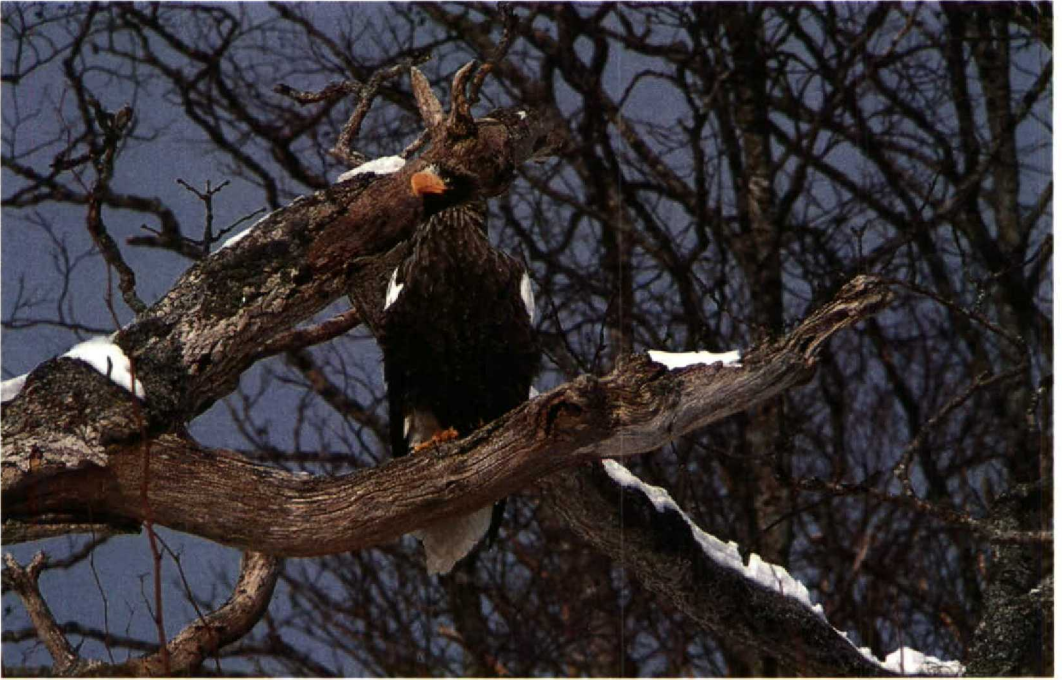
31 Steller's Sea Eagle / Stellers Zeearend Haliaeetus pelagicus , Hokkaido, Japan, February 1988