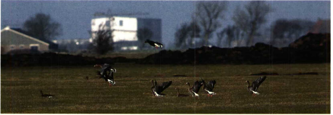
61 Dwergganzen / Lesser White-fronted Geese Anser erythropus , groep van zes, Ferwoude, Friesland, 30 januari 1994 62 Kleine Canadese Gans / Lesser Canada Goose Branta canadensis ssp, Wonneburen, Friesland, 30 januari 1994