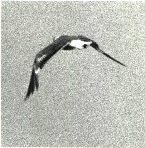
44 Franklin's Gull / Franklins Meeuw Larus pipixcan , first-year, moulting to first-summer or second-winter plumage, showing largely juvenile/first-winter-type wing and some juvenile rectrices, Wernhout, Noordbrabant, Netherlands, 15 June 1987

schuren (1976) recorded 'occasional individuals' in Chile in February 1976 with 'first-winter-type outer primaries and primary coverts and otherwise adult-like plumage', thought to be 'probably somewhat backward second-year individuals'.