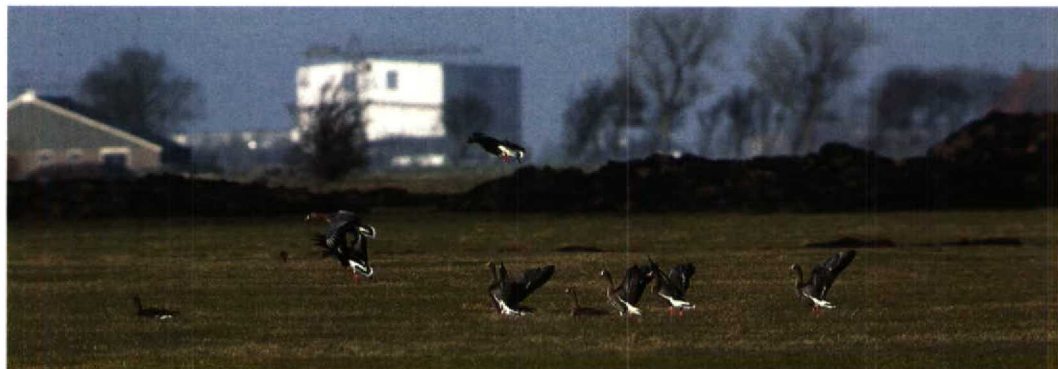
61 Dwergganzen / Lesser White-fronted Geese Anser erythropus , groep van zes, Ferwoude, Friesland, 30 januari 1994 (Arnoud B van den Berg) 62 Kleine Canadese Gans / Lesser Canada Goose Branta canadensis ssp, Wonneburen, Friesland, 30 januari 1994 (Paul Knolle)