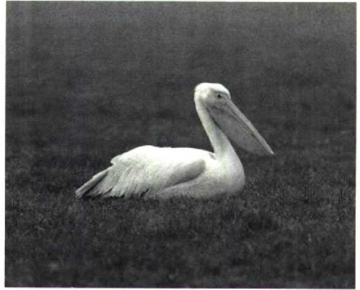
84 Roze Pelikaan / White Pelican Pelecanus onocrotalus , Havelte, Drenthe, november 1987 (Leo J R Boon)

Op grond van bovenstaande gegevens lijkt het (nog steeds) zeer goed mogelijk dat incidenteel wilde Roze Pelikanen afdwalen naar Westeuropa. Gezien de sterk teruggelopen broedpopulatie is de kans op (met name groepjes) zwerende vogels echter weliswaar aanzienlijk kleiner geworden maar daartegenover staat dat de toegenomen waarnemersintensiteit kan bijdragen aan een toename van het aantal meldingen. Hoewel ontsnapte vogels zeker verantwoordelijk kunnen zijn voor recente gevallen in Westeuropa, achten