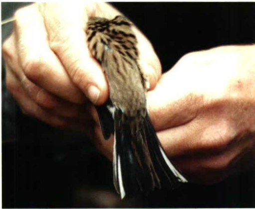
86-88 Maskergors / Black-faced Bunting Emberiza spodocephala , eerste-winter mannetje, Schiermonnikoog, Friesland, 28 oktober 1993 ( Bouke Henstra )

Lewington, I, Alström, P, & Colston, P 1991. A field guide to the rare birds of Britain and Europe. Londen.