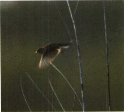
85 Cirlgors / Cirl Bunting Emberiza cirlus , Breskens, Zeeland, 16 mei 1992 (Jaap van 't Hof)

Geen enkele andere gors heeft een vergelijkbaar koppatroon. De grijzige, met de bruine rug en staart contrasterende stuit past alleen op Cirlgors. De waargenomen roep komt ook overeen met beschrijvingen van de contactroep. Een vrouwtje Geelgors, waar de Cirlgors het meest op lijkt, kan op basis van deze kenmerken worden uitgesloten.