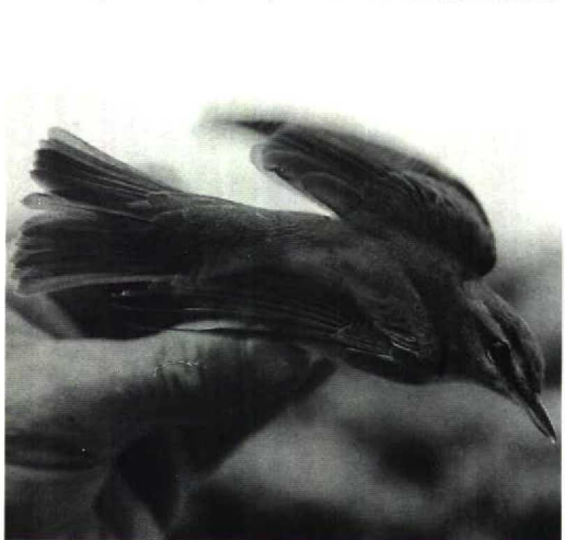
83 Roodoogvireo / Red-eyed Vireo Vireo olivaceus , Vlieland, Friesland, 24 september 1991

We apologize for this regrettable mistake. EDITORS