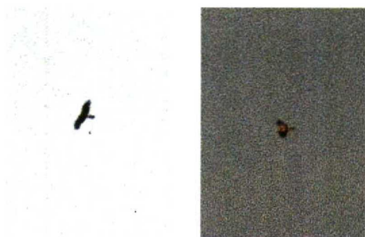
80-81 Dwergarend / Booted Eagle Hieraaetus pennatus , donkere vorm, Leersumse Veld, Utrecht, 30 mei 1992