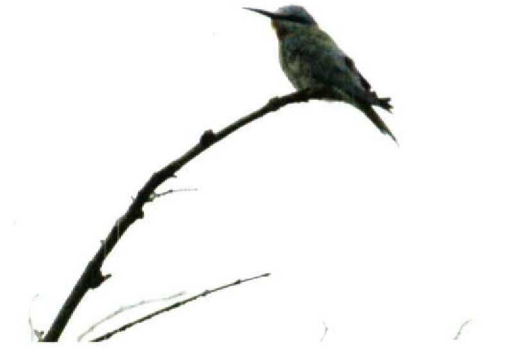
74 Blue-cheeked Bee-eater / Groene Bijeneter Merops persicus , Christiansø, Bornholm, Denmark, June 1989 75 Blue-cheeked Bee-eater / Groene Bijeneter Merops persicus (collected on Scilly, Engeland, 13 July 1921), Isles of Scilly Museum, St Mary's, Scilly, England, October 1992 76 Blue-cheeked Bee-eater / Groene Bijeneter Merops persicus , Cowden, Humberside, England, July 1989 77-79 Blue-cheeked Bee-eater / Groene Bijeneter Merops persicus , Texel, Noordholland, Netherlands, 30 September 1961