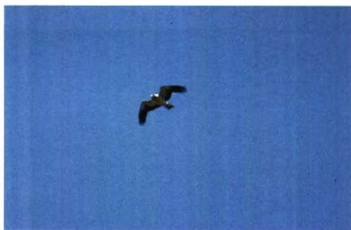
82 Dwergarend / Booted Eagle Hieraaetus pennatus , lichte vorm, Keersluisplas, Flevoland, 24 april 1993 (Hein Prinsen)

kwam DF tot de volgende reactie: 'Good to see the slides in original. My judgement is mainly based on slides 1, 2 and 4, which show most plumage details and it is: Booted Eagle! The shape of the bird is right for Booted, with longish and square-cut tail and rather short wings with ample tip. The coloration of the upperparts fits perfectly with Booted (upperwing and tail) and from below the pale inner primaries can be seen. Combining all the slides I think you can safely identify the bird as a Booted Eagle, despite the low quality of the slides. The plumage is OK for Booted and all the slides together show the shape of the bird reliably enough to rule out any similarly plumaged Buzzard or Honey Buzzard. In addition the observer has seen the white 'head-lights' at the wing bases, which can not be seen in the slides.'