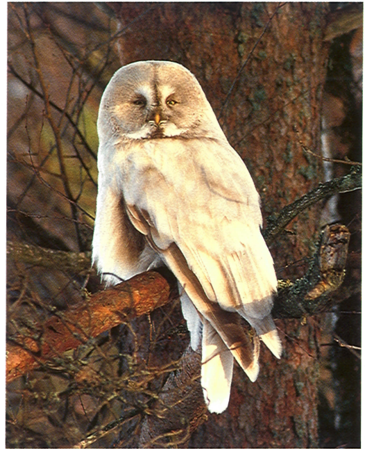
16 Leucistic Great Grey Owl / leucistische Laplanduil Strix nebulosa , Sonkari, Vesanto, Finland, 1 April 1994

During the winter of 1993/94, a late influx of Great Grey Owls occurred in eastern Finland. For instance, up to 10 individuals were found on a single local birding trip and Eagle Owls reported during day-time by non-birders often turned out to be Great Grey Owls. In March 1994, Pentti Alaja reported that Pirkko Siikamäki had found three Great Grey Owls at Sonkari, Vesanto, 60 km west of Kuopio, and that one was a very pale, possibly leucistic individual. We went to see the