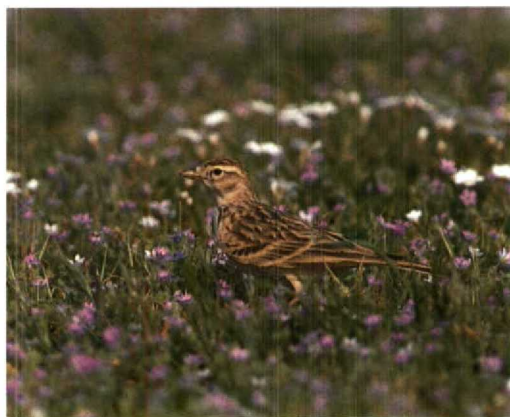
103 Vorkstaartplevier / Collared Pratincole Glareola pratincola , Lutjebroekerweel, Noordholland, 30 mei 1995 104 Vorkstaartplevier / Collared Pratincole Glareola pratincola , Lutjebroekerweel, Noordholland, 30 mei 1995 105 Grote Geelpootruiter / Greater Yellowlegs Tringa melanoleuca , eerste-zomer, De Braakman, Zeeland, 21 april 1995 106 Spenveruil / Hawk Owl Surnia ulula , Brunssum, Limburg, 2 april 1995 107 Siberische Tjiftjaf / Siberian Chiffchaff Phylloscopus collybita tristis , Schiedam, Zuidholland, april 1995 108 Kortteenleeuwerik / Short-toed Lark Calandrella brachydactyla , Katwijk aan Zee, Zuidholland, 5 mei 1995