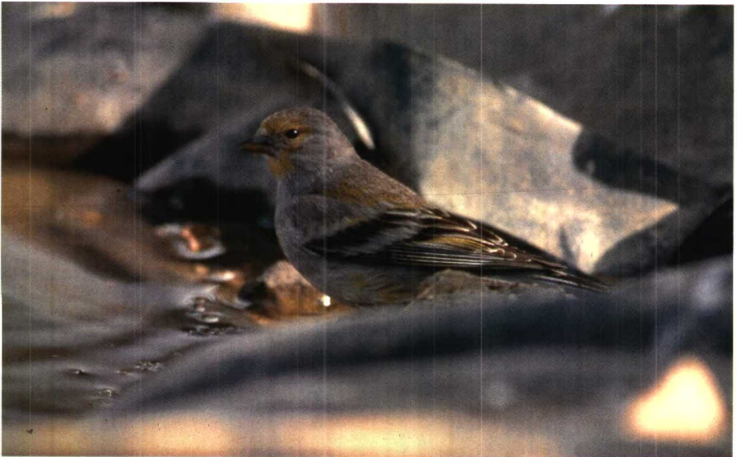
99 Citril Finch / Citroenkanarie Serinus citrinella , Casa Veyas, Mallorca, Spain, May 1995 (Tim Loseby)