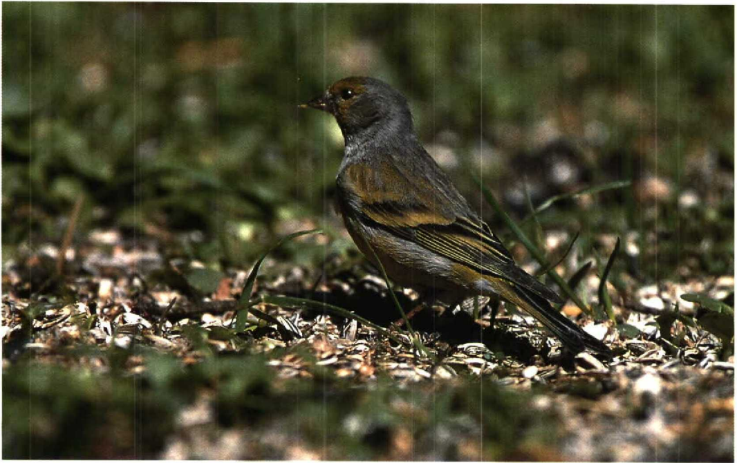
98 Citril Finch / Citroenkanarie Serinus citrinella , adult female, Kirkkonummi, Finland, May 1995