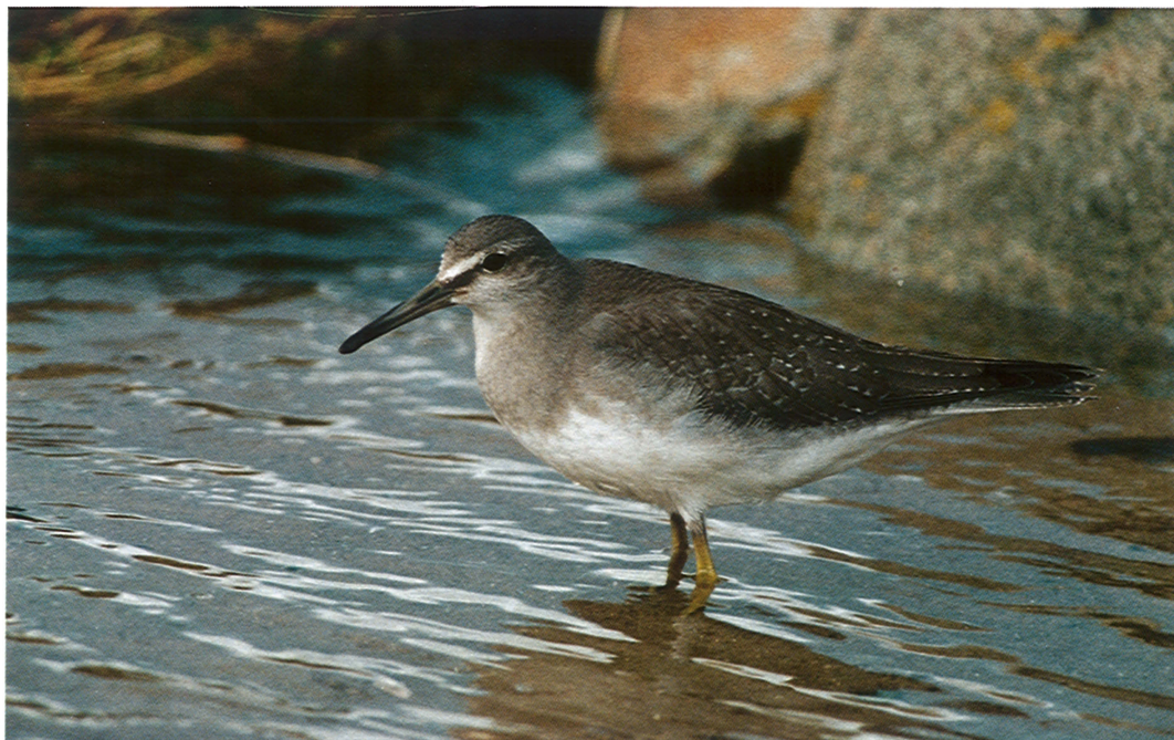
20 Grey-tailed Tattler / Siberische Grijze Ruit Heteroscelus brevipes , Burghead, Grampian, Scotland, December 1994