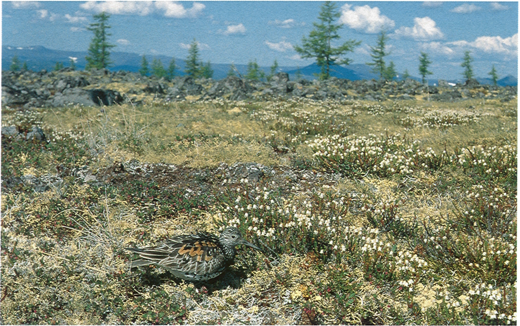
13 Great Knot / Grote Kanoet Calidris tenuirostris , male on second-ever known nest, Koryak Highland, Russia, 14 July 1976