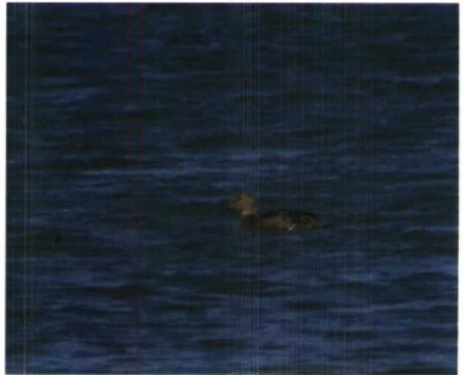
74 Iceland Gull / Kleine Burgemeester Larus glaucooides , adult, Vlissingen, Zeeland, February 1993 (Hans Gebuis) 75 Alpine Swift / Alpengierzwaluw Apus melba , juvenile, Westkapelle, Zeeland, 17 September 1993 (Peter L Meininger) 76 Ring-necked Duck / Ringsnaveleend Aythya collaris , male, Oostvaardersdijk, Flevoland, november 1993 (Arnoud B van den Berg) 77 King Eider / Koningseider Somateria spectabilis , adult female, De Cocksdorp, Texel, Noordholland, April 1993 (Arnoud B van den Berg)

Nieuwstraten, M Zekhuis). NOORDHOLLAND Julianadorp, 28-30 August, juvenile, photographed (D J Moerbeek et al).