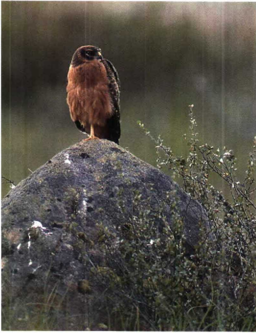
Male Pallid and female Montagu's Harrier raising hybrid young in Finland in 1993