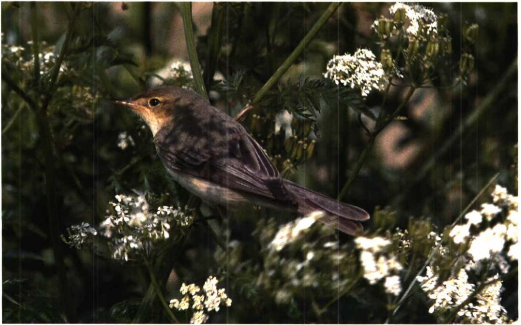
78 Melodious Warbler / Orpheusspotvogel Hippolais polyglotta , Rottumeroog, Groningen, 22 May 1993