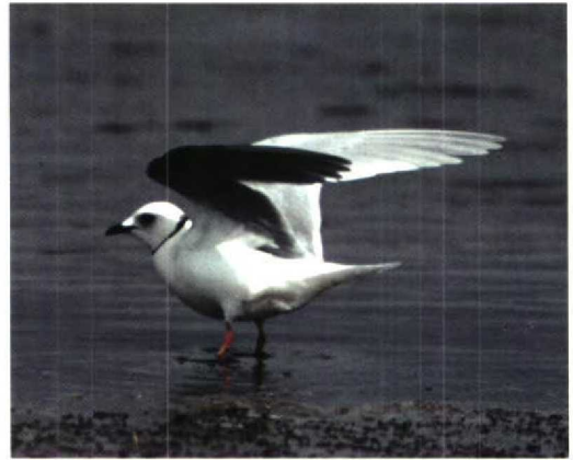
144 Bulwer's Petrel / Bulwers Stormvogel Bulweria bulwerii , Maasvlakte, Zuidholland, Netherlands, 21 August 1995 145 Ross's Gull / Ross' Meeuw Rhodostethia rosea , Greatham Creek, Teesside, Cleveland, England, June 1995 146 Least Sandpiper / Kleinste Strandloper Calidris minutilla , Sidlesham, West Sussex, England, July 1995