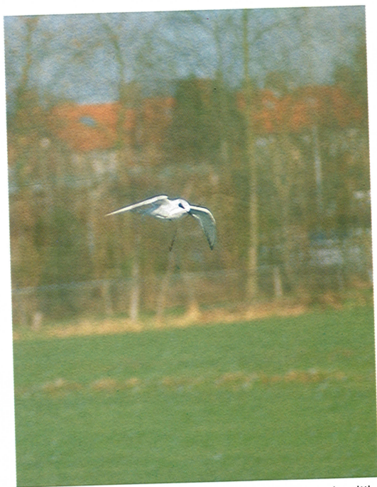
26 Forsters Stern / Forster's Tern Sterna forsteri , Kinderdijk, Zuidholland, 5 januari 1995 (Piet van Meerkerk)