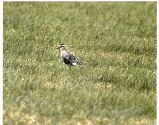
147-148 Dwergarend / Booted Eagle Hieraetus pennatus , donker vorm, Hoge Veluwe, Gelderland, 13 juli 1995 149 Krekeltzanger / River Warbler Locustella fluviatilis , Groningen, Groningen, juli 1995 150 Kuifkoekoek / Great Spotted Cuckoo Clamator glandarius , Schiermonnikoog, Friesland, 28 juli 1995 151 Grote Franjepoot / Wilson's Phalarope Phalaropus tricolor , Wevers Inlaag, Zeeland, 24 juni 1995 152 Steppekievit / Sociable Lapwing Chettusia gregaria , Kamerik, Utrecht, juli 1995