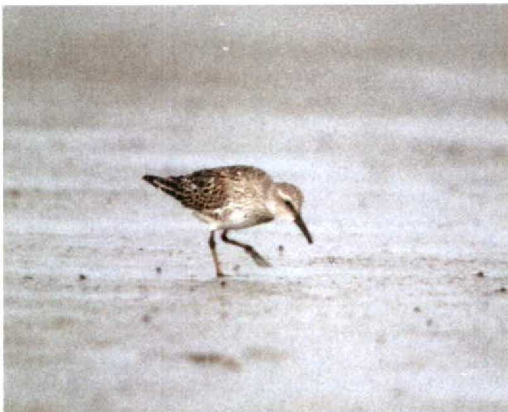
128-129 Bonapartes Strandloper / White-rumped Sandpiper Calidris fuscicollis , adult, Holwerd, Friesland, 19 augustus 1994

De vogel was in rui van zomer- naar winterkleed. De meeste lichaamsveren waren al geruid, gezien het ontbreken van rossige veren op kruin en wangen en de minder duidelijke vlekking op de flanken (Cramp & Simmons 1983, Alström et al 1989). De mantel en bovenste schouderveren werden geruid, gezien de daar aanwezige grijze veren. De vleugeldekveren waren nog niet geruid en enigszins gesleten. Adulte vogels ondergaan een volledige rui na het broedseizoen. Nog op de broedplaatsen wordt een begin gemaakt met de rui van de lichaamsveren. De schouder- en mantelveren worden iets later, tijdens de trek, geruid (Cramp & Simmons 1983). De slagpennen en vleugeldekveren worden doorgaans pas in de winter geruid en zijn bij adulte vogels samen met enkele schouder- en mantelveren het meest