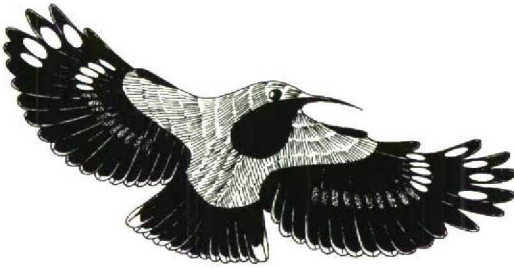
FIGURE 3 Wallcreeper Tichodroma muraria , male in flight from below (Miroslav Saniga). Note two white elliptical spots on p2-5, one white proximal spot on p6 and rusty spots (shaded) on p7-10 and s1-6