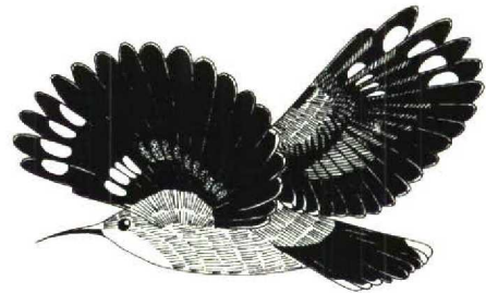
FIGURE 4 Wallcreeper Tichodroma muraria , female in flight from side (Miroslav Saniga). Note two white elliptical spots on p2-5 and rusty spots (shaded) on p7-10 and s1-6

and uppertail were darker in males (brownish-black) than in females (black-brown). The females generally appeared to be paler and duller than the males. The data provide no correlation between the extent of black on throat and breast and the age of the birds. Further studies may prove or disprove any such link.