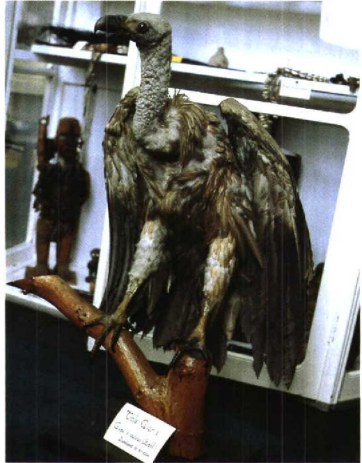
114 Vale Gier / Griffon Vulture Gyps fulvus fulvus , 'A1', juveniel mannetje, Udine, Italië, 2 september 1987 ( Fulvio Genero ) 115 Vale Gier / Griffon Vulture Gyps fulvus (verzameld te Dinteloord, Noordbrabant, 10 juni 1904), Instituut St Louis, Oudenbosch, Noordbrabant, november 1985 ( Edward J van IJendoorn ) 116 Vale Gier / Griffon Vulture Gyps fulvus fulvus , 'A1', zeven jaar oud mannetje, Durgerdam, Noordholland, april 1993 ( Marten van Dijk )