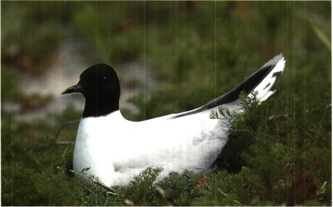
131 Approachable breeding Little Gull / Dwergmeeuw Larus minutus , second-summer, Krammersche Slikken, Volkerakmeer, Zuidholland, 10 June 1993 (Norman D van Swelm) 132 Nest of Little Gull / Dwergmeeuw Larus minutus , Krammersche Slikken, Volkerakmeer, Zuidholland, 10 June 1993 (Norman D van Swelm) 133 Little Gull / Dwergmeeuw Larus minutus , chicks, Hellegatsplaten, Volkerakmeer, Zuidholland, 27 June 1994 (Peter L Meiningen)