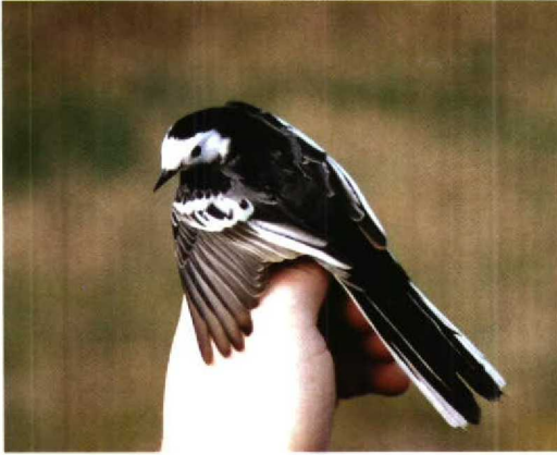
134 Rouwkwikstaart / Pied Wagtail Motacilla alba yarrellii , Bloemendaal, Noordholland, maart 1992

werden de ringers gemotiveerd om zich nog verder te specialiseren in het vangen van kwikstaarten (Cottaar 1990). Dit gaf de volgende jaren interessante en nieuwe inzichten in het voorkomen en de doortrek van de Rouwkwikstaart (Cottaar & Geelhoed 1992).