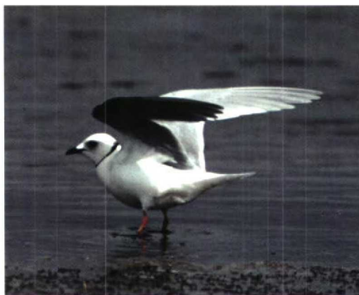
144 Bulwer's Petrel / Bulwers Stormvogel Bulweria bulwerii , Maasvlakte, Zuidholland, Netherlands, 21 August 1995 (Bernd de Bruijn) 145 Ross's Gull / Ross' Meeuw Rhodostethia rosea , Greatham Creek, Teesside, Cleveland, England, June 1995 (Robin Chittenden) 146 Least Sandpiper / Kleinste Strandloper Calidris minutilla , Sidlesham, West Sussex, England, July 1995 (Dave Stewart)