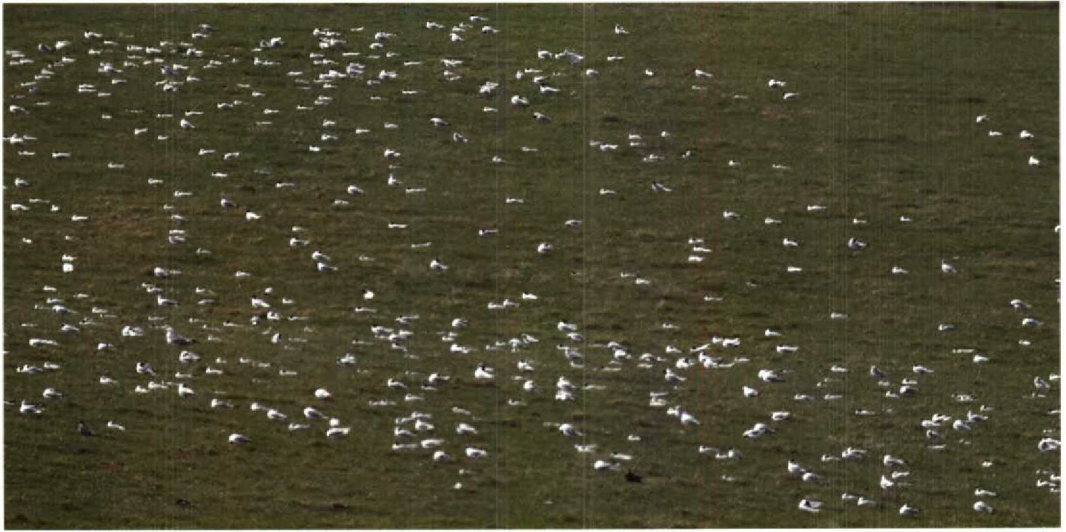
130 Mediterranean Gulls / Zwartkopmeeuwen Larus melanocephalus , part of roosting flock (c one third), Outreau, Pas-de-Calais, France, 15 July 1995 (Arnoud B van den Berg)