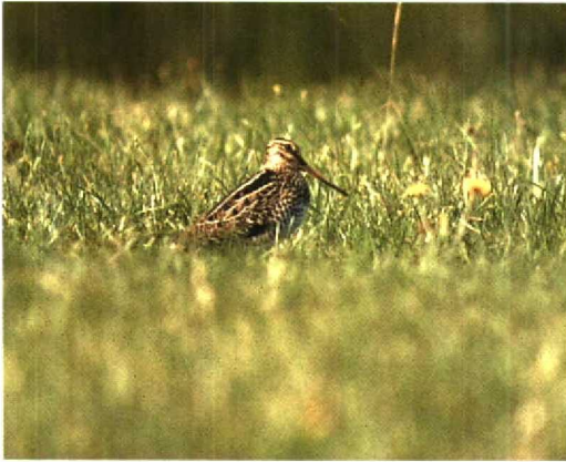
126 Poelsnip / Great Snipe Gallinago media , juveniel, Workumerwaard, Friesland, 6 augustus 1994 (Hans Gebuis)