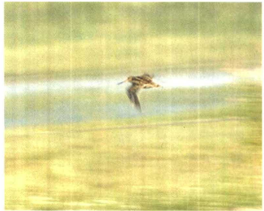
127 Poelsnip / Great Snipe Gallinago media , juveniel, Workumerwaard, Friesland, 31 juli 1994 (Oscar Endtz)

Hayman et al 1986). Het geluid en gedrag ondersteunen de determinatie. Voor verschillen met andere snipsoorten, zoals Stekelstaartsnip G. stenura , Siberische Snip G. megala en 'Amerikaanse Watersnip' G. (g) delicata (die alle drie een geheel gebandeerde ondervleugel hebben en in Westeuropa als dwaalgast kunnen voorkomen), wordt verwezen naar van Spanje et al (1995) en de daarin genoemde verwijzingen. Het feit dat de lichte vleugelstrepen op de bovenzijde relatief smal waren (zowel in zit als in vlucht) en de bandering op de buitenste staartpennen duiden op een juveniele vogel. Adulte Poelsnippen hebben veel bredere witte toppen aan de dekveren en daardoor meer opvallende en wittere vleugelstrepen en ongetekende witte buitenste staartpennen. Eerstejaars vogels krijgen deze vleugeltekening in november-december; in januari ruien de buitenste staartpennen naar volledig witte pennen en vanaf die tijd zijn onvolwassen vogels niet of nauwelijks meer te onderscheiden van adulte. De aanvaarding door de Commissie Dwaalgasten Nederlandse Avifauna (CDNA) van een Poelsnip bij Opheusden, Gelderland, op 12 januari 1980 als tweede-kalenderjaar is derhalve curieus en verdient heroverweging (cf Blankert & CDNA 1982).