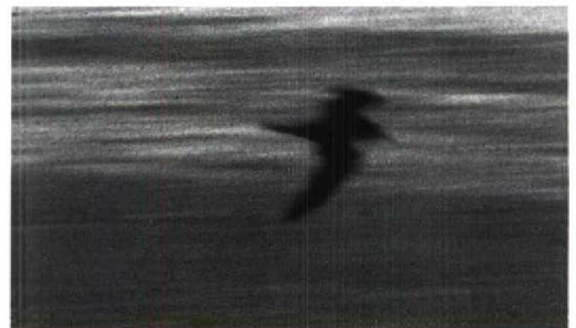
153 Bulwers Stormvogel / Bulwer's Petrel Bulweria bulwerii , Maasvlakte, Zuidholland, 21 augustus 1995

Er zullen heel wat wenkbrauwen gefronst zijn bij het aflezen van de pieperboodschap: Bulwers Stormvogel...?, ter plaatse aanwezig...? Ongeveer 30 personen die alert gereageerd hebben en niet te ver van de Westplaat wonen of werken hebben de vogel nog kunnen zien. Zij moesten wel even wachten, want net toe de eersten arriveerden, was de vogel op zee uit beeld verdwenen. Gelukkig vond Wim Wiegant hem na een half uur terug, zij het ver weg op zee. Hier vloog de vogel enkele malen heen en weer om vervolgens om c 11:15 naar later bleek definitief uit beeld te verdwijnen, tot grote spijt van hen die te laat waren of zich niet aan hun doordeweekse verplichtingen konden onttrekken. De goudplevier hebben we verder maar laten zitten... AAT SCHAFTENAAR