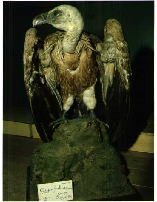
117 Vale Gier / Griffon Vulture Gyps fulvus , Wommels, Friesland, 31 juli 1975 (mevr Faber) 118 Vale Gier / Griffon Vulture Gyps fulvus fulvus (verzameld te Twijzel, Friesland, juni 1930), Nationaal Natuurhistorisch Museum, Leiden, Zuidholland, april 1983 (Arnoud B van den Berg) 119 Vale Gier / Griffon Vulture Gyps fulvus (verzameld te Schijndel, Noordbrabant, 4 oktober 1944), Milieu Educatie Centrum, Eindhoven, Noordbrabant, 11 augustus 1995 (Enno B Ebels)