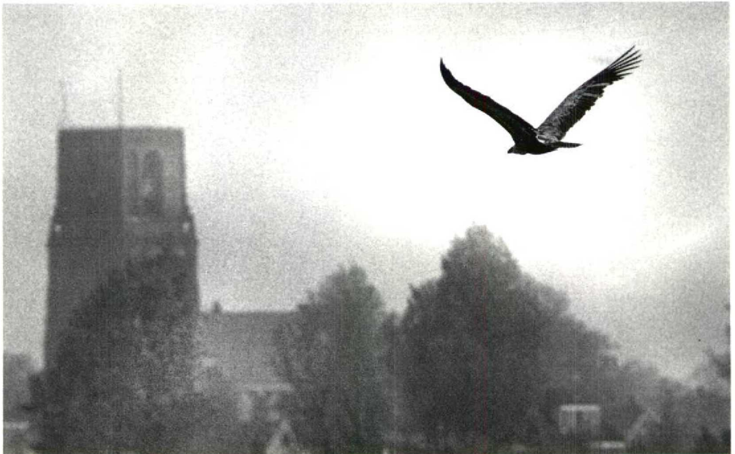
113 Vale Gier / Griffon Vulture Gyps fulvus fulvus , 'A1', zeven jaar oud mannetje, Durgerdam, Noordholland, 29 april 1993 (Martijn de Jonge)

In de zomermaanden trekken vooral jonge vogels van deze kolonies c 250 km in noordwestelijke richting naar de Oostenrijkse Alpen, waar in die periode kuddes schapen naar de hogere bergweiden worden gevoerd. Een vrij kleine populatie Vale Gieren bestrijkt hier de noord- en zuidoorden van de 3000 m hoge bergkam de Hohe Tauern, c 100 km ten zuiden van Salzburg. Een traditionele roestplaats bevindt zich in het Rauristal, waar sinds 1979 een voederplaats voor gieren is ingericht, omdat het aantal overzomerende vogels vanwege de afnemende schapenbe-