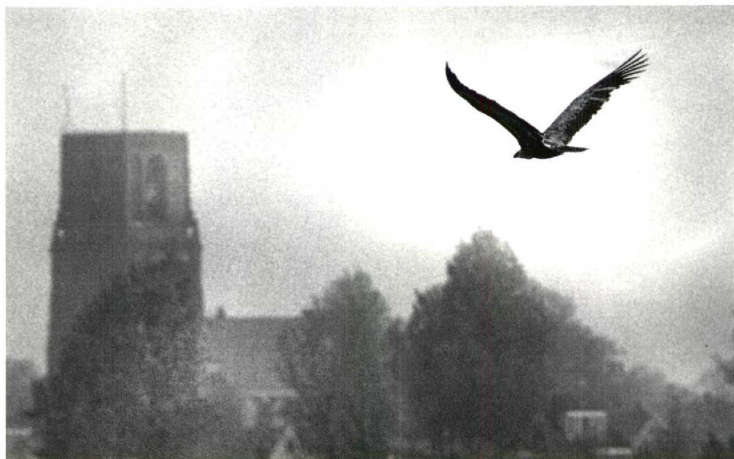
113 Vale Gier / Griffon Vulture Gyps fulvus fulvus , 'A1', zeven jaar oud mannetje, Durgerdam, Noordholland, 29 april 1993 (Martijn de Jonge)

In de zomermaanden trekken vooral jonge vogels van deze kolonies c 250 km in noordwestelijke richting naar de Oostenrijkse Alpen, waar in die periode kuddes schapen naar de hogere bergweiden worden gevoerd. Een vrij kleine populatie Vale Gieren bestrijkt hier de noord- en zuidoorden van de 3000 m hoge bergkam de Hohe Tauern, c 100 km ten zuiden van Salzburg. Een traditionele roestplaats bevindt zich in het Rauristal, waar sinds 1979 een voederplaats voor gieren is ingericht, omdat het aantal overzomerende vogels vanwege de afnemende schapenbe-