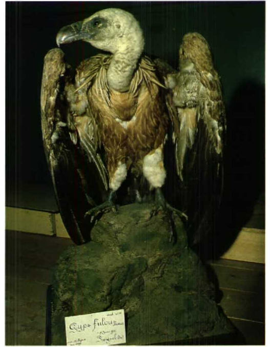
117 Vale Gier / Griffon Vulture Gyps fulvus , Wommels, Friesland, 31 juli 1975 (mevr Faber) 118 Vale Gier / Griffon Vulture Gyps fulvus fulvus (verzameld te Twijzel, Friesland, juni 1930), Nationaal Natuurhistorisch Museum, Leiden, Zuidholland, april 1983 (Arnoud B van den Berg) 119 Vale Gier / Griffon Vulture Gyps fulvus (verzameld te Schijndel, Noordbrabant, 4 oktober 1944), Milieu Educatie Centrum, Eindhoven, Noordbrabant, 11 augustus 1995 (Enno B Ebels)