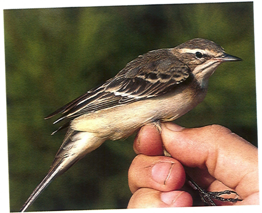
1 Yellow Wagtail Motacilla flava , first-winter female with uniformly coloured upperparts, Ebro Delta, Spain, 5 September 1991 ( Gabriel Gargallo ). Note conspicuous whitish tips to unmoulted greater coverts 2 Yellow Wagtail Motacilla flava , first-winter female possibly belonging to subspecies M f flavissima , Ebro Delta, Spain, 12 September 1992 ( Raül Aymí ). Note distinct supercilium and extremely pale ear-coverts and lores, upperparts with sandy tones and underparts with creamy suffusion 3 Yellow Wagtail Motacilla flava , first-winter female with no trace of supercilium, Ebro Delta, Spain, 18 September 1992 ( Raül Aymí ). Note bicoloured upperparts with brownish crown, nape, scapulars and back and grey rump and uppertail-coverts 4 Yellow Wagtail Motacilla flava , first-winter female resembling subspecies M f flava , Ebro Delta, Spain, 5 September 1991 ( Gabriel Gargallo ). Note distinct supercilium and relatively pale ear-coverts

lower mandible was usually paler grey or sometimes pinkish near the base, although in some individuals it was almost uniformly black.