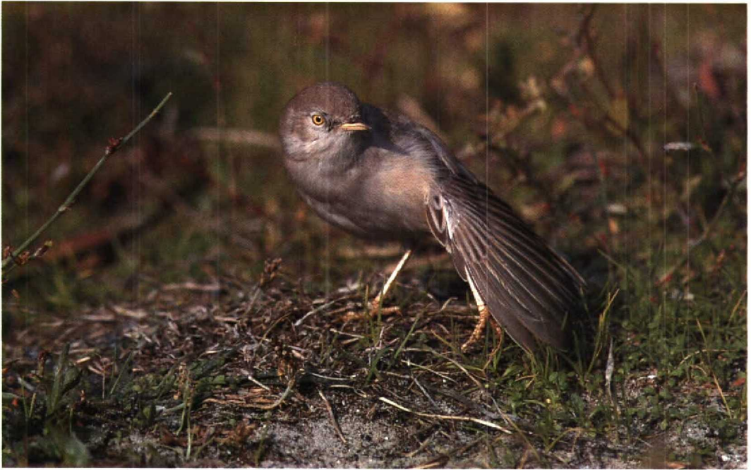
224 Woestijngrasmus / Desert Warbler Sylvia nana , Scheveningen, Zuidholland, oktober 1994 (Henk H Harmsen)