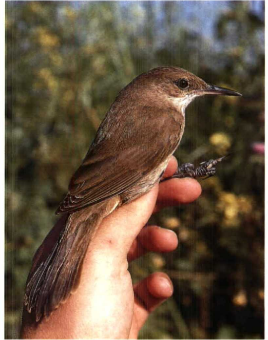
220 Clamorous Reed Warbler / Indische Karekiet Acrocephalus stentoreus levantina , adult, Sea of Galilee, Israel, late-May 1986 ( Hadoram Shirihi ) 221 Clamorous Reed Warbler / Indische Karekiet Acrocephalus stentoreus levantina , fresh (moderately dark) plumage, Bet Shean valley, Israel, March 1992 ( Hadoram Shirihi ) 222 Thick-billed Warbler / Diksnavelrietzanger Acrocephalus aedon , Mai Po Marshes NR, Hong Kong, 12 October 1991 ( Peter R Kennerley )