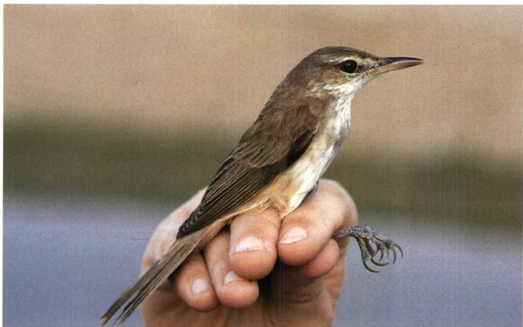
210 Oriental Great Reed Warbler / Chinese Karekiet Acrocephalus orientalis , Tuas, Singapore, 10 February 1994 (Peter R Kennerley)