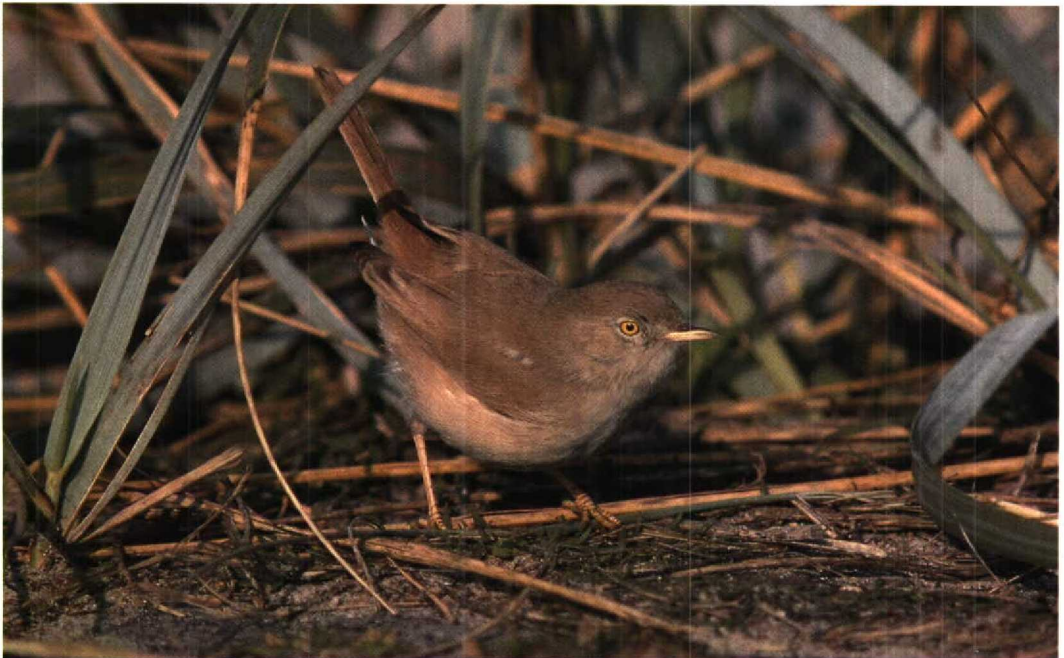
225 Woestijngrasmus / Desert Warbler Sylvia nana , Scheveningen, Zuidholland, 9 oktober 1994 (Leo J R Boon)