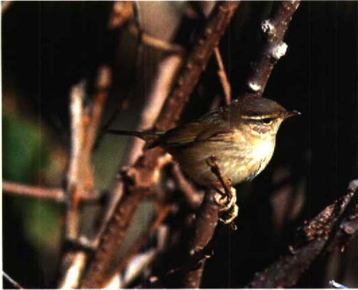
253 Raddes Boszanger / Radde's Warbler Phylloscopus schwarzi , Heist, Westvlaanderen, 5 november 1995 (Patrick Beirens)