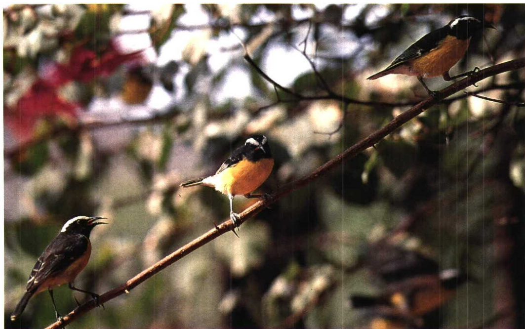
229 Bananaquits / Suikerdiefjes Coereba flaveola uropygialis , Curaçao, Netherlands Antilles, 15 May 1993 (Karel Beylevelt) 230 Yellow Oriole / Gele Troepiaal Icterus nigrogularis curasoensis , Curaçao, Netherlands Antilles, 16 May 1993 (Karel Beylevelt) 231 Burrowing Owl / Holenuil Athene cucularia arubensis , male, Aruba, 9 April 1992 (Karel Beylevelt)