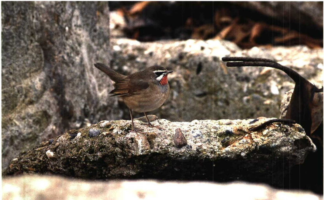
239 Siberian Rubythroat / Roodkeelnachtegaal Luscinia calliope , Helgoland, Schleswig-Holstein, Germany, November 1995 (Axel Halley)