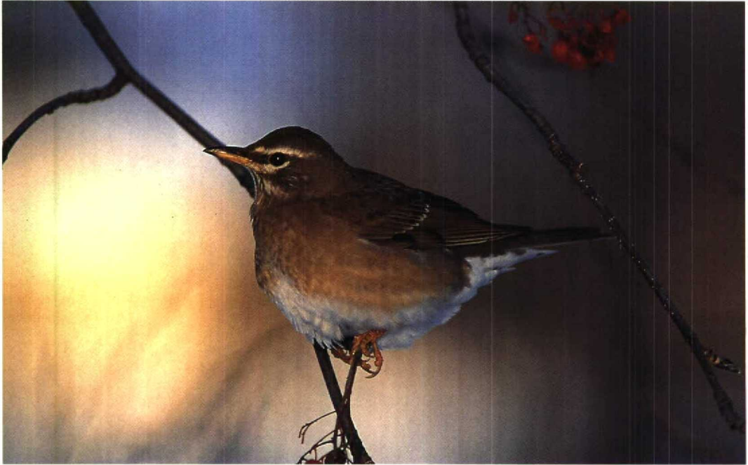
238 Eyebrowed Thrush / Vale Lijster Turdus obscurus , Oulu, Finland, 3 November 1995