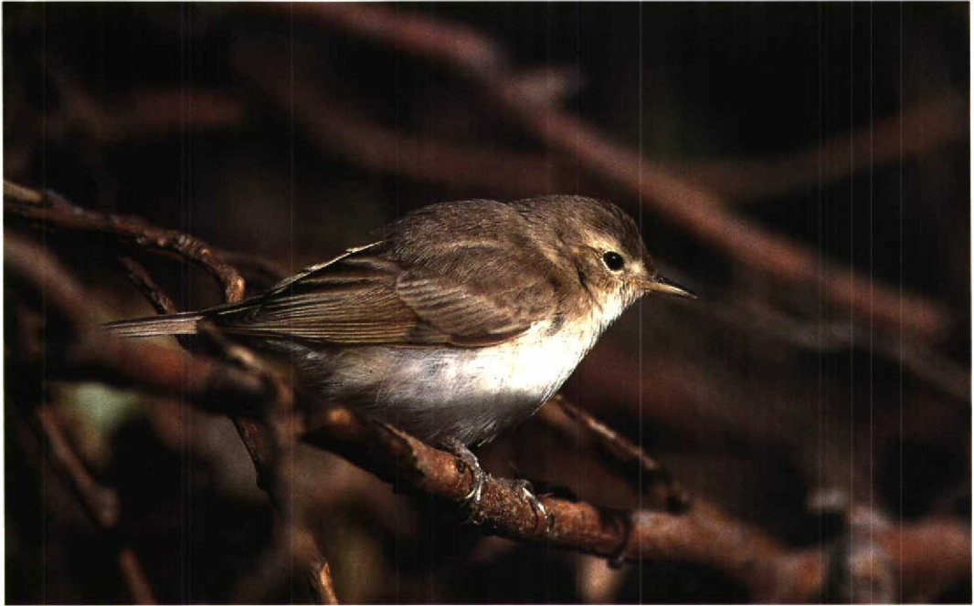
246 Kleine Spotvogel / Booted Warbler Hippolais caligata , Maasvlakte, Zuidholland, 6 oktober 1995