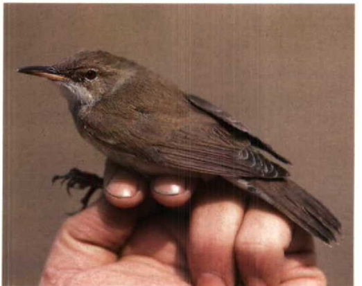
214 Great Reed Warbler / Grote Karekiet Acrocephalus arundinaceus zarudnyi , Eilat, Israel, May 1987 ( Hadoram Shirihai ) 215 Clamorous Reed Warbler / Indische Karekiet Acrocephalus stentoreus levantina , Sea of Galilee, Israel, May 1986 ( Hadoram Shirihai ) 216 Oriental Great Reed Warbler / Chinese Karekiet Acrocephalus orientalis , Mai Po Marshes NR, Hong Kong, 22 December 1990 ( Peter R Kennerley ) 217 Thick-billed Warbler / Diksnavelrietzanger Acrocephalus acdon , Västra Norskar, Finland, 11 October 1994 ( Hannu Kettunen ) 218 Great Reed Warbler / Grote Karekiet Acrocephalus arundinaceus zarudnyi , fresh first-winter, Eilat, Israel, August 1986 ( Hadoram Shirihai ) 219 Basra Reed Warbler / Basrakarekiet Acrocephalus griseldis , Jubail, Saudi Arabia, 1 May 1991 ( Arnoud B van den Berg )