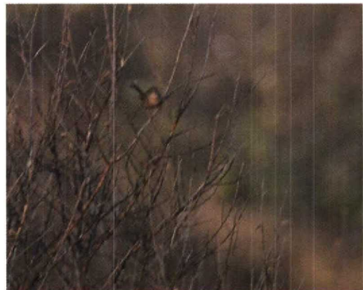
255 Provençaalse Grasmus / Dartford Warbler Sylvia undata , Westkapelle, Zeeland, 1 december 1995 (Erik Sanders)

Provençaalse Grasmus te Westkapelle Op zondag 26 november 1995 ontdekte ik om 12:15 een Provençaalse Grasmus Sylvia undata op het opslagterrein van het Waterschap Zeeuwse Eilanden te Westkapelle, Zeeland. De vogel bevond zich in een bladloze vlierstruik maar wist zich daarin vrijwel onzichtbaar te maken. Aanvankelijk werd alleen het rode oog (als Waterral Rallus aquaticus ) met de helderrode oogring gezien. Pas na enkele 10-tallen spannende seconden liet de vogel zich iets beter bekijken en bleek dat het geen exoot was maar een van de twee extreem langstaartige grasmussen die de WP rijk is. Het meest opvallend waren de donkere grijszwarte bovendelen, de roodbruine onderdelen en de lange staart die steeds in een hoek van tenminste 60° ten opzichte van de rug werd gehouden. Hoewel de determinatie nog niet geheel rond was, was het natuurlijk een 'goede soort' en werd de kermis in gang gezet. Gido Davidse, Peter Meininger, Rob Sponselee en Mark Zekhuis konden binnen 20 min na de ontdekking de determinatie als Provençaalse Grasmus bevestigen. De vogel riep nu ook frequent een zacht tsjurr , soms gevolgd door een nog zachter tuk . Rond 13:20