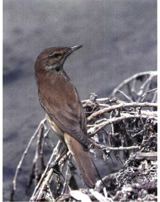
211 Great Reed Warbler / Grote Karekiet Acrocephalus arundinaceus arundinaceus , fresh plumage in spring, Eilat, Israel, May 1989 ( Hadoram Shirihai ) 212 Great Reed Warbler / Grote Karekiet Acrocephalus arundinaceus , Jubail, Saudi Arabia, 16 May 1991 ( Arnoud B van den Berg ) 213 Basra Reed Warbler / Basrakarekiet Acrocephalus griseldis , fresh plumage in spring, Eilat, Israel, May 1993 ( Hadoram Shirihai )