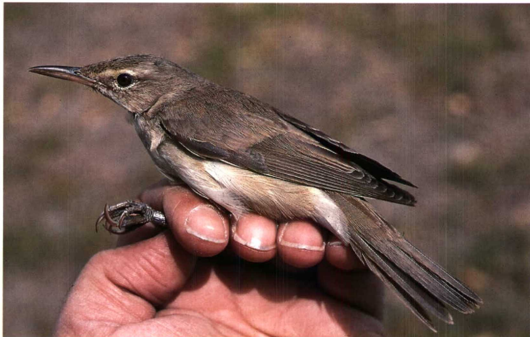
209 Basra Reed Warbler / Basrakarekiet Acrocephalus griseldis , Jubail, Saudi Arabia, 15 April 1991 (Arnoud B van den Berg)