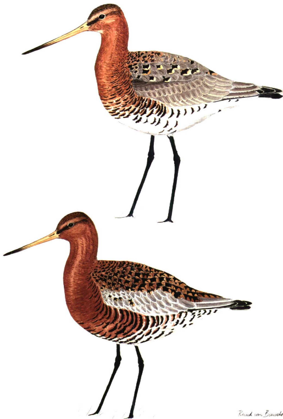
FIGUUR 1 IJslandse Grutto / Icelandic Black-tailed Godwit Limosa limosa islandica , mannetje in adult zomerkleed (onder), en Grutto / Black-tailed Godwit L. limosa , mannetje in adult zomerkleed (boven) (Ruud F J van Beusekom)