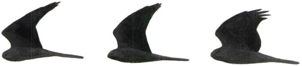
FIGURE 1 General differences in shape between, from left to right, Montagu's Circus pygargus , Pallid C macrourus and Hen Harriers C cyaneus (Dick Forsman). Note long, narrow and pointed hand and small body and long tail of Montagu's compared with more triangular-handed and heavier-bodied Pallid. Hen has broadest wings with rounded tip and bulging trailing edge to arm and rather heavy body. See text for details