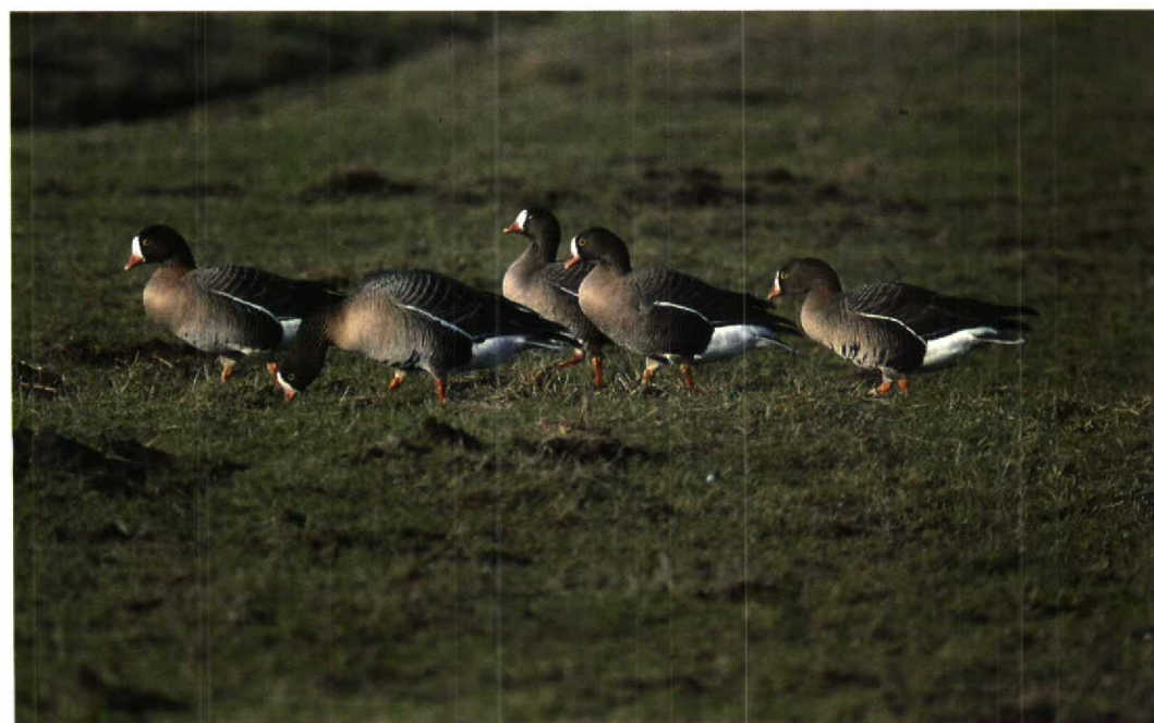
58 Lesser White-fronted Geese / Dwergganzen Anser erythropus , family of 'Limping Lotta', Strijen, Zuidholland, February 1995 (Marten van Dijl)