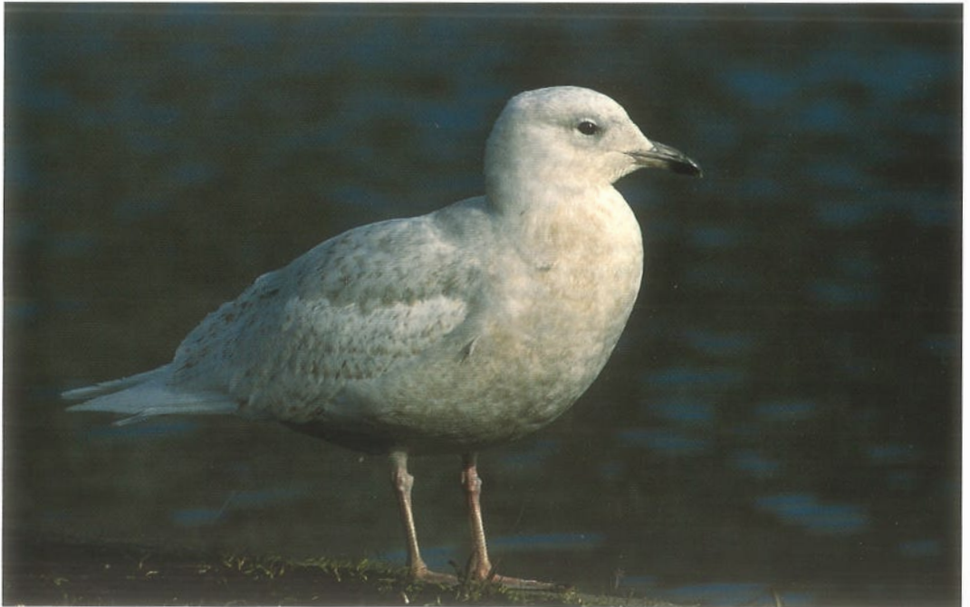
68 Kleine Burgemeester / Iceland Gull Larus glaucooides , eerste-winter, Groningen, Groningen, 9 maart 1995