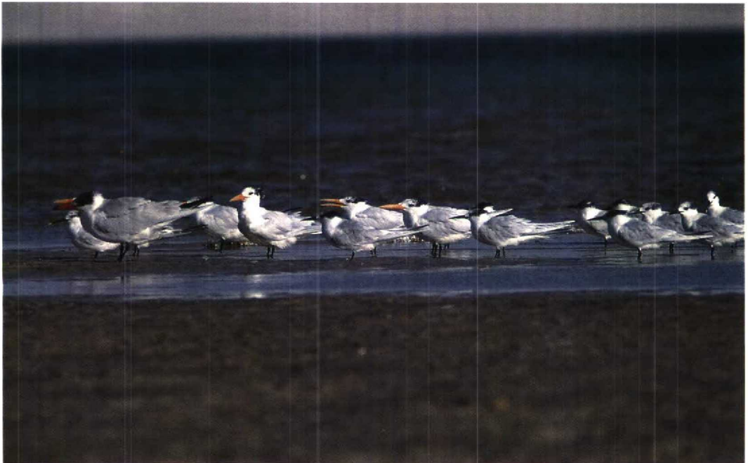
61 Royal Terns / Koningssterns Sterna maxima with Caspian Tern S. caspia and Sandwich Terns S. sandvicensis , Ad Dakhla, Western Sahara, February 1995 (Theo Bakker)