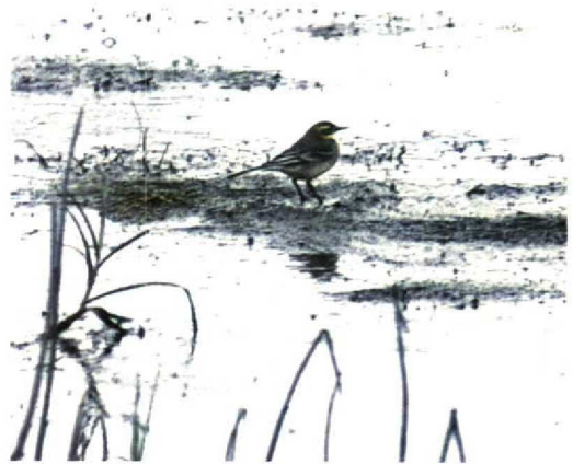
56 Citroenkwikstaart / Citrine Wagtail Motacilla citreola , Eemshaven, Groningen, 5 september 1994 (Eric Koops)

Dit is het vierde geval voor Nederland. Voor een overzicht van de overige Nederlandse geval-