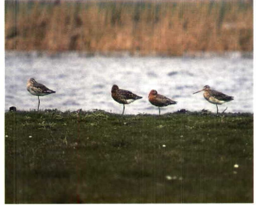
53 IJslandse Grutto's / Icelandic Black-tailed Godwits Limosa limosa islandica (midden) en Grutto's / Black-tailed Godwits L. limosa (links en rechts), Zuiderwoude, Noordholland, 16 april 1989 (waarneming 11) (Oscar Endtz). Vergelijk grootte, bouw en ruistadium