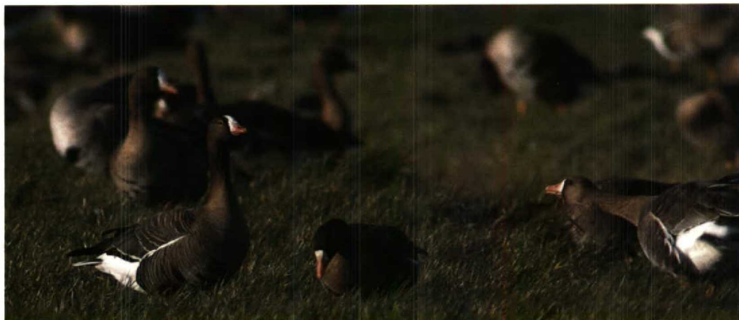
59 Lesser White-fronted Goose / Dwerggans Anser erythropus and White-fronted Geese / Kolganzen A albifrons , Goedereede, Zuidholland, 12 February 1995 (Arnoud B van den Berg)

Zuidholland might soon become the most reliable and most convenient places to see this species in Europe. The Hortobágy, Hungary, is the only other European birding area where regularly winter flocks are reported such as, for example, 350 in November 1992 (Dutch Birding 15: 33, 1993) and 140 in early November 1993 (Dutch Birding 16: 33, 1994).