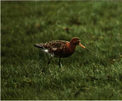
52 IJslandse Grutto / Icelandic Black-tailed Godwit Limosa limosa islandica , adult zomerkleed, Birdaard, Friesland, 1e week april 1988 (waarneming 7) (Piet Munsterman). Grijs vleugelpaneel gedeeltelijk bedekt door flankveren