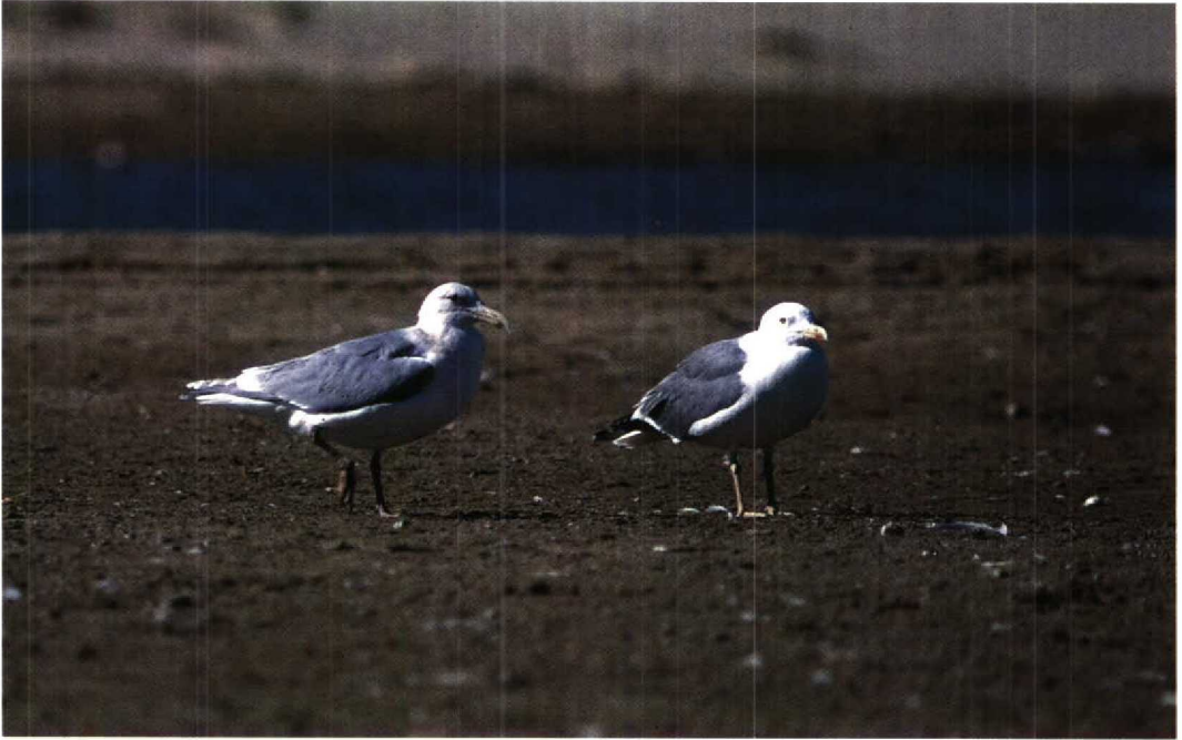
60 Glaucous-winged Gull / Beringmeeuw Larus glaucescens , adult, with Yellow-legged Gull / Geelpootmeeuw L. cachinnans , Essaouira, Morocco, 31 January 1995 (Theo Bakker)