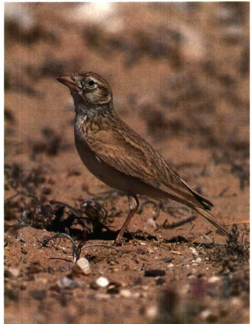
63 Dunn's Lark / Dunn's Leeuwerik Eremalauda dunnii , Eilat, Israel, March 1995

seen from across the Israeli border. In Ireland, a Killdeer Plover Charadrius vociferus stayed at Tacumshin, Wexford, on 1-9 April. Later in the month, one was reported in Scotland. In early March, nine Greater Sand Plovers C. leschenaultii were noted within a week near Paphos lighthouse, Cyprus. A male Caspian Plover C. asiaticus was seen at Yotvata, Israel, on 20 March. Sociable Plovers Chettusia gregaria were reported at Kefar Ruppim, Israel, in mid-March and at Ulm, Baden-Württemberg, Germany, in late March. In Israel and Jordan, two White-tailed Lapwings C. leucura were alternately staying at the Eilat Sewage Canals or the salt-pans at Aqaba from 22 March into April. The first Greater Yellowlegs Tringa melanoleuca for the Netherlands seen during 30 min on 15 January at Grijpskerke, Zeeland (Dutch Birding 17: 30, 34, 40, plate 32, 1995), was rediscovered on 20 April at De Braakman, Zeeland, where it stayed until at least 30 April. Presumably, the same individual had been photographed between Dudzele and Zeebrugge, Westvlaanderen, Belgium, during 27 November to 2 December 1994 and presumably also at Rockliffe, Cumbria, England, during 15 October to 13 November 1994 (cf Dutch Birding 16: 250, 1994; 17: 27, 30, 34, 88, plates 21 & 33, 1995). On 18 January, 54 Great Knots Calidris tenuirostris were counted during a census on Merawah Island, United Arab Emirates, and up to 25 were seen