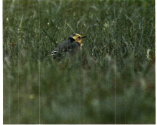
55 Citroenkwikstaart / Citrine Wagtail Motacilla citreola , Wilp, Gelderland, 5 mei 1993

De combinatie van geheel gele kop, gele borst, grijze bovendelen met zwarte stuit en bovenstaartdekveren, twee opvallende witte vleugelstrepen en witte onderstaartdekveren maakte de determinatie als Citroenkwikstaart eenvoudig omdat geen andere kwikstaart deze combinatie van kenmerken vertoont (cf Barthel & Schmidt 1990, Harris et al 1991, Lewington et al 1991, Jonsson 1994). Hybriden van Citroenkwikstaart met Gele Kwikstaart vertonen (naar mag worden aangenomen) kenmerken van beide ouders en derhalve bijvoorbeeld meer donkere tekening op de kop, enig olijfgroen op de bovendelen, minder brede witte vleugelstrepen en/of geen zuiver witte onderstaartdekveren (cf Lehto 1990, Shirahai 1990). Het ontbreken – afgezien van de vage teugelstreep – van donkere tekening op de gele zijkop duidt op een mannetje. De aanwezigheid van een klein grijs 'petje' duidt waarschijnlijk op een eerste-zomer vogel. Adulte mannetjes hebben een volledig ongetekende (boven)kop.