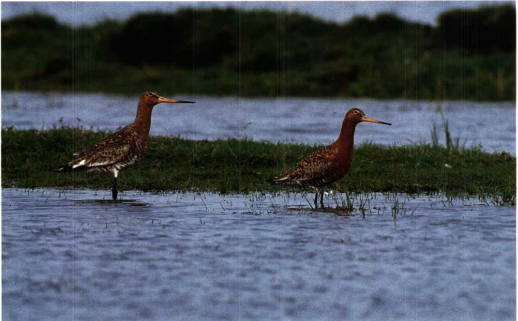
54 IJslandse Grutto's / Icelandic Black-tailed Godwits Limosa limosa islandica , adult zomerkleed, Wormer- en Jisperveld, Noordholland, 1e week mei 1993. Korte snavel en tibia. Grijs vleugelpaneel goed zichtbaar. Linker exemplaar waarschijnlijk vrouwtje (groter en minder warm-roodbruin) en rechter waarschijnlijk mannetje