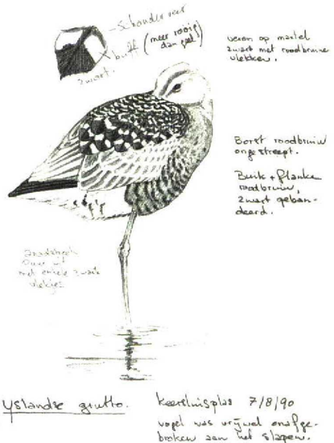
FIGUUR 2 IJslandse Grutto / Icelandic Black-tailed Godwit Limosa limosa islandica , adult zomerkleed, Keersluisplas, Oostvaardersplassen, Flevoland, 7 augustus 1990 (waarneming 24) (Karel A Mauer). Tekening op tertials niet aangebracht