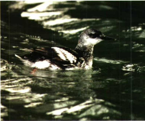
71 Zwarte Zeekoet / Black Guillemot Cephus grylle , West-Terschelling, Terschelling, Friesland, januari 1995 (Arie Ouwerkerk)