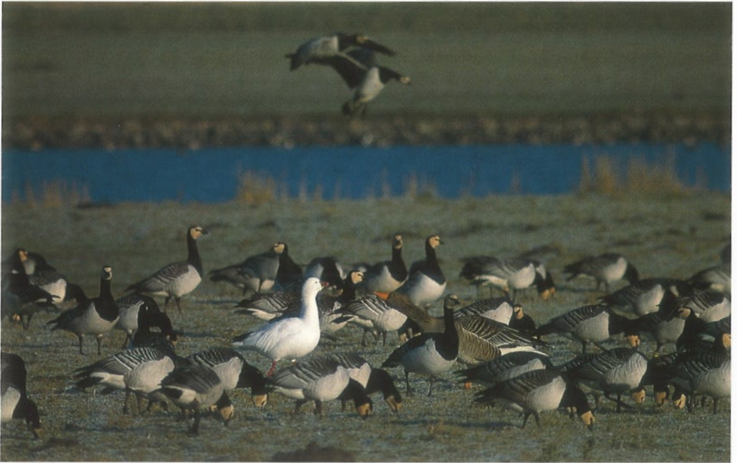
67 Ross' Gans / Ross's Goose Anser rossii , Plaat van Scheelhoek, Stellendam, Zuidholland, januari 1995