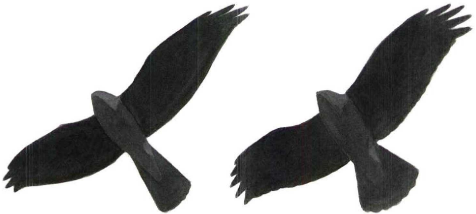
FIGURE 2 Silhouettes of soaring Montagu's Circus pygargus / Pallid C macrourus (left) and Hen Harrier C cyaneus (Dick Forsman). Note differences in width of wing and structure of hand/wing-tip. In Hen, whole wing appearing equally broad with rounded tip, whereas wing in Montagu's/Pallid widest at carpal with hand tapering clearly towards tip

riers, possible confusion with Hen Harrier C cyaneus cannot be overlooked. The risk of misidentification is particularly great wherever or whenever Hen Harriers occur in places where Pallid and Montagu's Harriers are more likely, eg, in northern Africa and the Middle East. Experienced birders should, as a rule, have no problems identifying the heavier Hen, with its broad and round-tipped wings. However, Hen can sometimes be truly difficult to separate from Pallid, a problem largely overlooked in the literature. The most difficult Hens are moulting adult females in late summer/early autumn, showing a pointed wing-tip. Also small and narrow-winged juvenile males, with breast streaking confined to upper breast only, can appear confusingly similar to ringtail Pallids.