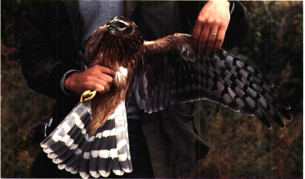
34 Hen Harrier Circus cyaneus , juvenile female, Finland, September 1982. Compare with adult female Pallid Harrier in plate 38 and note especially differences in primary barring and wing formula. Pattern of darkish secondaries can be rather similar, but head appearing generally more streaked in Hen 35 Montagu's Harrier Circus pygargus , typical adult female, Kazakhstan, 18 September 1993. Note evenly barred primaries, typical pattern of secondaries and coarsely rufous-patterned underwing-coverts and axillaries. Note also typical head pattern and rufous bars on outer rectrices