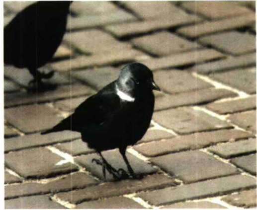
72 Russische Kauw / Russian Jackdaw Corvus monedula soemmerringii , Leiden, Zuidholland, januari 1995

Remiz pendulinus van het seizoen werden opgemerkt op 26 februari langs de Knardijk, Flevoland, op 23 maart (twee) bij het Veerse Meer en op 30 maart in de Brabantse Biesbosch, Noordbrabant. Op 11 januari werd een Notekraker Nucifraga caryocatactes gezien bij het Engelermeer, Noordbrabant. Een Russische Kauw Corvus monedula soemmerringii verbleef een groot deel van de winter in Leiden, Zuidholland. Op 5 februari werden er enkele 10-tallen gezien in de omgeving van Wijster, Drenthe. Beide Huis kraaien C splendens van Hoek van Holland, Zuidholland, blijken de winter te hebben doorstaan, waarschijnlijk op een dieet van patat. Behoorlijk buiten zijn verspreidings-