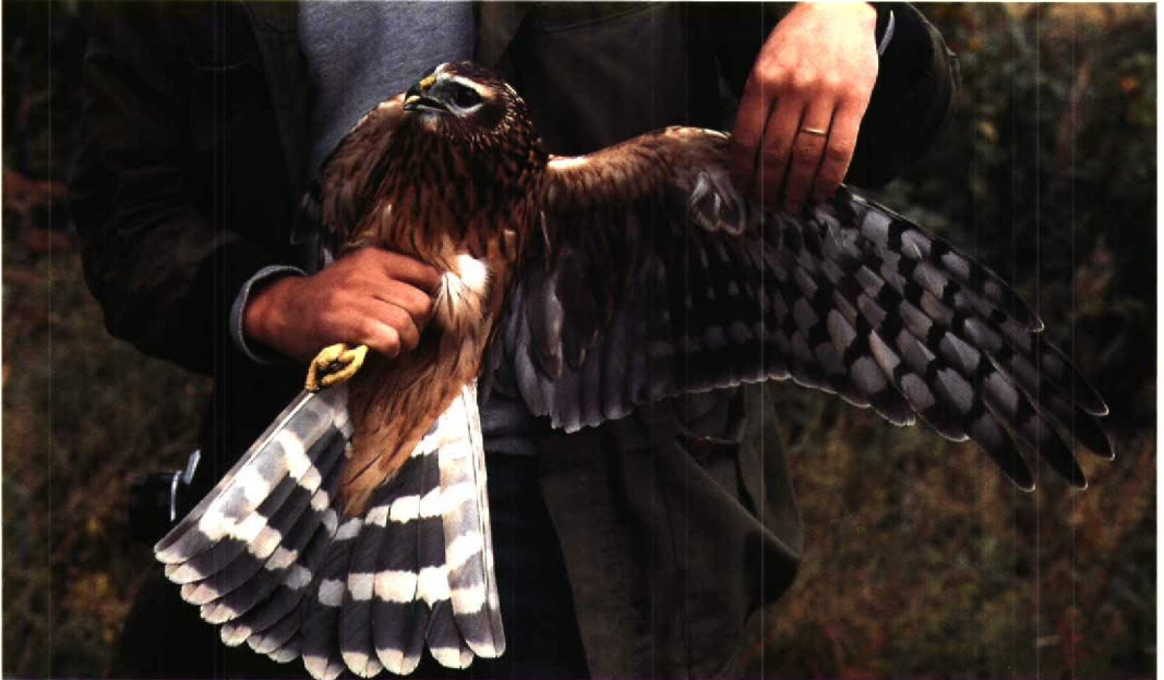
34 Hen Harrier Circus cyaneus , juvenile female, Finland, September 1982. Compare with adult female Pallid Harrier in plate 38 and note especially differences in primary barring and wing formula. Pattern of darkish secondaries can be rather similar, but head appearing generally more streaked in Hen 35 Montagu's Harrier Circus pygargus , typical adult female, Kazakhstan, 18 September 1993. Note evenly barred primaries, typical pattern of secondaries and coarsely rufous-patterned underwing-coverts and axillaries. Note also typical head pattern and rufous bars on outer rectrices