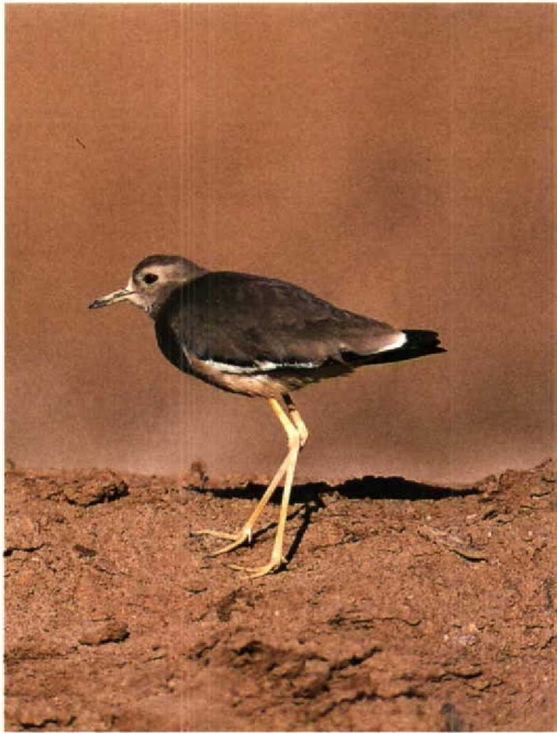
62 White-tailed Lapwing / Witstaartkievit Chettusia leucura , Eilat, Israel, March 1995