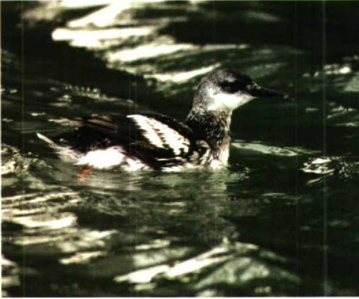
71 Zwarte Zeekoet / Black Guillemot Cephus grylle , West-Terschelling, Terschelling, Friesland, januari 1995