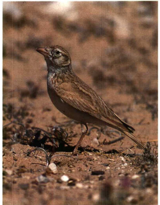
63 Dunn's Lark / Dunns Leeuwerik Eremalauda dunni , Eilat, Israel, March 1995 (Felix Heintzenberg)

seen from across the Israeli border. In Ireland, a Killdeer Plover Charadrius vociferus stayed at Tacumshin, Wexford, on 1-9 April. Later in the month, one was reported in Scotland. In early March, nine Greater Sand Plovers C. leschenaultii were noted within a week near Paphos lighthouse, Cyprus. A male Caspian Plover C. asiaticus was seen at Yotvata, Israel, on 20 March. Sociable Plovers Chettusia gregaria were reported at Kefar Ruppin, Israel, in mid-March and at Ulm, Baden-Württemberg, Germany, in late March. In Israel and Jordan, two White-tailed Lapwings C. leucura were alternately staying at the Eilat Sewage Canals or the salt-pans at Aqaba from 22 March into April. The first Greater Yellowlegs Tringa melanoleuca for the Netherlands seen during 30 min on 15 January at Grijpskerke, Zeeland (Dutch Birding 17: 30, 34, 40, plate 32, 1995), was rediscovered on 20 April at De Braakman, Zeeland, where it stayed until at least 30 April. Presumably, the same individual had been photographed between Dudzele and Zeebrugge, Westvlaanderen, Belgium, during 27 November to 2 December 1994 and presumably also at Rockliffe, Cumbria, England, during 15 October to 13 November 1994 (cf Dutch Birding 16: 250, 1994; 17: 27, 30, 34, 88, plates 21 & 33, 1995). On 18 January, 54 Great Knots Calidris tenuirostris were counted during a census on Merawah Island, United Arab Emirates, and up to 25 were seen