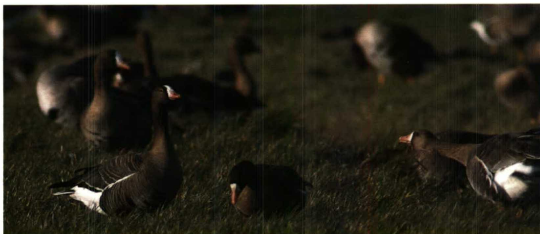
59 Lesser White-fronted Goose / Dwerggans Anser erythropus and White-fronted Geese / Kolganzen A albifrons , Goedereede, Zuidholland, 12 February 1995 (Arnoud B van den Berg)

Zuidholland might soon become the most reliable and most convenient places to see this species in Europe. The Hortobágy, Hungary, is the only other European birding area where regularly winter flocks are reported such as, for example, 350 in November 1992 (Dutch Birding 15: 33, 1993) and 140 in early November 1993 (Dutch Birding 16: 33, 1994).