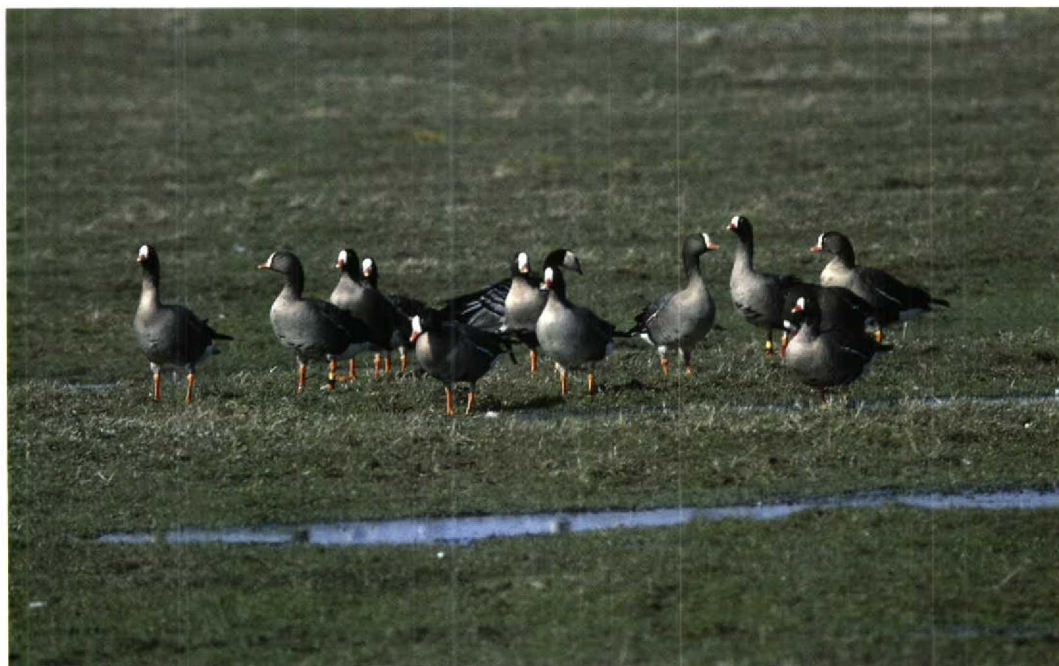
57 Lesser White-fronted Geese / Dwergganzen Anser erythropus , two families, Anjum, Friesland, 10 March 1995