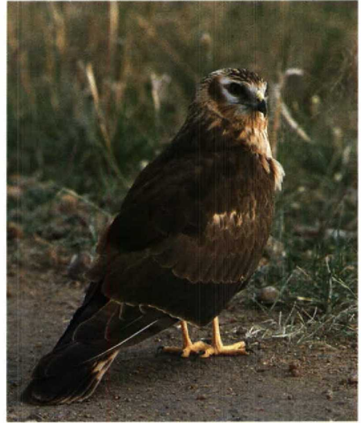
36 Montagu's Harrier Circus pygargus , adult female, Sweden, 10 August 1991. Note typical, rather pale head, with large amount of white around eye and restricted dark ear-coverts spot 37 Montagu's Harrier Circus pygargus , juvenile, Kenya, 18 February 1987. Note rather pale head with extensive white around eye, restricted dark ear-coverts patch and streaked sides of neck 38 Pallid Harrier Circus macrourus , adult female, Kazakhstan, 18 September 1993. Note typically barred primaries and darkish secondaries. Compare also head and underwing pattern and streaking on underparts with female Montagu's in plate 35 and juvenile female Hen Harrier in plate 34