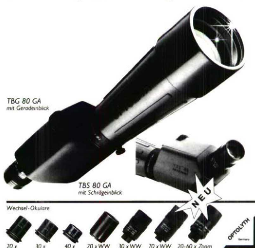
TBG 80 GA mit Geradenblick