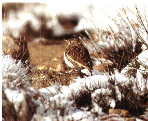
9 Dupont's Lark / Duponts Leeuwerik Chersophilus duponti , Tizi-n-Taghatine, Ouarzazate, Morocco, 7 January 1994 (Dick Meijer)

Cramp, S 1988. The birds of the Western Palearctic 5. Oxford.