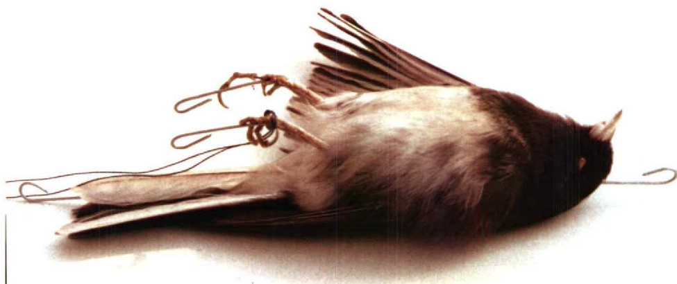
1 Dark-eyed Junco / Grijze Junco Junco hyemalis (trapped at Skorping, northern Jylland, Denmark, 13 December 1980, died 18 February 1993), Christiansfeld, Denmark, 5 June 1993 2 Dark-eyed Junco / Grijze Junco Junco hyemalis , Church Crookham, Hampshire, England, February 1990 3 Dark-eyed Junco / Grijze Junco Junco hyemalis (trapped at Rotterdam, Zuid-Holland, Netherlands, February 1962, died 7 November 1968), Natuurmuseum Rotterdam, March 1984