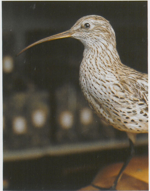
182 Dunbekwulp / Slender-billed Curlew Numenius tenuirostris , Hallum, Friesland, 27 december 1889; ZMA, juni 1987 (Edward J van IJzendoorn) 183 Dunbekwulp / Slender-billed Curlew Numenius tenuirostris , Friesche Wadden, Friesland, 16 januari 1925; FNM, juni 1986 (Edward J van IJzendoorn) 184 Haakbekken / Pine Grosbeaks Pinicola enucleator , Rotterdam, Zuid-Holland, 5 december 1909 (boven) en 8 december 1909 (onder); ZMA, december 1995 (Jan van der Laan)