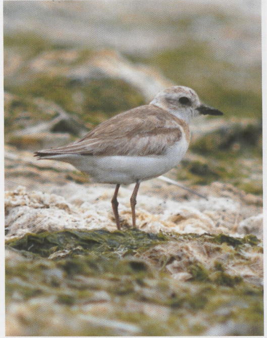
205 Slangenarend / Short-toed Eagle Circaetus gallicus , Hoge Veluwe, Gelderland, 9 augustus 1996 ( Jan den Hartog ) 206 Woestijnplevier / Greater Sand Plover Charadrius leschenaultii , De Cocksdorp, Texel, Noord-Holland, 1 augustus 1996 ( Leo J R Boon/Cursorius ) 207 Struikrietzanger / Blyth's Reed Warbler Acrocephalus dumetorum , Walem, Limburg, 24 juni 1996 ( Hans Gebuis )