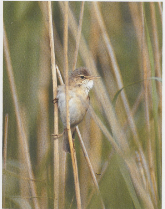
196 Red-flanked Bluetail / Blauwstaart Tarsiger cyanurus , Naakajärvi, Pajala, Lappland, Sweden, June 1996 197 Marsh Warbler / Bosrietzanger Acrocephalus palustris , Tacumshin, Wexford, Ireland, 23 June 1996 198 Pacific Golden Plover / Aziatische Goudplevier Pluvialis fulva , Camperduin, Noord-Holland, the Netherlands, 26 July 1996