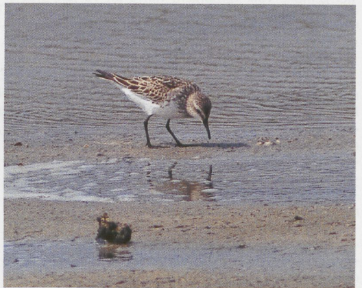
208 Grote Zaagbekken / Goosanders Mergus merganser , vrouwtje met jongen, IJmeer bij Vijfhoek, Diemen, Noord-Holland, 20 juli 1996 (Nirk Zijlmans) 209 Grauwe Fitis / Greenish Warbler Phylloscopus trochiloides , Rottumeroog, Groningen, 25 juni 1996 (Koen van Dijken/Cursorius) 210 Bairds Strandloper / Baird's Sandpiper Calidris bairdii , Katwijk aan Zee, Zuid-Holland, 27 juli 1996 (Marc Guyt) 211 Grijsje Strandloper / Semipalmated Sandpiper Calidris pusilla , Oostvaardersdijk, Flevoland, 18 juli 1996 (Arnoud B van den Berg) 212 Bonapartes Strandloper / White-rumped Sandpiper Calidris fuscicollis , adult, Wagenjot, Texel, Noord-Holland, 13 augustus 1996 (Salco de Wolf) 213 Bonapartes Strandloper / White-rumped Sandpiper Calidris fuscicollis , adult, Wagenjot, Texel, Noord-Holland, 13 augustus 1996 (Arnoud B van den Berg)