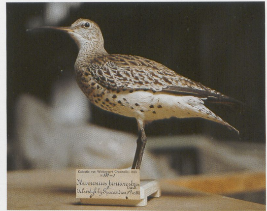
187 Wilgengors / Yellow-breasted Bunting Emberiza aureola , Rottumerplaat, Groningen, 15 juli 1977 (A Veenstra) 188 Witbandkruisbek / Two-barred Crossbill Loxia leucoptera , Tongeren, Gelderland, 29 december 1972 (Kees Terpstra) 189 Rosse Gors / Chestnut Bunting Emberiza rutila , Wassenaar, Zuid-Holland, 5 november 1937; NNM, september 1987 (Edward J van IJzendoorn) 190 Kleine Sprinkhaanzanger / Lancelated Warbler Locustella lanceolata , Haamstede, Zeeland, 11 december 1912; NNM, september 1987 (Edward J van IJzendoorn) 191 Bruinkeelortolaan / Cretzschmar's Bunting Emberiza caesia , Overveen, Noord-Holland, 11 oktober 1859; NNM, april 1996 (NNM, Leiden) / Jan van der Laan 192 Dunbekwulp / Slender-billed Curlew Numenius tenuirostris , Spaarndam, Noord-Holland, 5 december 1856; NNM, juni 1987 (Edward J van IJzendoorn)