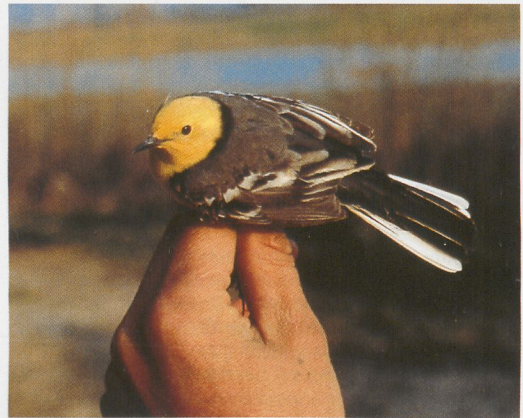
199 Pallid Harrier / Steppiekiekendief Circus macrourus , Mud'yug island, White Sea off Arkhangelsk, Russia, May 1996 200 Short-toed Eagle / Slangenarend Circaetus gallicus , Hoge Veluwe, Gelderland, the Netherlands, 8 August 1996 201 Little Swift / Huisgierzwaluw Apus affinis , near Bolonia, Andalucía, Spain, 24 July 1996 202 Spanish Sparrow / Spaanse Mus Passer hispaniolensis , Waterside, Cumbria, England, July 1996 203 Blyth's Reed Warbler / Struikrietzanger Acrocephalus dumetorum , Fair Isle, Shetland, Scotland, 12 June 1996 204 Citrine Wagtail / Citroenkwikstaart Motacilla citreola , Isola della Cona, Trieste, Italy, 10 April 1996