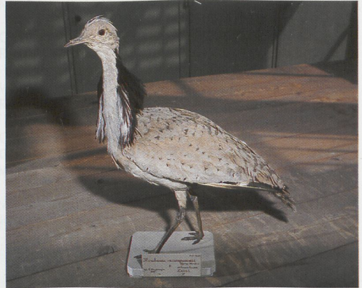
169 Siberische Taling / Baikalsee-eend Anas formosa , Damwoude, Friesland, 29 november 1948; FNM, juni 1986 (Edward J van IJzendoorn) 170 Amerikaanse Zee-eend / Black Scoter Melanitta americana , De Cocksdorp, Texel, Noord-Holland, 2 november 1967; ZMA, december 1995 (Jan van der Laan) 171 Steppekiekendief / Pallid Harrier Circus macrourus , Noordwijk, Zuid-Holland, 23 april 1866; NNM, juni 1987 (Edward J van IJzendoorn) 172 Oostelijke Kraagtrap / Macqueen's Bustard Chlamydotis (undulata) macqueenii , Zeist, Utrecht, 10 december 1850; NNM, april 1983 (Arnoud B van den Berg)

vermeld als 'vondst'), gevangen of geringd, wordt dit vermeld. Daarnaast worden verwijzingen gegeven (voor zover mogelijk), waar zich naast het CDNA-archief documentatie bevindt, zoals in literatuur of collecties. Van gevallen na 1950 wordt (voor zover mogelijk) verwezen naar het jaarverslag waarin het geval als aanvaard is opgenomen. Alleen bij vondsten en ringvangsten die niet zijn aanvaard, wordt in de meeste gevallen de reden van afwijzing vermeld. Tenslotte zijn van sommige soorten ook gevallen van na 1 januari 1980 onder de loep genomen als daar aanleiding toe was ten gevolge van veranderende inzichten die tijdens de herziening naar voren kwamen. Alleen gevallen die niet langer aan-