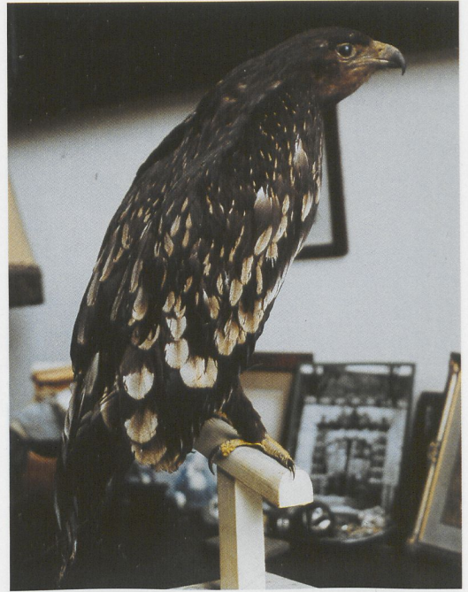
173 Bastaardarend / Spotted Eagle Aquila clanga , Raalte, Overijssel, 27 oktober 1891; NNM, juni 1987 (Edward J van IJzendoorn) 174 Bastaardarend / Spotted Eagle Aquila clanga , Haamstede, Zeeland, 2 november 1907; Slot Haamstede, juni 1987 (Edward J van IJzendoorn) 175 Bastaardarend / Spotted Eagle Aquila clanga , Vlaardinger Ambacht, Zuid-Holland, 19 oktober 1915; NNM, juni 1987 (Edward J van IJzendoorn)