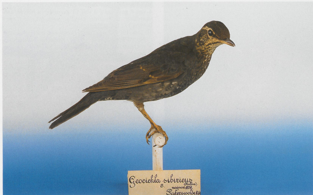
185 Siberische Lijster / Siberian Thrush Zoothera sibirica , Paterswolde, Drenthe, september 1853; NNM, augustus 1996 (NNM, Leiden) 186 Siberische Lijster / Siberian Thrush Zoothera sibirica , Noordwijk, Zuid-Holland, 1 oktober 1856 (boven), Bruine Lijster / Dusky Thrush Turdus naumanni eunomus , Veenwouden, Friesland, 20 november 1899 (midden) en Bruine Lijster / Dusky Thrush, IJsselmuiden, Overijssel, 20 februari 1955 (onder); ZMA, januari 1996 (Jan van der Laan)