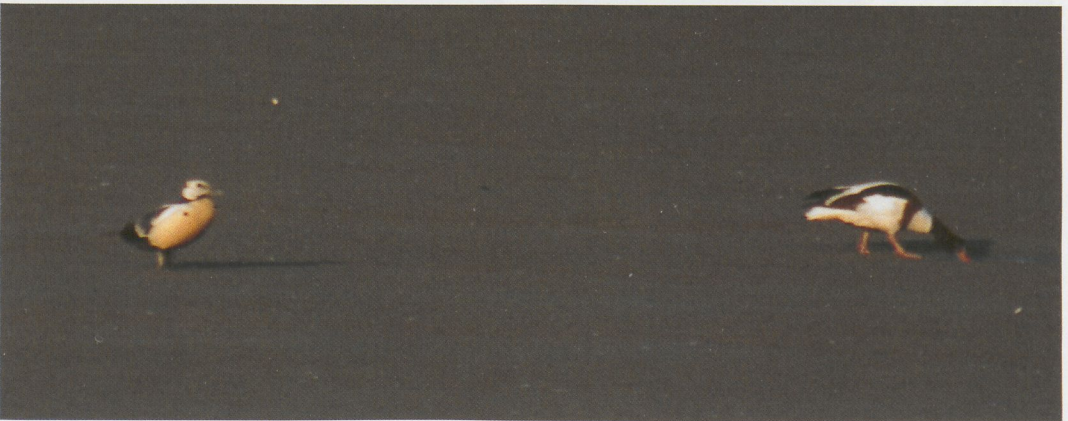
214 Grote Grijs Snip / Long-billed Dowitcher Limnodromus scolopaceus , Workumerwaard, Friesland, 11 augustus 1996 215 Witvleugelstern / White-winged Black Tern Chlidonias leucopterus , Houtribsluizen, Lelystad, Flevoland, 30 juli 1996 216 Stellers Eider / Steller's Eider Polysticta stelleri en Bergeend / Common Shelduck Tadorna tadorna , Verdronken Land van Saeftinge, Zeeland, 11 juni 1996

Brabant; Schilde, Antwerpen (twee); Scholen (twee); Sint-Pieters-Kapelle, West-Vlaanderen (vijf); en Zemst-Laar, Antwerpen. Te Antwerpen-Hooge Maay, Antwerpen, vertoefde op 30 juni een mannetje Kaneeltaling Anas cyanoptera . Zwarte Wouwen Milvus migrans werden nog waargenomen te Frasnes-lez-Buissenal, Hainaut; Glabbeek, Brabant; Melsbroek, Brabant; en Munte, Oost-Vlaanderen. De enige Rode Wouw M. milvus van deze periode vloog op 1 juni over Sint-Pieters-Voeren, Oost-Vlaanderen. Naar bijna jaarlijkse gewoonte verbleef op 3 en 4 juni alweer een Slangenarend Circaetus gallicus op het schietveld te Brecht-Wuustwezel, Antwerpen. Op 5 juni vloog een Grauwe Kiekendief Circus pygargus over Zandvoorde. Van 7 tot 9 juni en op 24 juli verbleef een Visarend Pandion haliaetus te Brecht-Wuustwezel en op 16 juni één te Harchies. Roodpootvalken Falco vespertinus bleven schaars met waarnemingen te Tienen, Brabant, en te