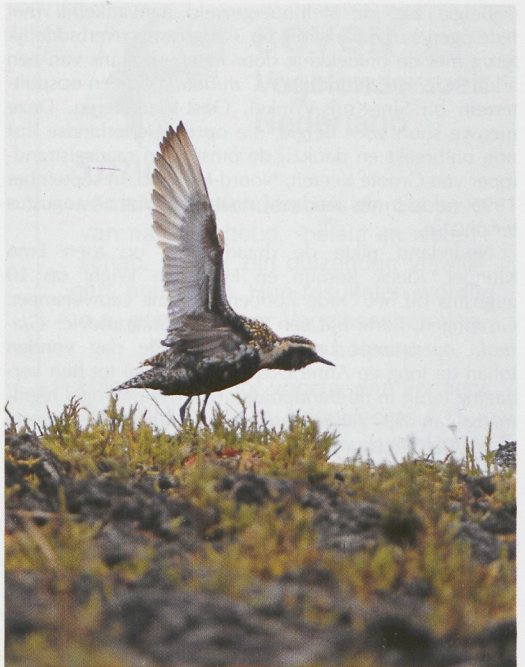
217 Kleinste Strandloper / Least Sandpiper Calidris minutilla , Sint-Kruis-Winkel, Oost-Vlaanderen, 13 augustus 1996 (Norbert Huys/Fennec Films) 218 Aziatische Goudplevier / Pacific Golden Plover Pluvialis fulva , Camperduin, Noord-Holland, 28 juli 1996 (René van Rossum) 219 Poelsnip / Great Snipe Gallinago media , West-aan-Zee, Terschelling, Friesland, augustus 1996 (Arie Ouwerkerk)