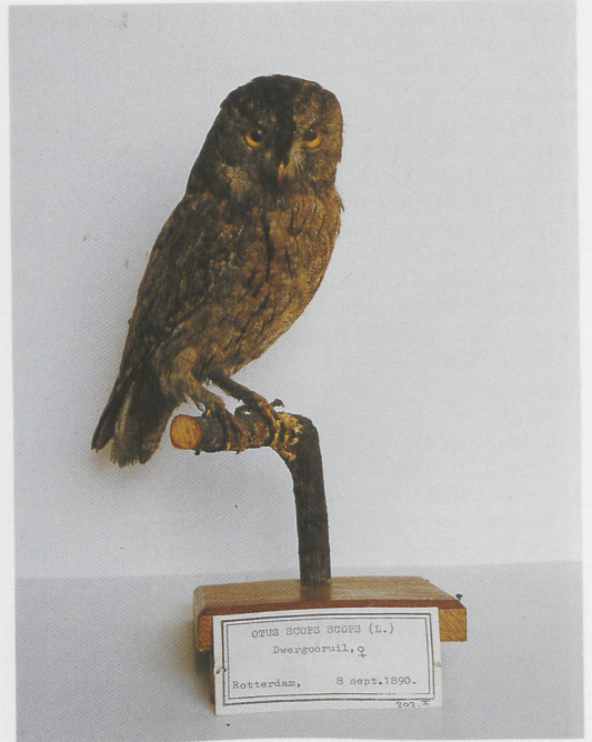
179 Monniksgier / Monk Vulture Aegypius monachus , Beneden-Leeuwen, Gelderland, 12 oktober 1948; NNM, april 1983 (Arnoud B van den Berg) 180 Dwergooruil / Eurasian Scops Owl Otus scops , Rotterdam, Zuid-Holland, 8 september 1890; NMR, januari 1986 (Paul G Schrijvershof) 181 Arendbuizerd / Long-legged Buzzard Buteo rufinus , Buikslotherham, Amsterdam-Noord, Noord-Holland, 12 december 1905 (boven) en Buizerd / Common Buzzard Buteo buteo , Velp, Gelderland, 28 oktober 1925 (onder); ZMA, juni 1987 (Edward J van IJzendoorn)