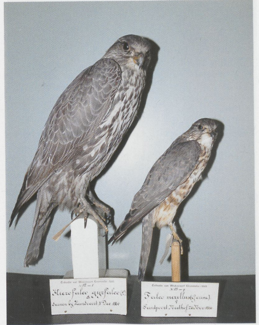
176 Reuzenzwartkopmeeuw / Great Black-headed Gull Larus ichthyaetus , Oostvaardersdijk, Flevoland, zomer 1974 (Nico Marra sr) 177 Giervalk / Gyr Falcon Falco rusticolus , Zandvoort, Noord-Holland, 3 december 1864 (links) en IJslands Smelleken / Icelandic Merlin F. columbarius subaesalon , Santpoort, Noord-Holland, 26 november 1866 (rechts); NNM, april 1996 (NNM, Leiden/Jan van der Laan) 178 Giervalk / Gyr Falcon Falco rusticolus , Noordwijk, Zuid-Holland, 16 oktober 1849 (links) en Rijsbergen, Noord-Brabant, 7 december 1909 (rechts); NNM, april 1996 (NNM, Leiden/Jan van der Laan)