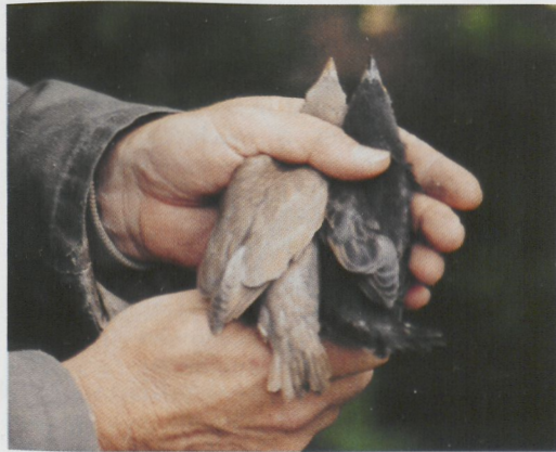
232-233 Spreeuw / Common Starling Sturnus vulgaris , 18 dagen oud 'biscuitkleurig' juveniel met normaal gekleurd juveniel uit zelfde nest, Weerselo, Overijssel, 19 mei 1995 ( Hermine Jonker ) 234 Roze Spreeuw / Rosy Starling Sturnus roseus , juveniel, 't Horntje, Texel, Noord-Holland, 21 oktober 1995 ( Arnoud B van den Berg )