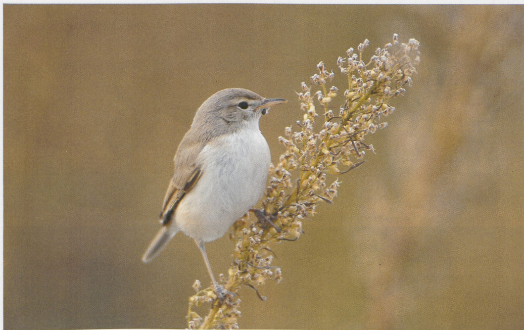
248 Booted Warbler / Kleine Spotvogel Hippolais caligata , Rheindelta-Vorarlberg, Austria, September 1996