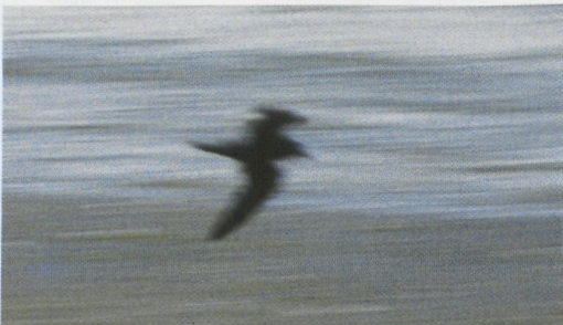
220-221 Bulwers Stormvogel / Bulwer's Petrel Bulweria bulwerii , Westplaat bij Maasvlakte, Zuid-Holland, 21 augustus 1995

Jouanins komt voor in de Indische Oceaan en werd éénmaal met zekerheid in het West-Pale-