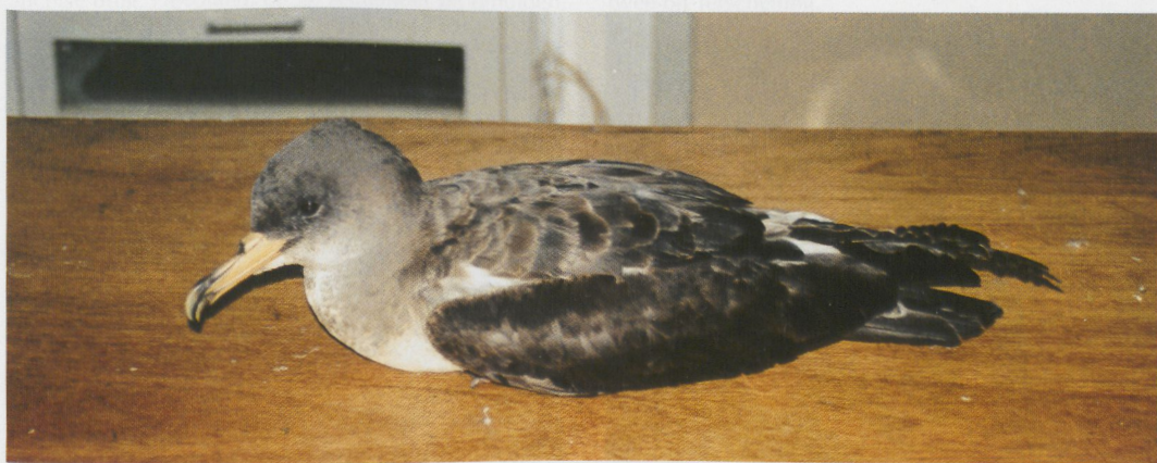
256 Grauwe Fitis / Greenish Warbler Phylloscopus trochiloides , Neeltje Jans, Zeeland, 31 augustus 1996 (Peter van Rij) 257 Kleine Spotvogel / Booted Warbler Hippolais caligata , Maasvlakte, Zuid-Holland, 1 september 1996 (Hans Gebuis) 258 Kleinste Jager / Long-tailed Skua Stercorarius longicaudus , Maasvlakte, Zuid-Holland, 16 september 1996 (Hans Gebuis) 259 Kuhls Pijlstormvogel / Cory's Shearwater Calonectris diomedea (gevonden te Fijnaart, Noord-Brabant, 27 september 1996), Zundert, Noord-Brabant, september 1996 (Hans Westerlaken)