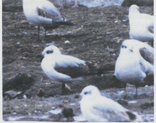
230-231 Mediterranean Gull / Zwartkopmeeuw Larus melanocephalus , first-year with all-dark wings, Le Portel, Pas-de-Calais, France, 20 February 1995