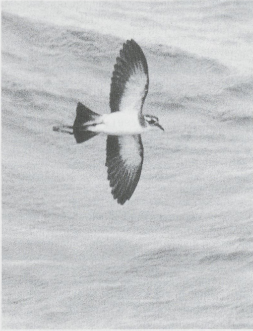
229 White-faced Storm-petrel / Bont Stormvogeltje Pelagodroma marina , Salvage Islands, 16 July 1984 (Antonio Teixeira). Note bulging gular patch

steady state, the wings were raised slowly up and down like those of a perched butterfly. Sometimes individuals broke away from this apparent feeding position to glide forward on rigidly held horizontal wings and tail, sliding over crests and along troughs without any visible body movement, with a trajectory like that of a flying fish (cf Jolliffe 1990 for an excellent description). The 'shuffle' and glide seem to be associated with light to moderate winds and a visible swell, the birds often facing downwind. That this mode of