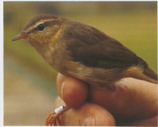
DB Actueel: 266-267 Roodoogvireo / Red-eyed Vireo Vireo olivaceus , eerstejaars, Lange Paal, Vlieland, Friesland, 6 oktober 1996 (Hans Gebuis) 268 Raddes Boszanger / Radde's Warbler Phylloscopus schwarzi , Zandvoort, Noord-Holland, 12 oktober 1996 (Tom M van Spanje) 269 Raddes Boszanger / Radde's Warbler Phylloscopus schwarzi , Koryerskooi, Texel, Noord-Holland, 11 oktober 1996 (Marco Witte) 270 Noordse Boszanger / Arctic Warbler Phylloscopus borealis , Terschelling, Friesland, 2 oktober 1996 (Arie Ouwerkerk) 271 Bruine Boszanger / Dusky Warbler Phylloscopus fuscatus , Zandvoort, Noord-Holland, 8 oktober 1996 (Tom M van Spanje)