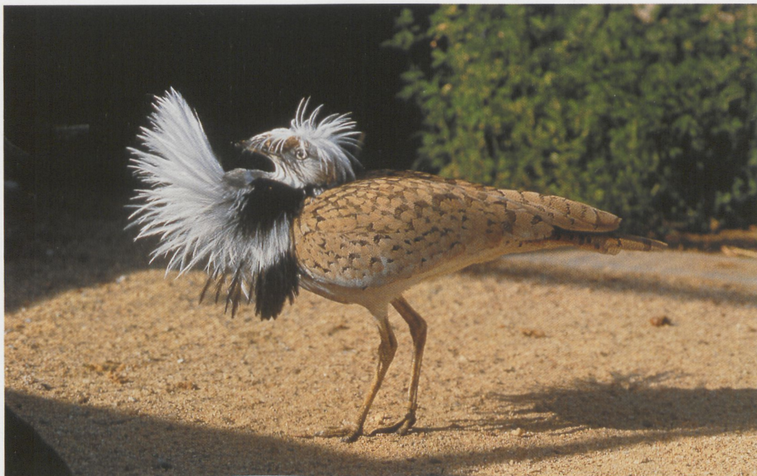
240 Macqueen's Bustard / Oostelijke Kraagtrap Chlamydotis macqueenii , male showing almost complete feather erection just prior to display run, Taif, Saudi Arabia (National Wildlife Research Center Photo Library) 241 Houbara Bustard / Westelijke Kraagtrap Chlamydotis undulata undulata , male showing almost complete feather erection just prior to display run, Taif, Saudi Arabia (National Wildlife Research Center Photo Library). Note differences in plume colour at side of neck (black and white in macqueenii , black only in undulata ) and degree to which head plumes fall over bill, particularly evident when comparing plates 240 and 241