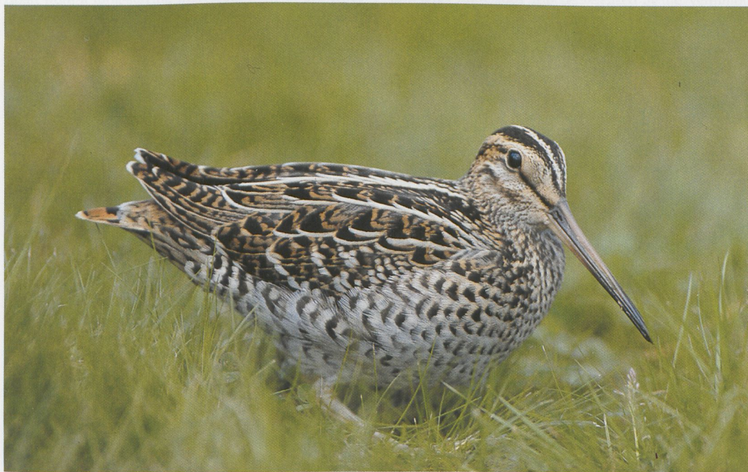
244 Great Snipe / Poelsnip Gallinago media , Tampere, Finland, 15 September 1996