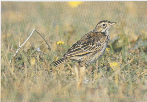
278 Mongoolse Pieper / Blyth's Pipit Anthus godlewskii , Maasvlakte, Zuid-Holland, 26 oktober 1996 (Marc Guyt)