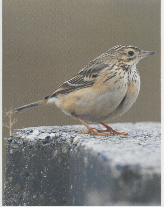
245 Lanceolated Warbler / Kleine Sprinkhaanzanger Locustella lanceolata , Zeebrugge, West-Vlaanderen, Belgium, October 1996 (Kris de Rouck) 246-247 Blyth's Pipit / Mongoolse Pieper Anthus godlewskii , Helgoland, Schleswig-Holstein, Germany, 2 October 1996 (Axel Halley)