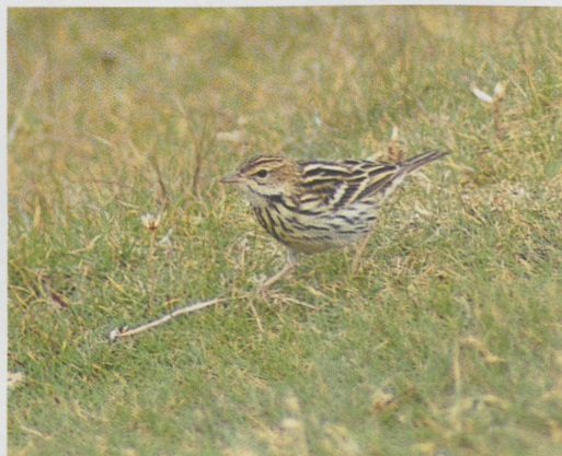
250 Little Swift / Huisgierzwaluw Apus affinis , near Bolonia, Andaluc a, Spain, 24 July 1996 (Diederik Kok) 251 hybrid Black Kite x Common Buzzard / hybride Zwarte Wouw x Buizerd Milvus migrans x Buteo buteo , juvenile, Tolfa, Rome, Italy, August 1996 (Andrea Corso & Roberto Gildi) 252 Paddyfield Warbler / Veldrietzanger Acrocephalus agricola , Fair Isle, Shetland, Scotland, 19 September 1996 (Roger Riddington) 253 Arctic Warbler / Noordse Boszanger Phylloscopus borealis , Fair Isle, Shetland, Scotland, 8 September 1996 (Roger Riddington) 254 Desert Wheatear / Woestijntapuit Oenanthe deserti , male, Den Helder, Noord-Holland, the Netherlands, 3 November 1996 (Ren  Pop) 255 Pechora Pipit / Petsjorapieper Anthus gustavi , Fair Isle, Shetland, Scotland, 20 September 1996 (Roger Riddington)