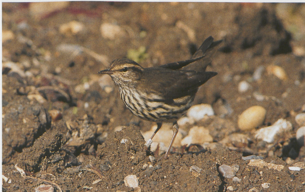
249 Northern Waterthrush / Noordse Waterlijster Seiurus noveboracensis , Portland Bill, Dorset, England, 17 October 1996 (Graham Armstrong)