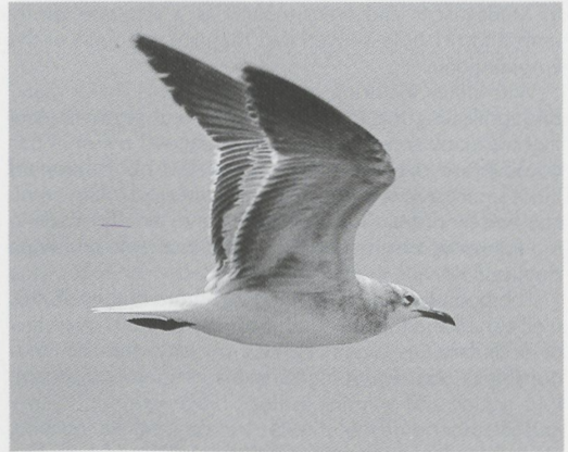
Mystery photograph 57. Solution in next issue

dense mixed geese flocks, have created confusion about the alleged presence of Lesser Canada Goose in the Netherlands. Until 1 January 1995, however, only one individual has been docu-