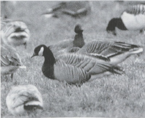
242 hybrid Canada Goose x Barnacle Goose / hybride Canadese Gans x Brandgans Branta canadensis x leucopsis , Goedereede, Zuid-Holland, the Netherlands, winter of 1986/87 (Rob Cuypers)

dense mixed geese flocks, have created confusion about the alleged presence of Lesser Canada Goose in the Netherlands. Until 1 January 1995, however, only one individual has been docu-