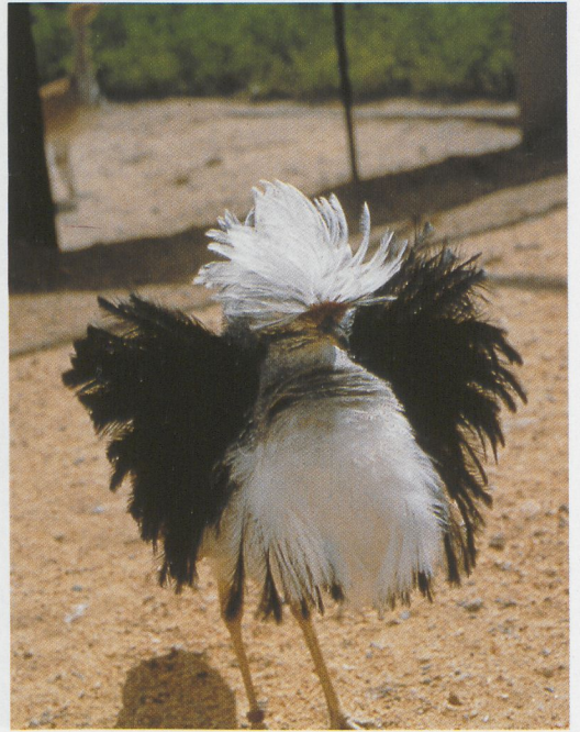
237 Macqueen's Bustard / Oostelijke Kraagtrap Chlamydotis macqueenii , male at start of feather erection, Taif, Saudi Arabia (National Wildlife Research Center Photo Library) 238 Houbara Bustard / Westelijke Kraagtrap Chlamydotis undulata undulata , male at start of feather erection, Taif, Saudi Arabia (National Wildlife Research Center Photo Library) 239 Macqueen's Bustard / Oostelijke Kraagtrap Chlamydotis macqueenii , male with full feather erection during display run, Taif, Saudi Arabia (National Wildlife Research Center Photo Library)