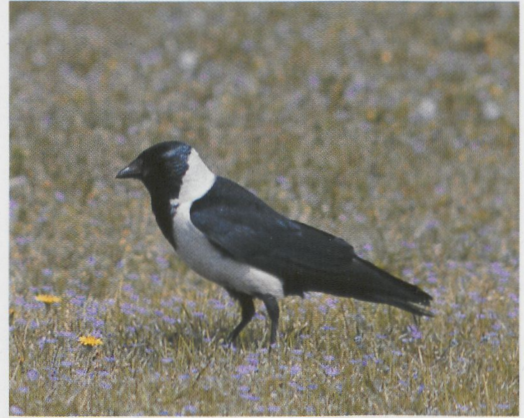
222 Daurische Kauw / Daurian Jackdaw Corvus dauuricus , adult, Westduinpark, Den Haag, Zuid-Holland, 7 mei 1995 223 Daurische Kauw / Daurian Jackdaw Corvus dauuricus , adult, Katwijk aan Zee, Zuid-Holland, 4 mei 1995 224-225 Daurische Kauw / Daurian Jackdaw Corvus dauuricus , adult, Katwijk aan Zee, Zuid-Holland, 5 mei 1995

men zicht krijgt op de Puinhoop. AM bleef als aan de grond genageld staan. Zo'n 100 m verderop, aan de voet van de Puinhoop, liep een Daurische Kauw!