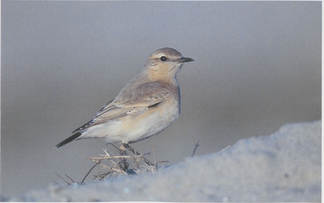
276 Izabeltapuit / Isabelline Wheatear Oenanthe isabellina , Maasvlakte, Zuid-Holland, 23 oktober 1996