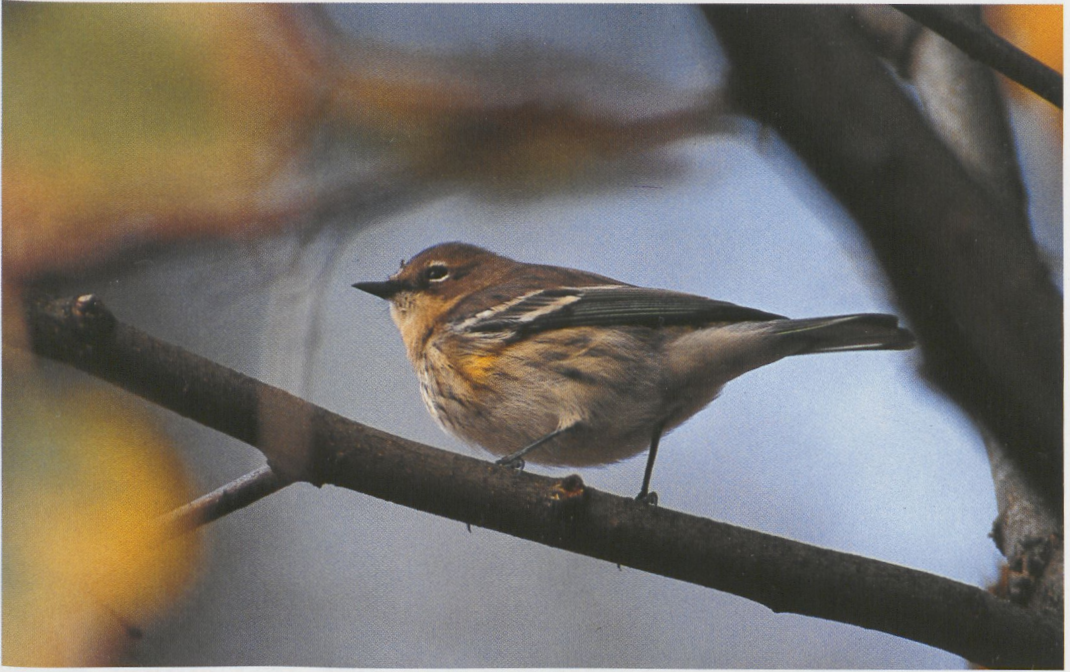
273 Mirtezanger / Myrtle Warbler Dendroica coronata coronata , adult mannetje, Vlieland, Friesland, 14 oktober 1996 (Hans Gebuis) 274 Mirtezanger / Myrtle Warbler Dendroica coronata coronata , adult mannetje, Vlieland, Friesland, 14 oktober 1996 (René Pop) 275 Mongoolse Pieper / Blyth's Pipit Anthus godlewskii , Maasvlakte, Zuid-Holland, 26 oktober 1996 (Hans Gebuis)