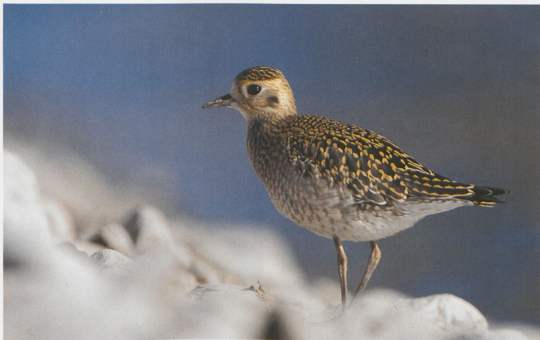
243 Pacific Golden Plover / Aziatische Goudplevier Pluvialis fulva , Lohja, Finland, 19 September 1996 (Henry Lehto)