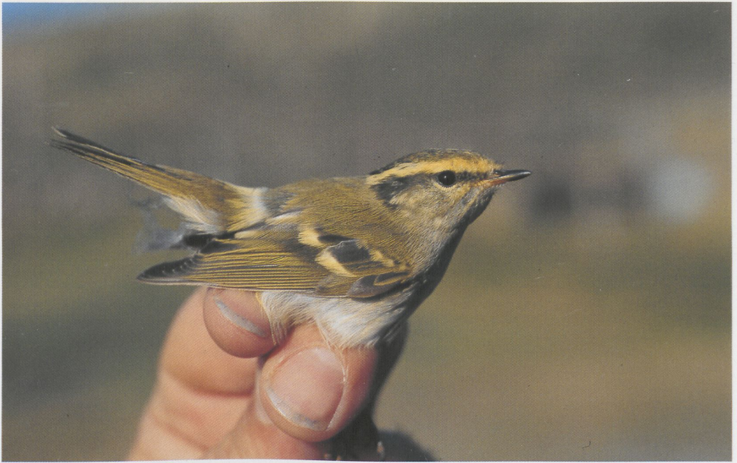
DB Actueel: 272 Pallas' Boszanger / Pallas's Leaf Warbler Phylloscopus proregulus , Bloemendaal, Noord-Holland, 14 oktober 1996

tals, Antwerpen; Lier, Antwerpen; Mechelen; Nieuwpoort (twee); Oud-Turnhout (vijf); Veerle, Antwerpen (vier); en Wechelderzande, Antwerpen. Een groep van 29 te Boechout, Antwerpen, en een groep van 48 te Muizen, Vlaams-Brabant, op 27 augustus, verzamelden zich op 28 augustus boven Sint-Lambrechts-Woluwe, Brussel, in een spectaculaire groep van 60 à 70 vogels; het ging om vooral Nederlandse project-Ooievaars. Nog eens 13 vlogen over Winksele-Herent, Vlaams-Brabant, op 30 augustus en 32 over Boechout op 2 september. Langs Oostende trok op 2 september een Zwarte Ibis Plegadis falcinellus . Op 31 augustus vlogen drie Sneeuwanzen Anser caerulescens over Zandvliet, Antwerpen; de datum kon beter.... Reeds op 24 september zwom een vrouwtje Witoogend Aythya nyroca op De Maten te Diepenbeek, Limburg. De (hopelijk) enige Rosse Stekelstaart Oxyura jamaicensis werd op 16 augustus waargenomen te Doornzele, Oost-Vlaanderen. Op 30 augustus vloog de enige Zwarte Wouw Milvus migrans van deze periode over Egezee, Namur. Rode Wouwen M milvus trokken over Antwerpen-De Kuifeend; Dudzele; Kallo-Doel, Oost-Vlaanderen; Munte, Oost-Vlaanderen; en Zandvoorde. En wat vloog op 17 augustus over het schietveld te Brecht...? Een Slangenarend Circaetus gallicus uiterwaard. Een tweede waarneming van een overtrekkende vogel gebeurde op 26 augustus bij Kessel, Antwerpen. Een derde-kalenderjaar Steppiekiekie Circus macrourus joeg, als herhaling op vorig jaar, op 24 augustus