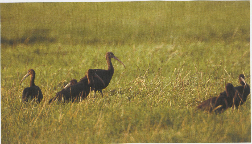
291 Zwarte Ibissen / Glossy Ibises Plegadis falcinellus , Stitswerd, Groningen, oktober 1994

Een gewaagde theorie over de herkomst van Zwarte Ibissen in West-Europa werd gepubliceerd door Wille (1986) en Vanpraet & Wille (1988). Zij gaan ervan uit dat Zwarte Ibissen in West-Europa van Noord-Amerikaanse herkomst zijn. Volgens Wille (1986) zouden de West-Europese Zwarte Ibissen via de Britse eilanden