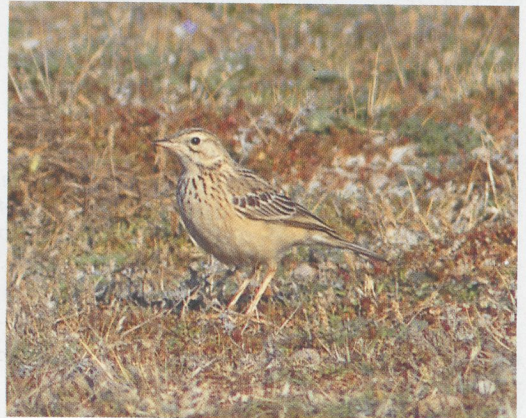
319 Bonte Tapuit / Pied Wheatear Oenanthe pleschanka , eerste-winter mannetje, Stroe, Wieringen, Noord-Holland, 17 november 1996 (Ruud E Brouwer) 320 Grote Burgemeester / Glaucous Gull Larus hyperboreus , Brouwersdam, Zuid-Holland, 20 oktober 1996 (Paul Knolle) 321 Aziatische Roodborsttapuit / Siberian Stonechat Saxicola torquata maura , Den Helder, Noord-Holland, 12 oktober 1996 (Ruud E Brouwer) 322 Witkopgors / Pine Bunting Emberiza leucocephalos , vrouwtje, Katwijk aan Zee, Zuid-Holland, november 1996 (Marc Guyt) 323 Withalsvliegenvanger / Collared Flycatcher Ficedula albicollis , eerste-winter mannetje, Terschelling, Friesland, 12 oktober 1996 (Arie Ouwerkerk) 324 Mongoolse Pieper / Blyth's Pipit Antus godlewskii , Maasvlakte, Zuid-Holland, 26 oktober 1996 (Arnoud B van den Berg)