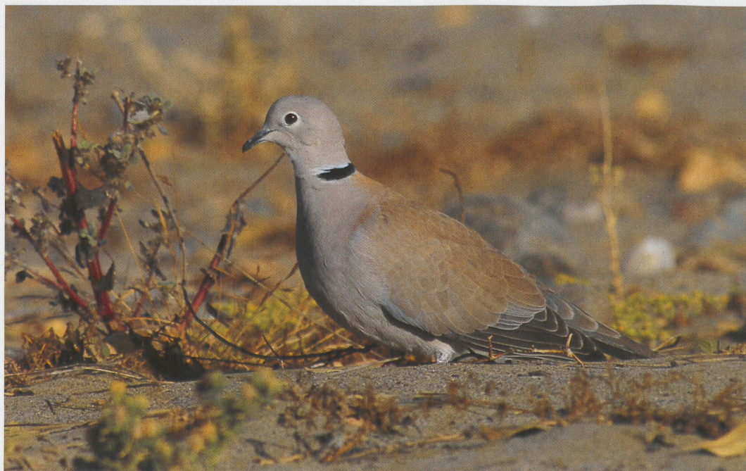
282 African Collared Dove / Izabeltortel Streptopelia roseogrisea , Gebel Abu Hadid (north of Gebel Elba), Egypt, 15 March 1995 ( Dina Ali & Rafik Khalil )