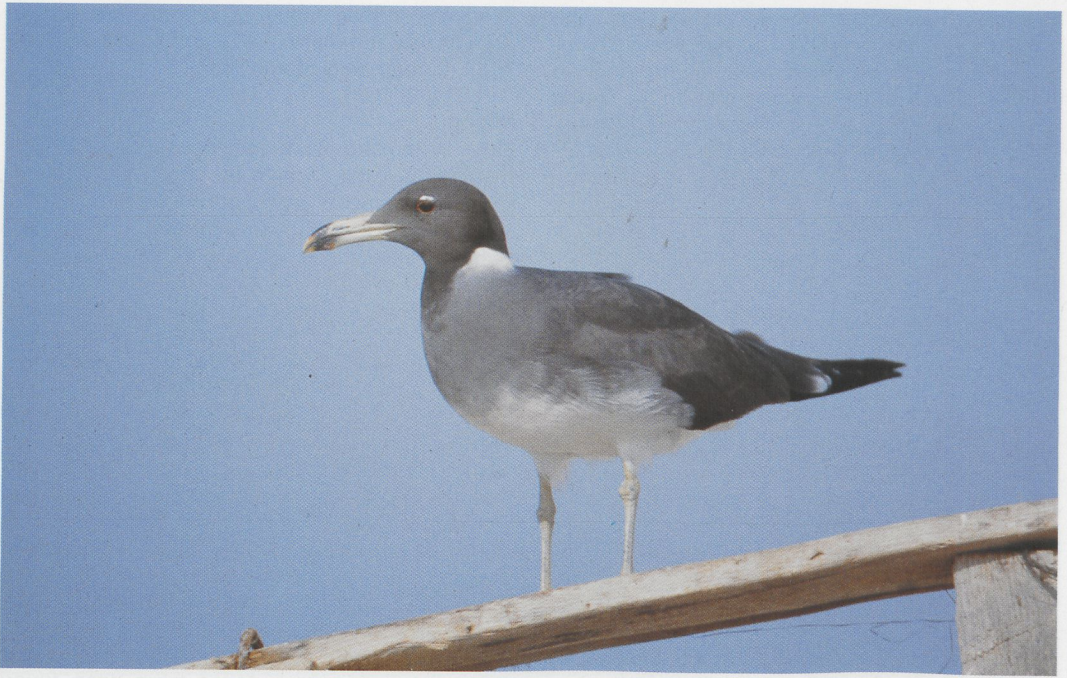
283 Sooty Gull / Hemprichs Meeuw Larus hemprichii , Siyal Islands, Egypt, 25 April 1985 (Peter L Meininger) 284 Blackstart / Zwartstaart Cercomela melanura , Wadi Aideib, Gebel Elba, Egypt, April 1985 (Peter L Meininger) 285 Pallid Harrier / Steppekiekendief Circus macrourus , adult male, Wadi Aideib, Gebel Elba, Egypt, April 1985 (Peter L Meininger)