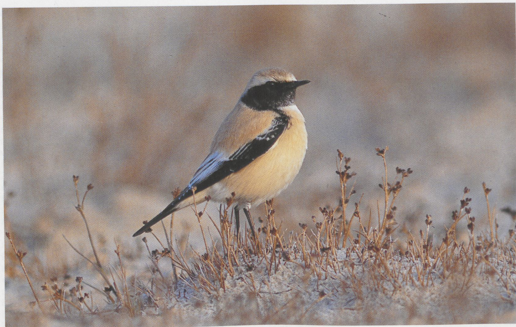
317 Woestijntapuit / Desert Wheatear Oenanthe deserti , Den Helder, Noord-Holland, 12 november 1996 (Ruud E Brouwer)