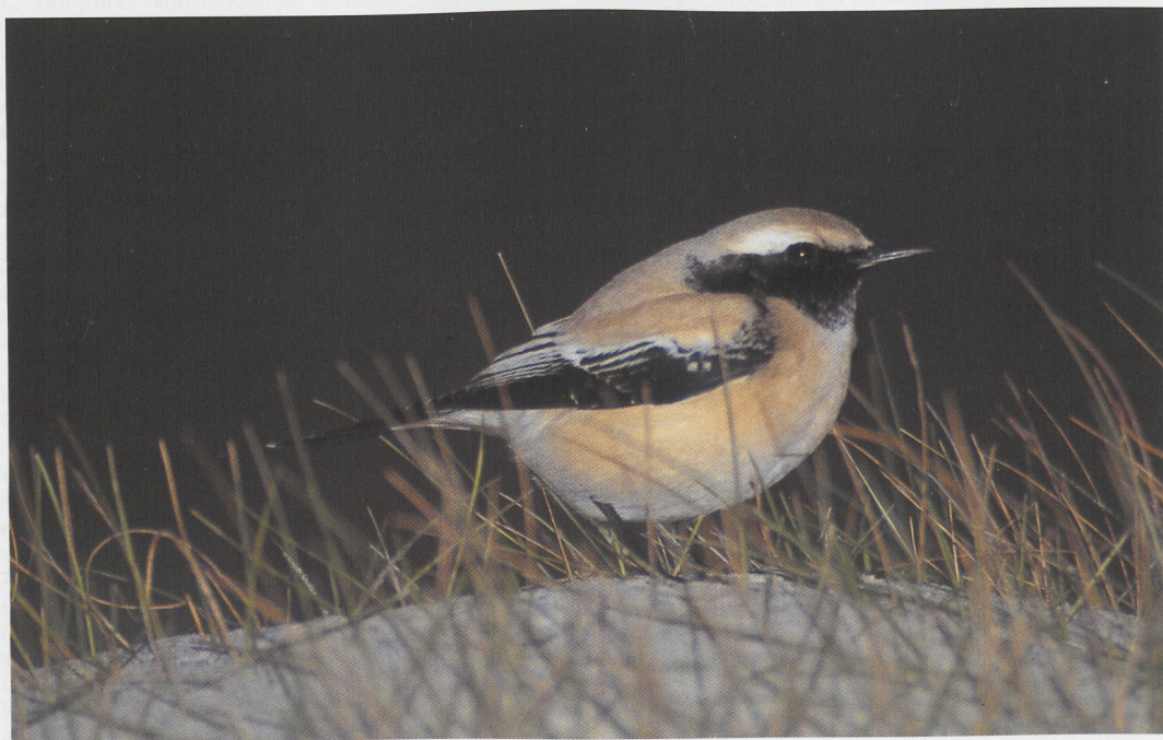
318 Woestijntapuit / Desert Wheatear Oenanthe deserti , Den Helder, Noord-Holland, november 1996 (Harm Niesen)