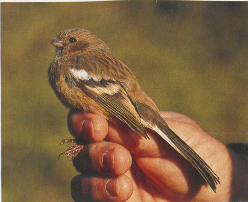
292 Langstaartroodmus / Long-tailed Rosefinch Uragus sibiricus , Zandvoort, Noord-Holland, 28 oktober 1991