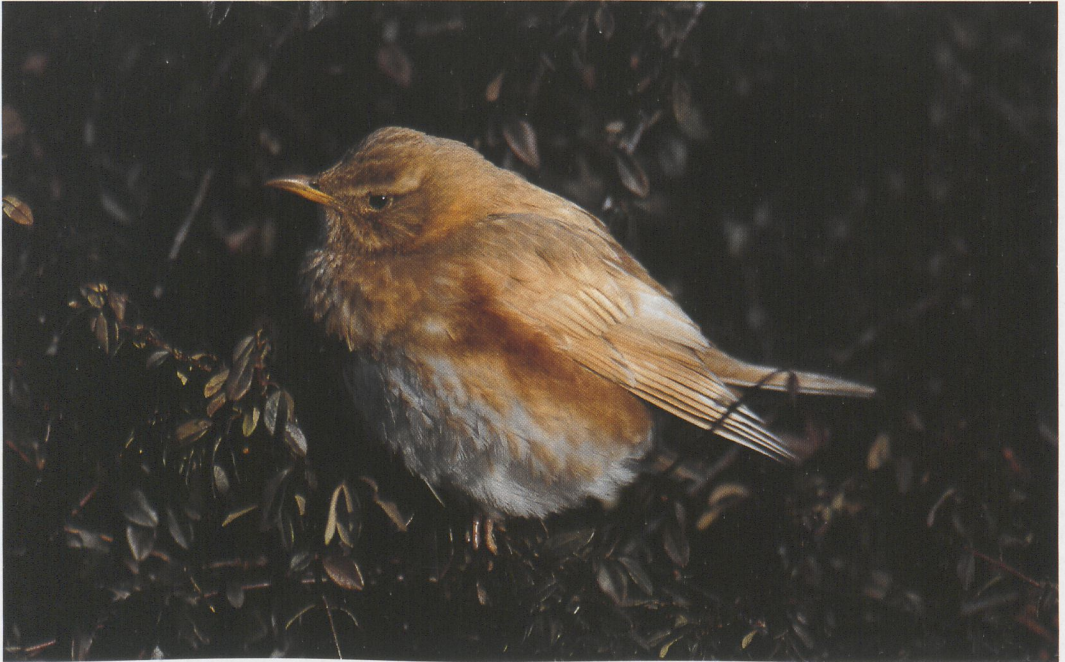
294 Leucistic Redwing / leucistische Koperwiek Turdus iliacus , Midsland, Terschelling, Friesland, 29 January 1996