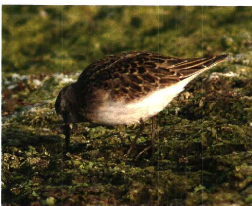
14-15 Mystery stint / raadselstrandloper Calidris , juvenile, Groote Keeten, Noord-Holland, 24 September 1995 16-19 Mystery stint / raadselstrandloper Calidris , juvenile, Groote Keeten, Noord-Holland, 23 September 1995