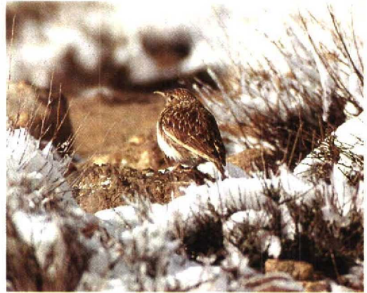
9 Dupont's Lark / Duponts Leeuwerik Chersophilus duponti , Tizi-n-Taghatine, Ouarzazate, Morocco, 7 January 1994

Cramp, S 1988. The birds of the Western Palearctic 5. Oxford.