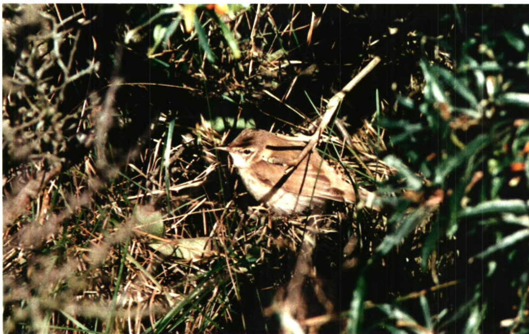
10 Veldrietzanger / Paddyfield Warbler Acrocephalus agricola , Vlieland, Friesland, 18 september 1994

Nederland. De zes voorgaande gevallen betroffen alle ringvangsten en dateren van 2 oktober 1971 te Laaxum, Friesland (van IJzendoorn & Westhof 1985, met foto's); 23 oktober 1982 te Makkum, Friesland (de Vries 1987, met foto); 13 oktober 1984 eveneens te Makkum (de Jong 1985, met foto's); 26 september 1986, eveneens op Vlieland (Terpstra 1988); 8 september 1987 te Zuidland, Zuid-Holland (Oudebeek 1988, met foto); en 8 september 1987 langs de Oostvaardersdijk, Flevoland (foto in van den Burg et al 1987) (cf van den Berg & Bosman 1995).