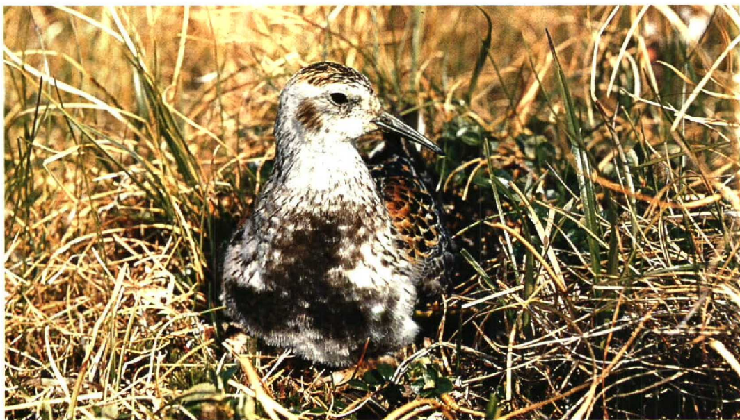
8 Rock Sandpiper / Beringstrandloper Calidris ptilocnemis , male, Chukotsky Peninsula, Russia, 9 July 1979 (Pavel S Tomkovich)

Some species have penetrated into north-eastern Siberia rather recently from both western and eastern directions. For example, Little Stint C minuta is the most numerous and characteristic arctic sandpiper of western and central Siberia, but it is an uncommon and irregular breeding bird east of the Indigirka River, though it is known from all northern Siberian coasts up to the Bering Strait. Baird's Sandpiper C bairdii is a typical American high arctic species but also breeds in