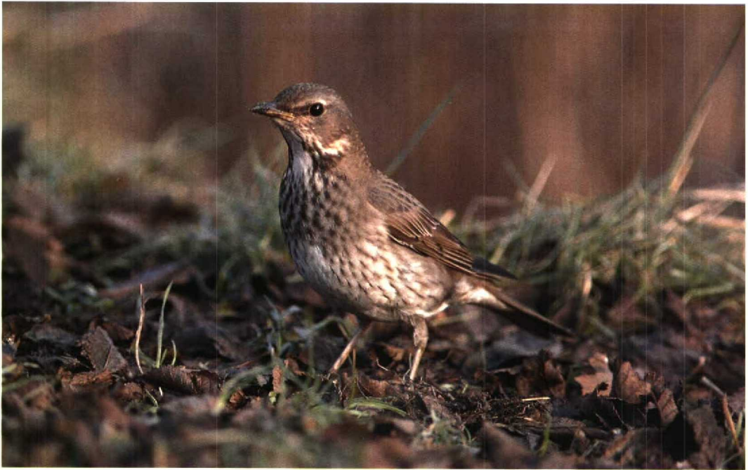
28 Zwartkeellijster / Black-throated Thrush Turdus ruficollis atrogularis , eerste-winter vrouwtje, Den Helder, Noord-Holland, 12 januari 1996 29 Kleine Zilverreiger / Little Egret Egretta garzetta , Serooskerke, Zeeland, 29 december 1995 30 Grote Pieper / Richard's Pipit Anthus richardi , Eijsden, Limburg, december 1995