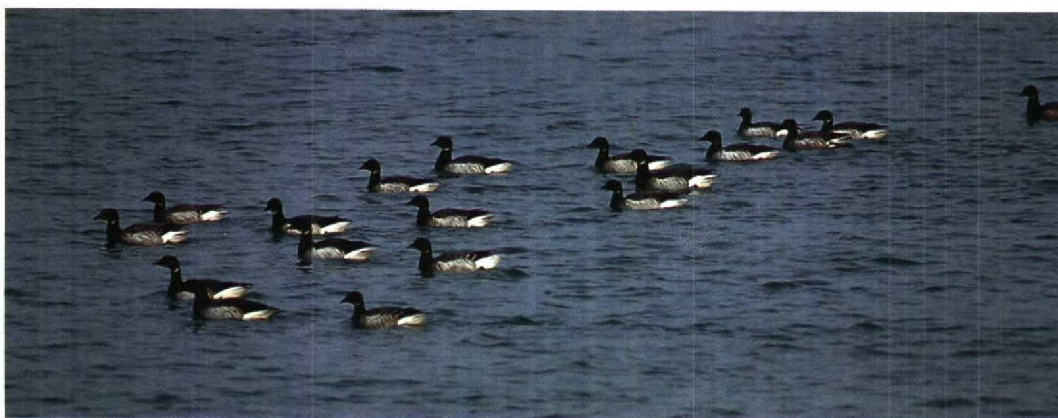
31 Provençaalse Grasmus / Dartford Warbler Sylvia undata , Westkapelle, Zeeland, 1 december 1995 32 Dwerggors / Little Bunting Emberiza pusilla , Katwijk, Zuid-Holland, 25 december 1995 33 Humes Bladkoning / Hume's Yellow-browed Warbler Phylloscopus humei , Den Haag, Zuid-Holland, 29 december 1995 34 Witstuitbarmsijs / Arctic Redpoll Carduelis hornemanni exillipes , Lopik, Utrecht, 5 februari 1996 35 Witbuikrotganzen / Pale-bellied Brent Geese Branta bernicla hrota , Neeltje Jans, Zeeland, 2 januari 1996