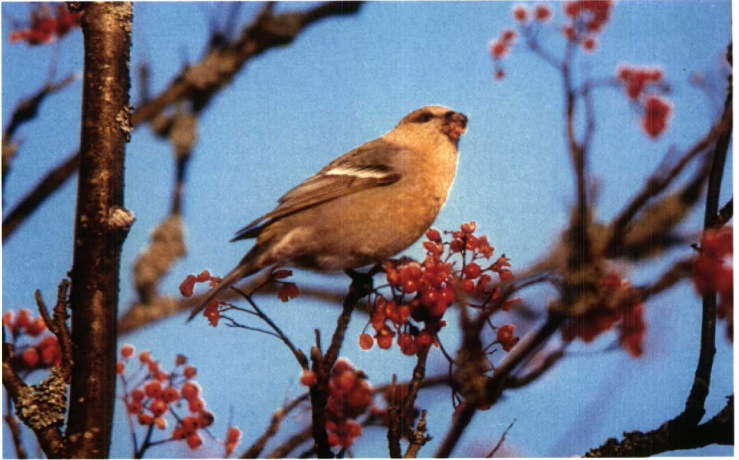
24 Pine Grosbeak / Haakbek Pinicola enucleator , Sunnersta, Uppsala, Uppland, Sweden, December 1995