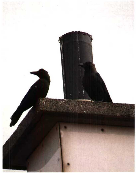
4 Huiskraai / House Crow Corvus splendens , tweede-kalenderjaar, Hoek van Holland, Zuid-Holland, 30 juni 1994 (Arnoud B van den Berg) 5 Huiskraaien / House Crows Corvus splendens , derde-kalenderjaar, Hoek van Holland, Zuid-Holland, 17 augustus 1995 (Arnoud B van den Berg) 6 Huiskraai / House Crow Corvus splendens , Renesse, Zeeland, 27 november 1995 (Eric Koops) 7 Huiskraai / House Crow Corvus splendens , Dunmore East Harbour, Waterford, Ierland, november 1974 (John Lovatt)