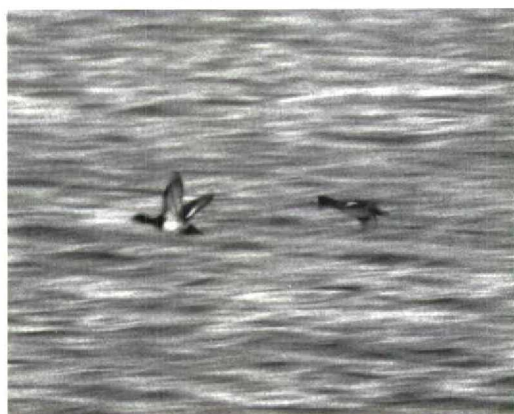
41 Kleine Topper / Lesser Scaup Aythya affinis , mannetje, Lelystad-Haven, Flevoland, 13 januari 1996

dat bovengenoemde waarnemers hun Kleine Topper introkken. Dit zal mede de reden zijn geweest dat de volgende ochtend Jaap en Peter Eerdmans als enige vogelaars in Lelystad-Haven aan het zoeken waren. Ook die ochtend kon de vogel ondanks intensief spoorwerk niet meer worden gevonden. JAAP D EERDMANS & RUUD M VAN DONGEN