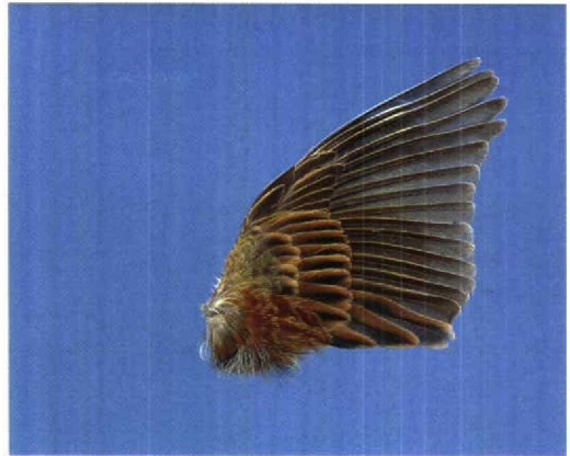
12 Cirlgors / Cirl Bunting Emberiza cirius , tweede-kalenderjaar mannetje (gevonden te Hoogerheide, Noord-Brabant, 13 maart 1995), Zoologisch Museum Amsterdam, Noord-Holland, juni 1995 (Louis A van der Laan)

van den Berg, A B & Bosman, C A W 1996. Lijst van