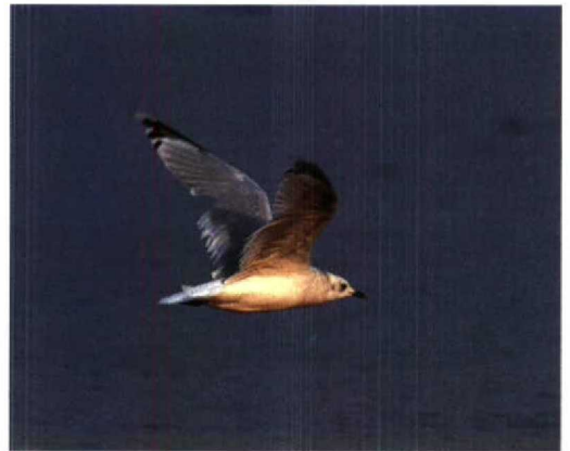
55 Relict Gull / Relictmeeuw Larus relictus , fresh second-winter (outer primary not yet fully grown), Happy Island, Hebei, China, September 1994 (Felix Heintzenberg). Note greenish bill with black tip and primary pattern 56 Relict Gulls / Relictmeeuwen Larus relictus , fresh second-winter (left) and adult-summer moulting to adult-winter, Happy Island, Hebei, China, September 1994 (Felix Heintzenberg) 57 Relict Gull / Relictmeeuw Larus relictus , second-winter, Happy Island, Hebei, China, September 1994 (Felix Heintzenberg) 58 Relict Gull / Relictmeeuw Larus relictus , moulting from second-summer to adult-winter, Happy Island, Hebei, China, September 1994 (Felix Heintzenberg)

from the breeding areas or different migration routes and wintering areas of this age group.