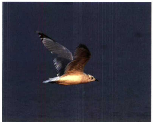
55 Relict Gull / Relictmeeuw Larus relictus , fresh second-winter (outer primary not yet fully grown), Happy Island, Hebei, China, September 1994 (Felix Heintzenberg). Note greenish bill with black tip and primary pattern 56 Relict Gulls / Relictmeeuwen Larus relictus , fresh second-winter (left) and adult-summer moulting to adult-winter, Happy Island, Hebei, China, September 1994 (Felix Heintzenberg) 57 Relict Gull / Relictmeeuw Larus relictus , second-winter, Happy Island, Hebei, China, September 1994 (Felix Heintzenberg) 58 Relict Gull / Relictmeeuw Larus relictus , moulting from second-summer to adult-winter, Happy Island, Hebei, China, September 1994 (Felix Heintzenberg)

from the breeding areas or different migration routes and wintering areas of this age group.