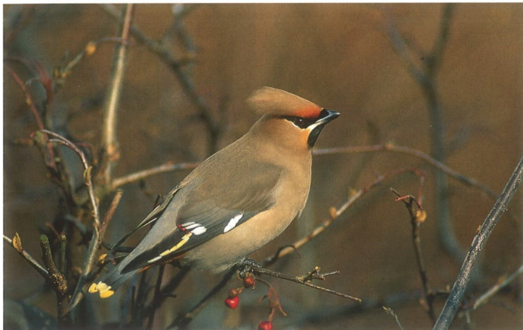
98 Pestvogel / Bohemian Waxwing Bombycilla garrulus , Papendrecht, Zuid-Holland, maart 1996