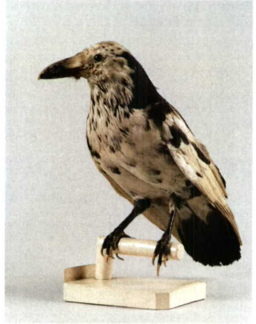
74-75 'White Raven' / 'Witte Raaf' Corvus corax varius , pied morph (collected at Faeroes, 1840), Nationaal Natuurhistorisch Museum (NNM), Leiden, Zuid-Holland, the Netherlands, February 1996 (NNM, Leiden)

as a mutant of the black Raven, with the depigmentation being due to one gene only, which was recessive (according to the general rule for albinistic mutants). As a result, pied individuals have always been in the minority compared with all-black birds.