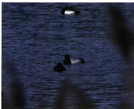
59-60 Kleine Topper / Lesser Scaup Aythya affinis , mannetje, Veere, Zeeland, 11 december 1994 (Arnoud B van den Berg) 61 Kleine Topper / Lesser Scaup Aythya affinis , mannetje, Veere, Zeeland, december 1994 (Max Berlijn) 62 Kleine Topper / Lesser Scaup Aythya affinis , mannetje, Veere, Zeeland, 1 april 1995 (Eric Koops)

het kenmerkende vleugelpatroon op video vast te leggen. Vervolgens werd de aanwezigheid van de vogel per semafoon en vogellijn bekendgemaakt. In het weekend daarna konden enkele 100en vogelaars de Kleine Topper bekijken.