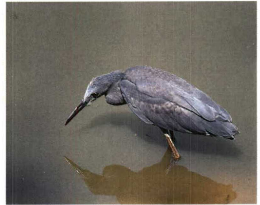
47 Swamp Alseonax / Moerasvliegenvanger Muscicapa aquatica , Jakhaly, The Gambia, 5 March 1995 (Roy de Haas) 48 Senegal Coucal / Senegalese Spoorkeekoek Centropus senegalensis , Abuko, The Gambia, 7 March 1995 (Roy de Haas) 49-50 Red-throated Bee-eaters / Roodkeelbijeneters Merops bulocki , Basse, The Gambia, 3 March 1995 (Roy de Haas) 51 Western Bluebill / Roodborstblauwsnavel Spermophaga haematina , Abuko, The Gambia, 7 March 1995 (Roy de Haas) 52 Black Egret / Zwarte Reiger Egretta ardesiaca , Casino Cycle Track, Serrekunda, The Gambia, 27 February 1995 (Roy de Haas)