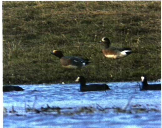
65 Hybride smient / hybrid wigeon Anas , Deventer, Overijssel, 6 maart 1994 (Mark Zekhuis)

De vogel leek veel op een Amerikaanse Smient en werd als zodanig nog een 10-tal dagen na de ontdekking gemeld. Deze soort kan echter worden uitgesloten op grond van de grijsbruine mantel, rug en achterflank en de 'vierkante' vorm van de op de bovenkop eindigende geelwitte voorhoofdsvlak. Bij een Amerikaanse Smient zijn de mantel en de rug bruinachtig en de flanken uniform roodbruin zonder grijs, loopt de voorhoofdsvlak verder en in een punt door op de bovenkop en is het groen op de kop beperkt tot een groene 'veeg' rond en achter het oog (Madge & Burn 1988, Harris et al 1989). De vorm van de voorhoofdsvlak en de vrij grote hoeveelheid groen op de kop komen het meest overeen met de be-