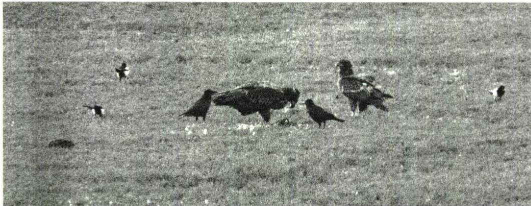
93 Zeearenden / White-tailed Eagles Haliaeetus albicilla , Hellegatsplaten, Zuid-Holland, 13 januari 1996 (Gerard L. Ouweeneel)

KRAANVOGELS TOT ALKEN In de periode vanaf 16 februari werden c 4000 Kraanvogels Grus grus geteld, met als piekperiode 8 tot 14 maart (3700). Een mannetje Kleine Trap Tetrax tetrax verbleef van 19 tot 27 maart bij de Inlagen van Westenschouwen, Zeeland. De Grote Trap Otis tarda van Rolde, Drenthe, was daar nog aanwezig tot 9 maart, terwijl er op 20 februari één langsvloog bij Kijkduin, Zuid-Holland. Groot was de verbazing toen op de plek van de Kleine Trap bij Westenschouwen van 30 maart tot 1 april een Griël Burhinus oediacnemus opdook. Deze vogel had een rode ring aan de rechterpoot en is waarschijnlijk afkomstig van de Engelse populatie waarvan veel vogels geringd zijn. Recordaantallen Goudplevieren Pluvialis apricaria (34 000) en Kieviten Vanellus vanellus (110 000) werden op 21 maart geteld bij Breskens. Een Steppekievit Chettusia gregaria verbleef vanaf 3 april bij Lopik. De eerste Ijslandse Grutto's Limosa limosa islandica werden gemeld op 31 maart (vijf) bij de Flaauwers Inlaag, Zeeland. Rosse Franjepoten Phalaropus fulicaria werden waargenomen op 17 februari bij Lauwersoog en op 20 februari bij Katwijk, Zuid-Holland. Kleine Burgemeesters Larus glaucooides werden gezien op 11 februari bij Ool, Limburg, op 18 februari in De Putten bij Camperduin en langs de Maas bij Waalwijk, Noord-Brabant, op 28 februari bij Katwijk en op 29 februari bij