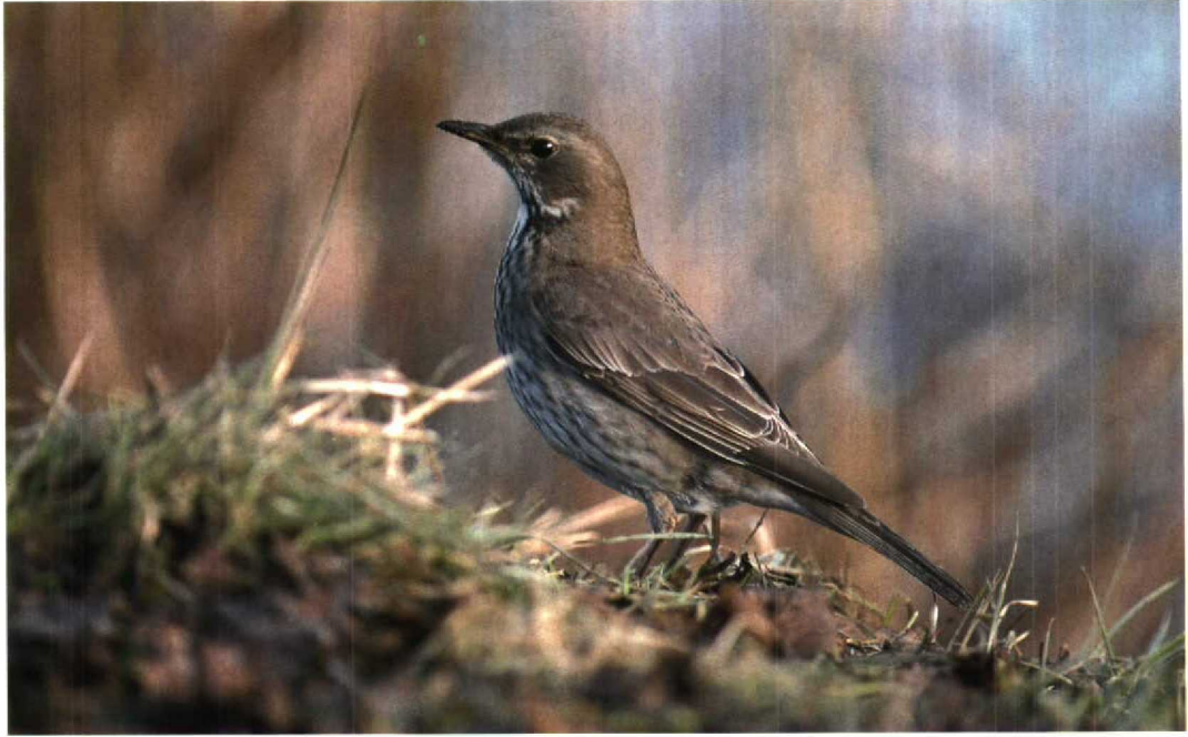
100 Zwartkeellijster / Black-throated Thrush Turdus ruficollis atrogularis , eerste-winter vrouwtje, Den Helder, Noord-Holland, 12 januari 1996

dag reeds verdwenen. Het mannetje Ringsnaveleend A. collaris van Blokkersdijk, Antwerpen, bleef nog de gehele periode aanwezig. Wilde Witooegeenden A. nyroca vebleven nog te Duffel, Antwerpen, tot 13 februari (op 19 februari te Pulle, Antwerpen); op Blokkersdijk op 11 februari; te Rotselaar, Brabant, van 11 tot 17 maart; en te Kallo-Doel, Oost-Vlaanderen (twee) op 17 maart. De eerste Kleine Topper A. affinis voor België was een eerste-winter mannetje dat van 15 tot 25 februari verbleef bij Sint-Kruis-Winkel, Oost-Vlaanderen. Een Rosse Stekelstaart Oxyura jamaicensis zwom op 3 maart bij Neerharen, Limburg. De eerste Zwarte Vrouwen Milvus migrans vlogen over Schulen, Limburg, op 22 maart en over Bertem, Brabant, op 30 maart. Er werden niet minder dan 66 Rode Vrouwen M. milvus waargenomen waarvan er 35 overvlogen tussen 24 en 27 februari. Op 4 februari vloog een adulte Zeearend Haliaeetus albicilla boven het spaarbekken te Merkem-Woumen, West-Vlaanderen, en op 11 februari pleisterde een onvolwassen vogel bij Mol, Antwerpen. Een ongedetermineerde arend Aquila trok op 9 maart over Blokkersdijk. De eerste Visarenden Pandion haliaetus verschenen te Latour, Luxemburg, van 27 tot 29 maart; te Lier op 28 maart; en te Beerse, Antwerpen, op 31 maart. Een bijzonder vroeg vrouwtje Roodpootvalk Falco vespertinus vloog op 31 maart over Meerhout, Antwerpen; enkele dagen later volgden nog twee andere waarnemingen in Vlaanderen. Slechtvalken F. peregrinus deden