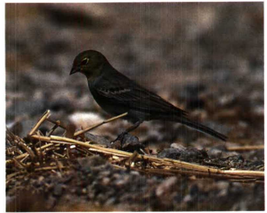
80 Laughing Gull / Lachmeeuw Larus atricilla , Sunderland, Tyne & Wear, England, February 1996 (Steve Young/Birdwatch) 81 Verreaux's Eagle / Zwarte Arend Aquila verreauxii , Wadi Rum, Jordan, 2 April 1996 (Ronald de Lange) 82 Lesser Scaup / Kleine Topper Aythya affinis , male, Tyttenhanger Gravel Pits, St Albans, Hertfordshire, England, April 1996 (Steve Young/Birdwatch) 83 Redhead / Roodkoopeend Aythya americana , male, Bleasby Gravel Pits, Nottinghamshire, England, March 1996 (Steve Young/Birdwatch) 84 American Coot / Amerikaanse Meerkoet Fulica americana , Stodmarsh, Kent, England, April 1996 (David Tipling) 85 Cinereous Bunting / Smyrnagors Emberiza cineracea , Eilat, Israel, March 1996 (Arie Ouwerkerk)