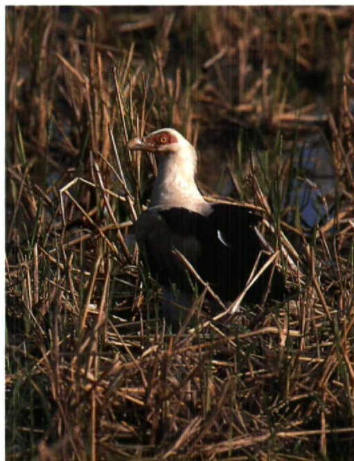
42 Swallow-tailed Bee-eater / Zwaluwstaartbijeneter Merops hirundineus , Casino Cycle Track, Serrekunda, The Gambia, 6 March 1995 (Roy de Haas) 43 Palm-nut Vulture / Palmgier Gypohierax angolensis , Casino Cycle Track, Serrekunda, The Gambia, 27 February 1995 (Roy de Haas) 44 Black Egrets / Zwarte Reigers Egretta ardesiaca , Casino Cycle Track, Serrekunda, The Gambia, 27 February 1995 (Roy de Haas)