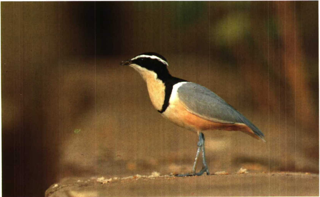
46 Egyptian Plover / Krokodilwachter Pluvianus aegyptius , Parc National du Niokolo Koba, Senegal, 7 February 1989