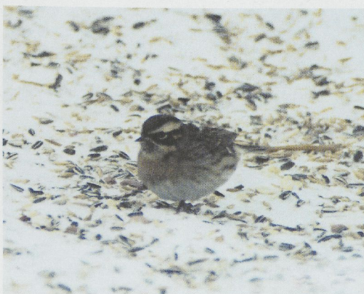
27 Caspian Yellow-legged Gull / Kaspische Geelpootmeeuw Larus cachinnans cachinnans , Etaples, Pas-de-Calais, France, 1 February 1997 (Anthony McGeehan) 28 American Herring Gull / Amerikaanse Zilvermeeuw Larus argentatus smithsonianus , first-winter, Belfast, Antrim, Northern Ireland, 15 February 1997 (Anthony McGeehan) 29 Pied-billed Grebe / Dikbekfuut Podilymbus podiceps , South Norwood, Greater London, England, February 1997 (Steve Young/Birdwatch) 30 Little Bittern / Woudaap Ixobrychus minutus , Quinta do Lago, Algarve, Portugal, 1 February 1997 (Ray Tipper) 31 Buff-bellied Pipit / Amerikaanse Waterpieper Anthus rubescens , Träslövsläge, Halland, Sweden, January 1997 (Michael Bergman) 32 Black-throated Accentor / Zwartkeelheggenmus Prunella atrogularis , Pieksämäki, Finland, February 1997 (Harry J Lehto)