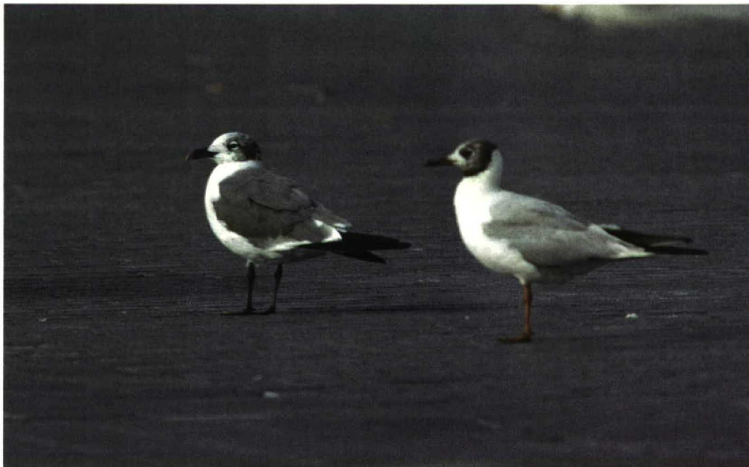
220 Lachmeeuw / Laughing Gull Larus atricilla , Groningen, Groningen, 22 augustus 1997

Na het nieuws via de semafoons te hebben verspreid arriveerden de eerste verhitte Groningers, sommigen in nogal ongewone outfit, op de plek. Pas na een half uur vloog de Lachmeeuw weer over. Toen de eerste mensen 'uit het land', getergd door files, arriveerden, liep het al tegen vijven. De vogel was al uren zoek, nadat hij nog even bij een sluis c 800 m verderop was gezien. Maar gelukkig vloog hij om c 17:30 opnieuw