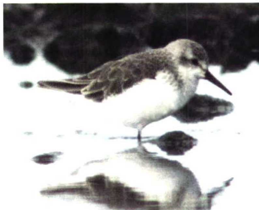
203 Red-billed Tropicbird / Roodsnavelkeerkringvogel Phaethon aethereus , Porto Santo ferry, Madeira, Portugal, 23 July 1997 204 Oriental Pratincole / Oostelijke Vorkstaartplevier Glareola maldivarum , Workumerwaard, Friesland, Netherlands, 1 August 1997 205 Semipalmated Sandpiper / Grijs Strandloper Calidris pusilla (right), Julianadorp, Noord-Holland, Netherlands, 3 August 1997 206 Western Sandpiper / Alaskastrandloper Calidris mauri , Musselburgh, Lothian, Scotland, August 1997

Geronticus eremita were counted on 14 July. A record number of 2000 Greater Flamingos Phoenicopterus roseus bred in Sardinia, Italy, in 1997.