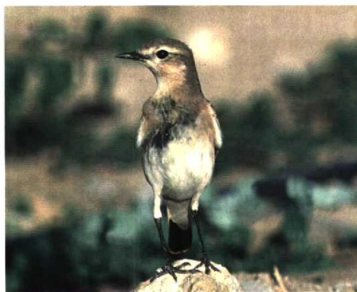
162 Northern Wheatear / Tapuit Oenanthe oenanthe , first-winter, southern Sicily, Italy, September 1996 (Valerio Cappello). Note pale upperparts and extensive pale fringes on wing, similar to Isabelline Wheatear O isabellina , but note also distinctive, even dark spotting on higher wing, black-centred greater coverts not contrasting with alula, long tail, long primary projection and broad, very striking supercilium 163 Isabelline Wheatear / Izabeltapuit Oenanthe isabellina , southern Sicily, Italy, March 1996 (Valerio Cappello). Note very pale ear-coverts and typical supercilium, but note also rather strong contrast between wing (especially higher part) and mantle and scapulars, contrasting dark centres of tertials, dark primaries and dark tail 164 Northern Wheatear / Tapuit Oenanthe oenanthe , Texel, Noord-Holland, Netherlands, 22 September 1996 (Arnoud B van den Berg) 165 Isabelline Wheatear / Izabeltapuit Oenanthe isabellina , Eilat, Israel, 3 November 1986 (Arnoud B van den Berg)

RUMP & UPPERTAIL-COVERTS (SLIGHTLY OR NOT VARIABLE; REASONABLY RELIABLE) In Isabelline, the white on the uppertail-coverts and rump, as well as on the rectrices, is less extensive and less noticeable than in Northern; hence, the contrast between black (on tail) and white (on uppertail-coverts and rump) is less evident than in Northern. During flight, this contrast stands out visibly in Northern, very striking even at a distance.